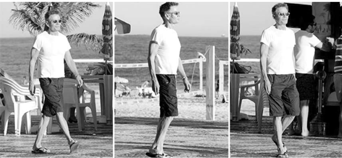
Estrangeiros aproveitam maravilhas do Brasil

Estamos no esquentado para a Copa do Mundo e parece que a percepção dos gringos sobre o Brasil está começando a mudar. Os famosos começam