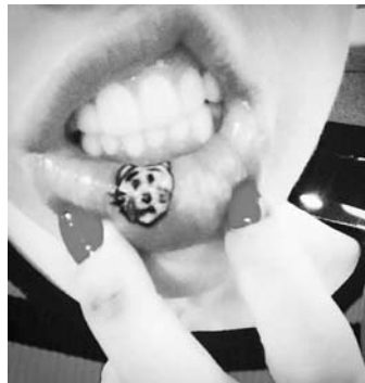
Cantora mais uma vez é destaque

Miley com certeza não estava de brincadeira quando escolheu como primeiro single de seu álbum a música “We Can’t Stop”, que poderia ser traduzida de maneira não literal como “não para, não para, não para não”