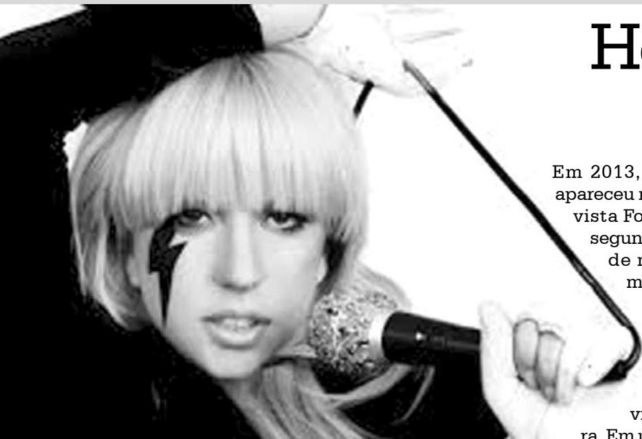
Diva confessa que já passou maus momentos

Em 2013, Lady Gaga apareceu na lista da revista Forbes como a segunda celebridade mais rica do mundo. Mas nem sempre a conta bancária esteve tão recheada na vida da cantora. Em um documentário exibido pelo canal