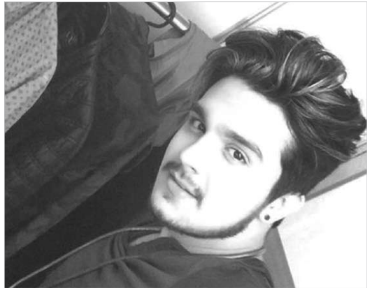
“Estou deixando o cabelo crescer um pouquinho, quero um pouquinho mais do lado. Gosto de estar sempre mudando para os meus fãs”, disse o sertanejo

Além deles, os cantores Kanye West e Ricky Martin, a ex-RBD Dulce Maria e o ator Oliver Phelps (da saga “Harry Potter”) já passaram pelo país este ano. Será o início de uma nova era na maneira como os estrangeiros nos veem?