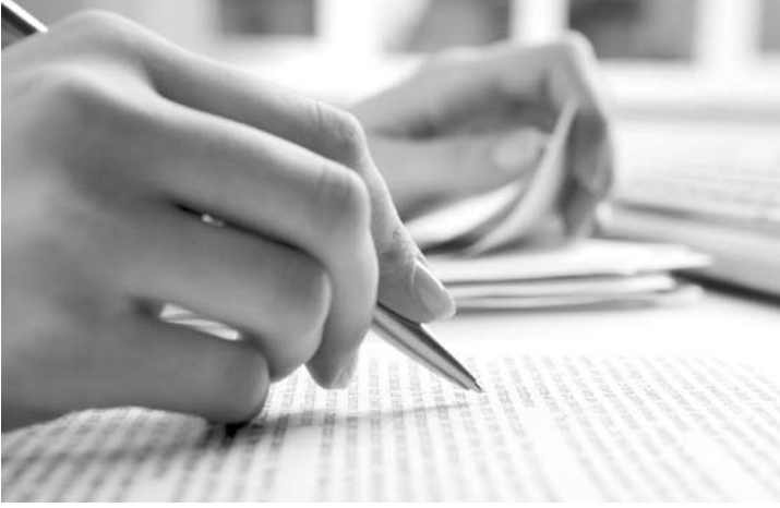
Podem participar pessoas com idade mínima de 15 anos

Candidatos com deficiência terão atendimento especial assegurado. Candidatos privados de liberdade ou que cumprem medidas socioeducativas também estão aptos.