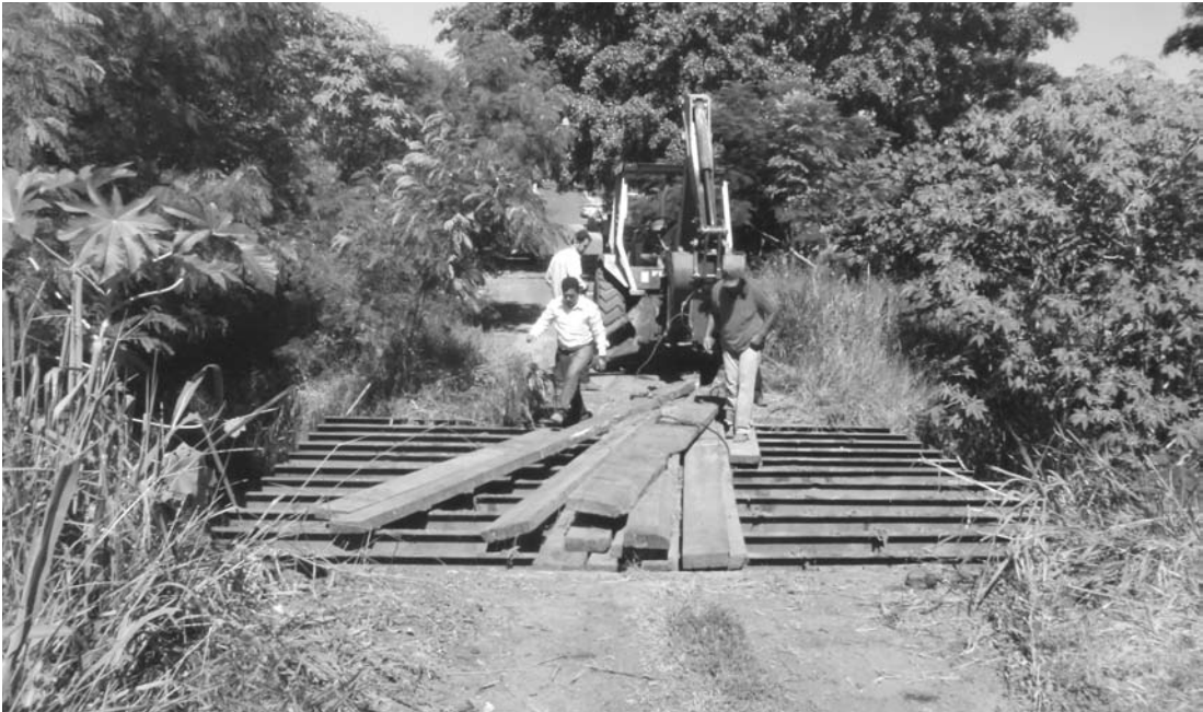
A antiga ponte de madeira na Rua Nossa Senhora de Santana (imagem acima) está sendo retirada e será substituída por uma nova, com estrutura metálica

Rua Pio XII. O trânsito no local deverá ser liberado ainda na sexta-feira, após a conclusão dos serviços. A Prefeitura de Fernandópolis pede a compreensão de todos que transitam pelo local, já que a interdição se faz necessária para que a nova ponte metálica seja devidamente instalada.