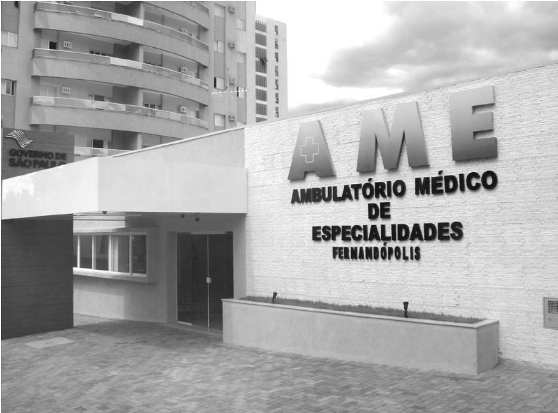
AME Fernandópolis atende pacientes de toda a região

O AME Fernandópolis fica na Rua Milton Terra Verde, 45, no Jardim Santa Helena, e funciona de segunda a sexta-feira, das 7h às 19h.