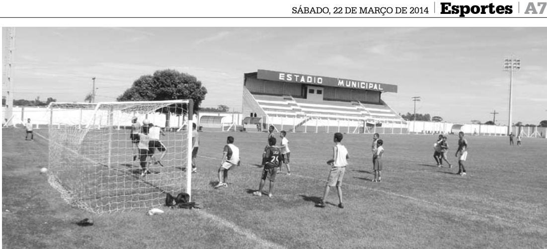
Centenas de crianças cadastradas no projeto municipal são acompanhadas e orientadas durante atividades esportivas