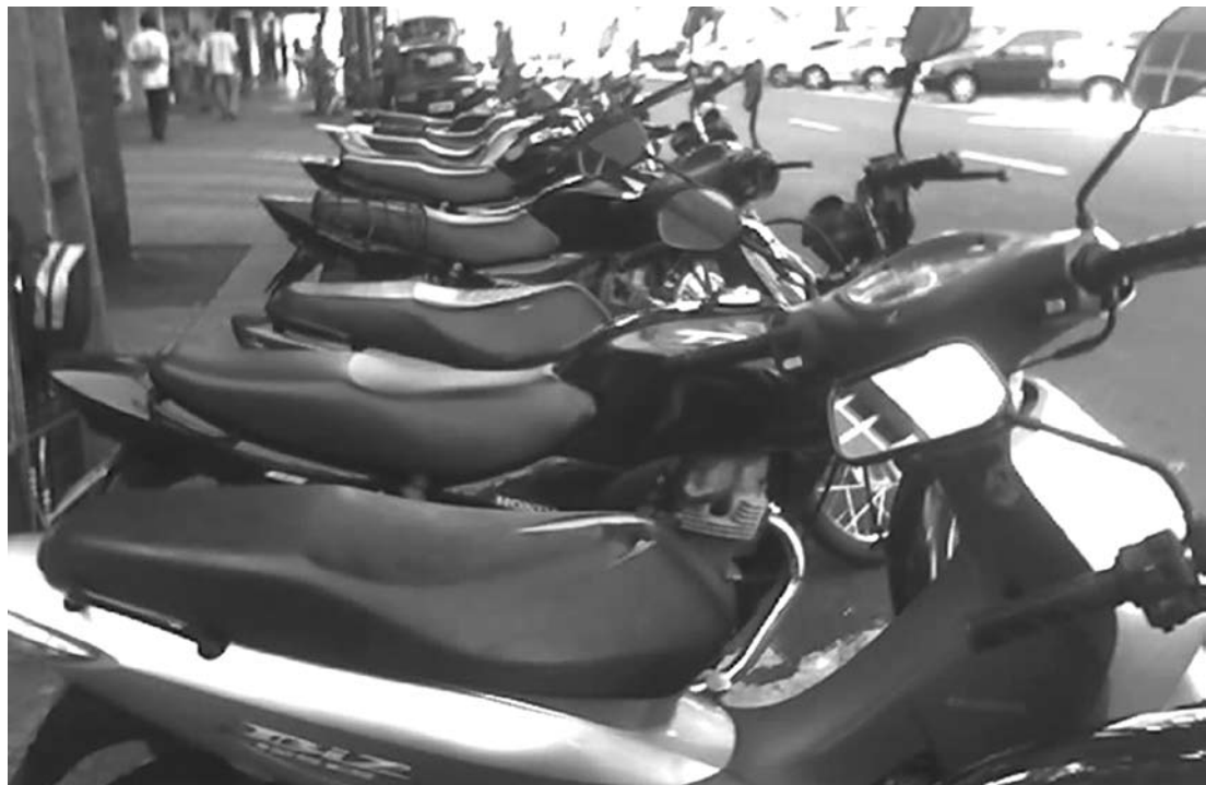
São quase 15 mil motos na cidade segundo a Secretaria Municipal de Trânsito

A frota de veículos tem aumentado bastante, o que faz com que o consumo de combustíveis aumente acima do varejo, apesar do preço aumentar acima da inflação geral. Isso tem estimulado o crescimento da venda de combustíveis no país, apesar dos preços mais altos,