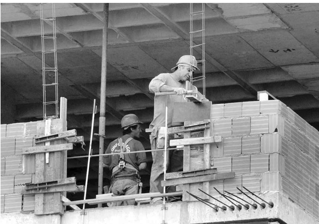
Foram contratadas 280 pessoas na construção civil, sendo 59 vagas a mais que no ano passado

Em Votuporanga o setor da construção civil empre-