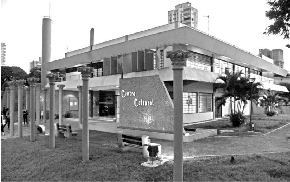
Centro Cultural de Fernandópolis, sede do Teatro Municipal e da Secretaria da Cultura