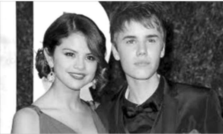
Se bem que, em termos de criança fofa, Selena está anos-luz à frente do bofe...