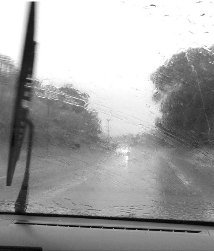
Os próximos três dias serão de aumento da temperatura e chuvas isoladas

Semana termina com aumento na temperatura e chuva em todo Estado de São Paulo