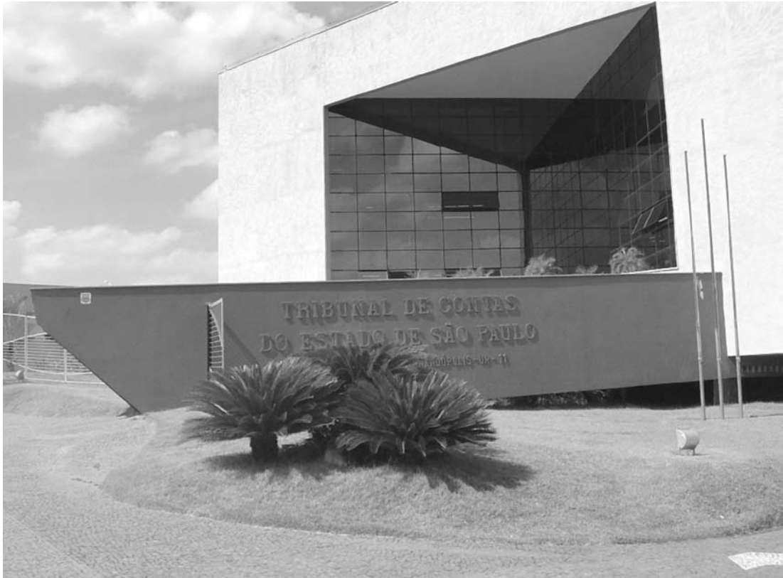
Meridiano vai sediar o evento que acontece também em outras 20 cidades paulistas

O Ciclo de Debates com Agentes Políticos e Dirigentes Municipais é voltado principalmente para um público de Prefeitos, Presidentes de Câmaras e demais agentes públicos, que terão também a oportunidade de tirar dúvidas sobre pontos de interesse para a