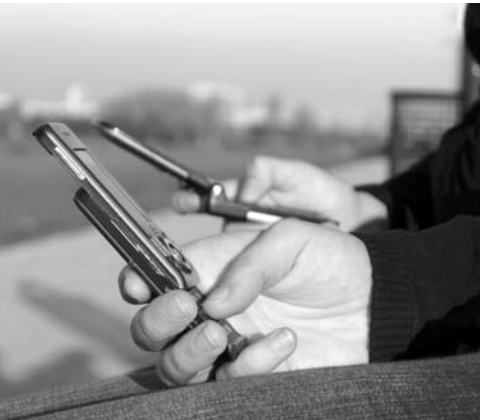
As linhas pré-pagas continuam sendo a maioria entre os brasileiros

A teledensidade em fevereiro chegou a 134,97 acessos para cada grupo de 100 habitantes. As linhas pré-pagas continuam sendo a maioria (77,77%) e as pós-pagas representam 22,23% do total. A banda larga móvel totalizou 110,19 milhões de acessos. Desse total, os terminais 4G somavam 1,82 milhão.