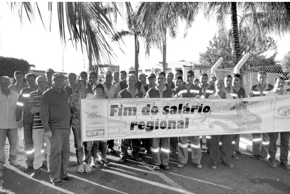
Funcionários da Sabesp cobram melhores salários

Colaboradores reivindicam equiparação de salário com trabalhadores da Capital