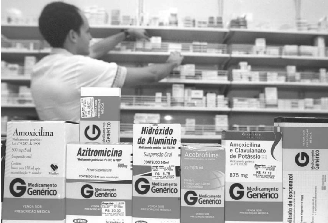
A regulação é válida para mais de 9 mil medicamentos

ta, a regulação é válida para mais de 9 mil medicamentos, sendo que mais de 40% deles estão na categoria nível três - de menor concorrência, cujas fábricas só poderão ajustar o preço teto em 1,02%.