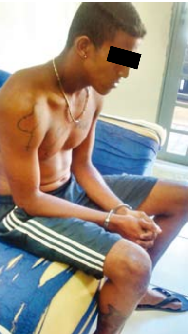
Um dos detidos pela Polícia nesta quarta-feira ao lado de armas e munições apreendidas em Ouroeste