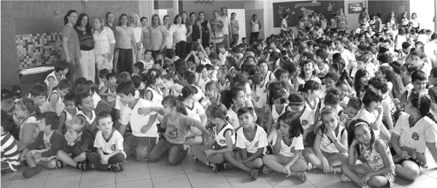
Centenas de alunos reunidos durante o início das entregas dos vales para aquisição de material escolar