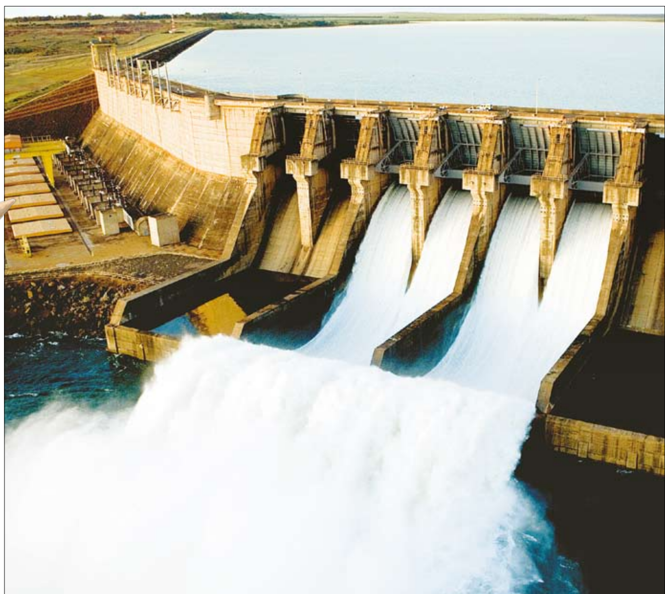
Vertedouros da Usina de Água Vermelha: operação com 29,48% da capacidade pela falta de chuvas

Ação da Procuradoria Geral do Estado já tem deputados estaduais como investigados na "Máfia do Asfalto". Página A5