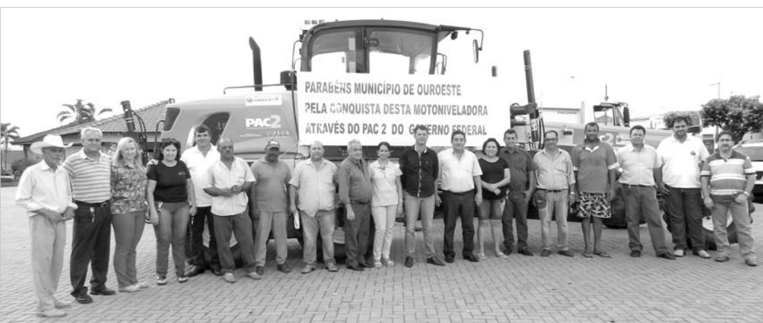
A doação da motoniveladora vai proporcionar ainda mais melhorias na infra-estrutura viária do município