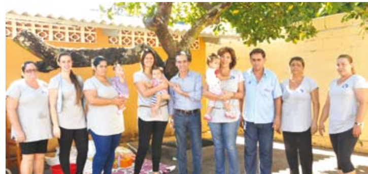
Visita ao Orfanato “Nosso Lar”