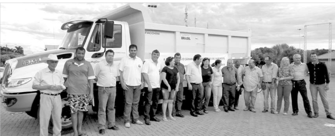
Autoridades e servidores municipais comemoraram a conquista do caminhão-caçamba

municipal. As máquinas ficarão expostas na Praça de Eventos nos próximos dias. De acordo com o prefeito Tião Geraldo, com a doação das novas máquinas, a administração poderá proporcionar ainda mais melhorias na infraestrutura viária do município, através da recuperação de estradas vicinais para escoamento da produção agrícola, contribuindo assim com o desenvolvimento da agricultura familiar.