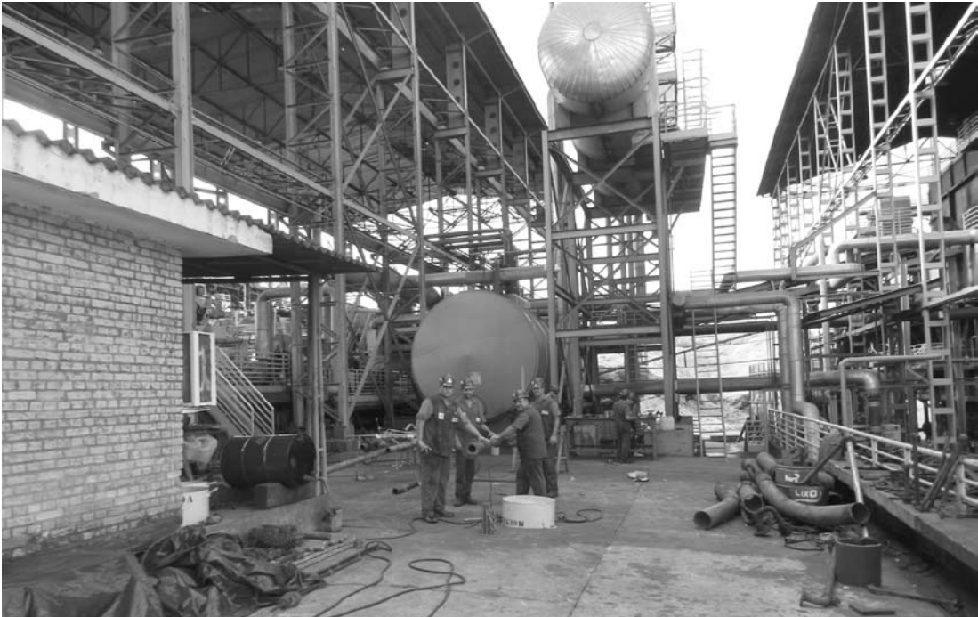
No primeiro trimestre do ano a equipe da Alcoeste fez manutenção industrial da unidade

A UPI (Unidade de Produção Independente) adquirida pela companhia por R$ 187 milhões, em leilão judicial em novembro de 2013, foi uma das primeiras do Brasil a entrar em operação. A expectati-