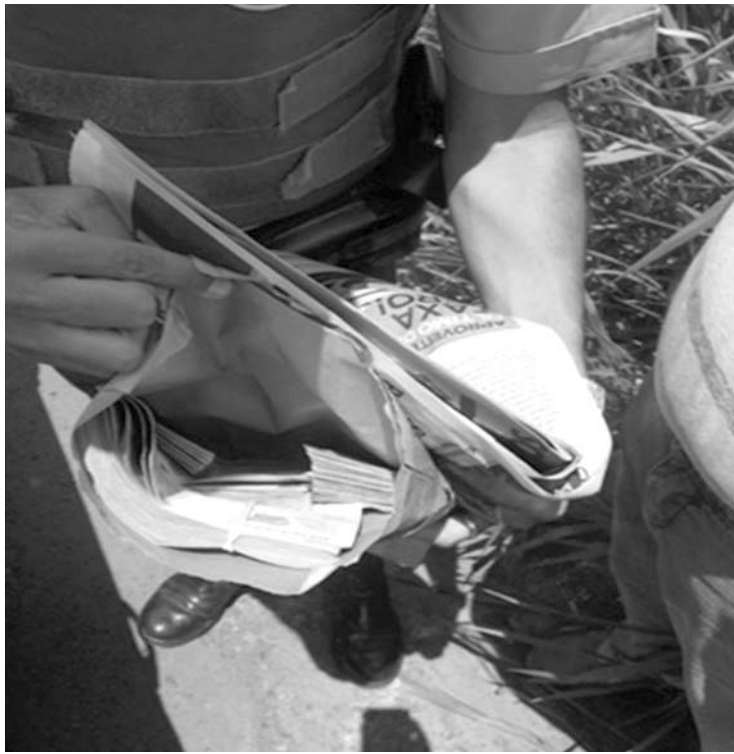
Documentação e objetos apreendidos pela Polícia Federal em Votuporanga durante a Operação Fratelli, que desbancou a Máfia do Asfalto