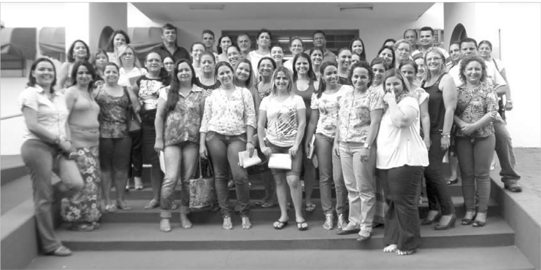
A administração vem investindo na capacitação continuada dos professores e funcionários que atuam nas Escolas Municipais

quantidade de cana-de-açúcar para moer agora em março, quando projetamos finalizar a safra 2013/2014. Em Penápolis a situação foi atípica, porque existia matéria-prima em condições de ser colhida, mas ficou no campo durante as negociações", explicou.