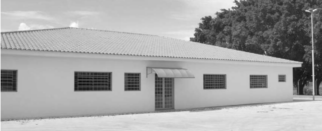
Área está pronta para receber novos alunos