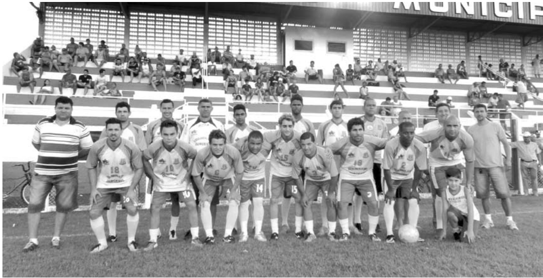
Jogadores que defendem o Clube Esportivo de Ouroeste

→ Da REDAÇÃO contato@oextra.net O C.E.O. - Clube Esporti- vo de Ouroeste, vai enfren- tar a equipe de Mira Estre- la neste final de semana. O “clássico regional” de fute- bol acontece amanhã, dia 30, às 14h, no Estádio Mu- nicipal Manoel Dias da Sil- va, em Ouroeste. A equipe do C.E.O. está atualmente sob o comando de uma no- va diretoria e sendo prepa- rada pelo técnico “Duda”. “Participem e prestigiem a equipe da casa!”, convida a nova diretoria do C.E.O.