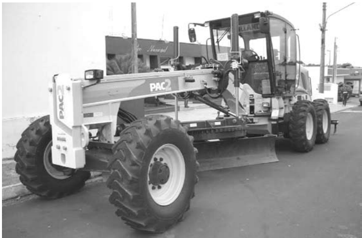
Novos equipamentos adquiridos pelo município através de convênios assinados pela prefeita Nilza