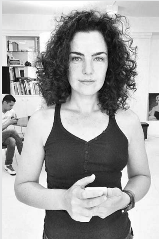
Ana Paula vive dias de felicidade