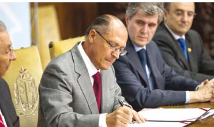
A cerimônia aconteceu no Palácio dos Bandeirantes, onde o governador Geraldo Alckmin assinou o primeiro lote de convênios de 2014 com diversos municípios do Estado

→ Da REDAÇÃO contato@oextra.net O prefeito de Ouroeste, Tião Geraldo, esteve no início da semana passada, dia 24 de março, no Palácio dos Bandeirantes, onde o governador Geraldo Alckmin assinou o primeiro lote de convênios com municípios do Estado em 2014. O