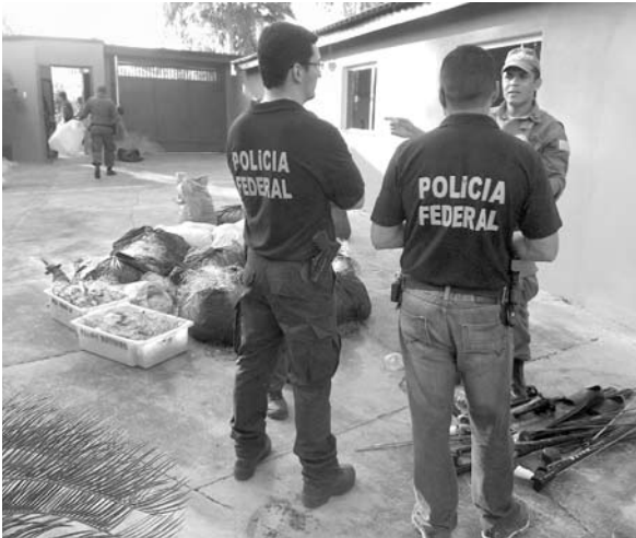
Policiais Federais e Ambientais durante apreensão de barco, motor de popa e diversos pretechos de pesca

Tudo foi registrado pelas câmeras da Usina. O barco utilizado por ele, com motor de popa de 40 HPs, também foi apreendido. Uma busca minuciosa foi realizada em sua residência com o objetivo de encontrar outros produtos relacionados com a pesca ilegal. Nos outros locais das buscas, várias redes de pescas e pe-