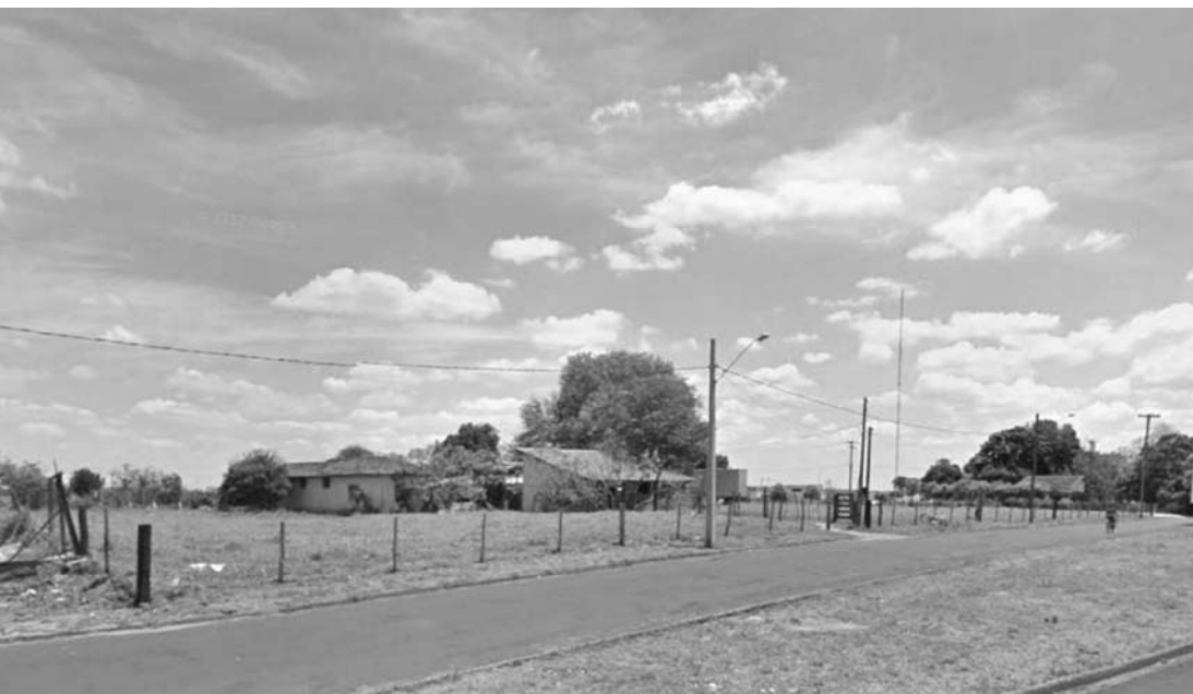
Área onde serão construídas as unidades assistenciais