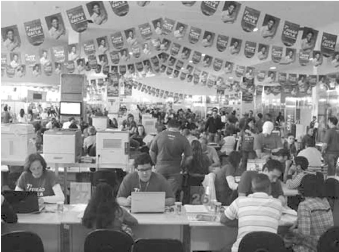
Evento acontece entre os dias 10 e 12 de abril em Fernandópolis

caixa.com.br , no qual os interessados podem fazer consultas por estado, cidade, bairro e marca do veículo, e conferir o brinde oferecido. Para contratar o Crédito Auto Caixa, o cliente precisa apresentar carteira de identidade, CPF e comprovantes de renda e de residência. Em Fernandópolis, entre os dias 10 e 12 de abril, o Salão da Caixa acontece na Ford Wells da avenida Expedicionários Brasileiros.