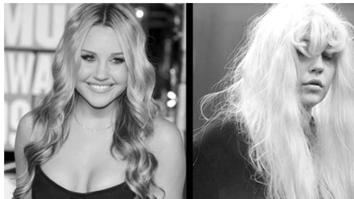
Amanda: antes e depois dos surtos

Relembre: a atriz chegou a anunciar sua aposentadoria aos 24 anos, voltou atrás, mas nunca mais estreou nenhuma produção. Ela ainda coleciona polêmicas: foi presa após bater o carro em uma viatura e fugir do local, dirigir embriagada, fazer uso de drogas como maconha e, é claro, brigar com uma galera pelo Twitter.