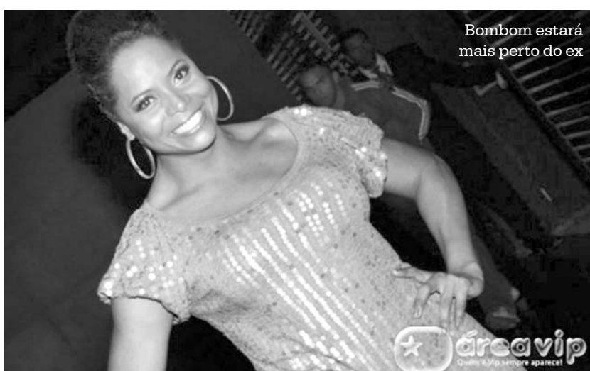
Bombom estará mais perto do ex