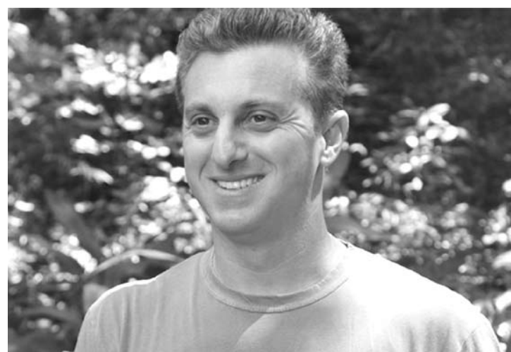
Huck sempre sorridente

“Sou um mulherão de 1,53m”, disparou. “Ser um mulherão depende muito da interpretação. Eu posso fazer vários tipos de mulheres como atriz, desde uma menininha até uma mais madura, tenho essa vantagem”, explicou, pra não sair de convencida.