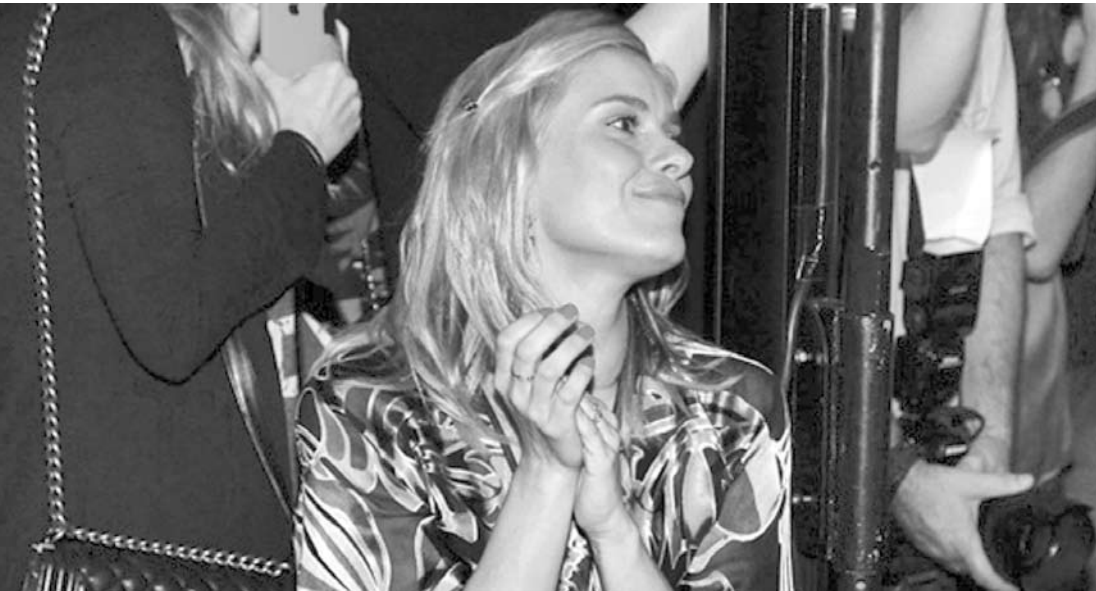
Atriz homenageia profissionais da construção civil