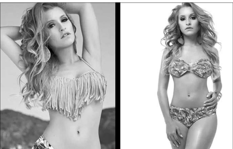
Confiança é tudo!

Carla Diaz ficou fora de foco por um tempo e agora, toda vez que dá as caras, ela mostra seu lado sensual para ressaltar que não é mais a menininha que estrelava “Chiquititas”. Em mais um desses ensaios, ela apareceu de biquíni e falou de sua carreira.