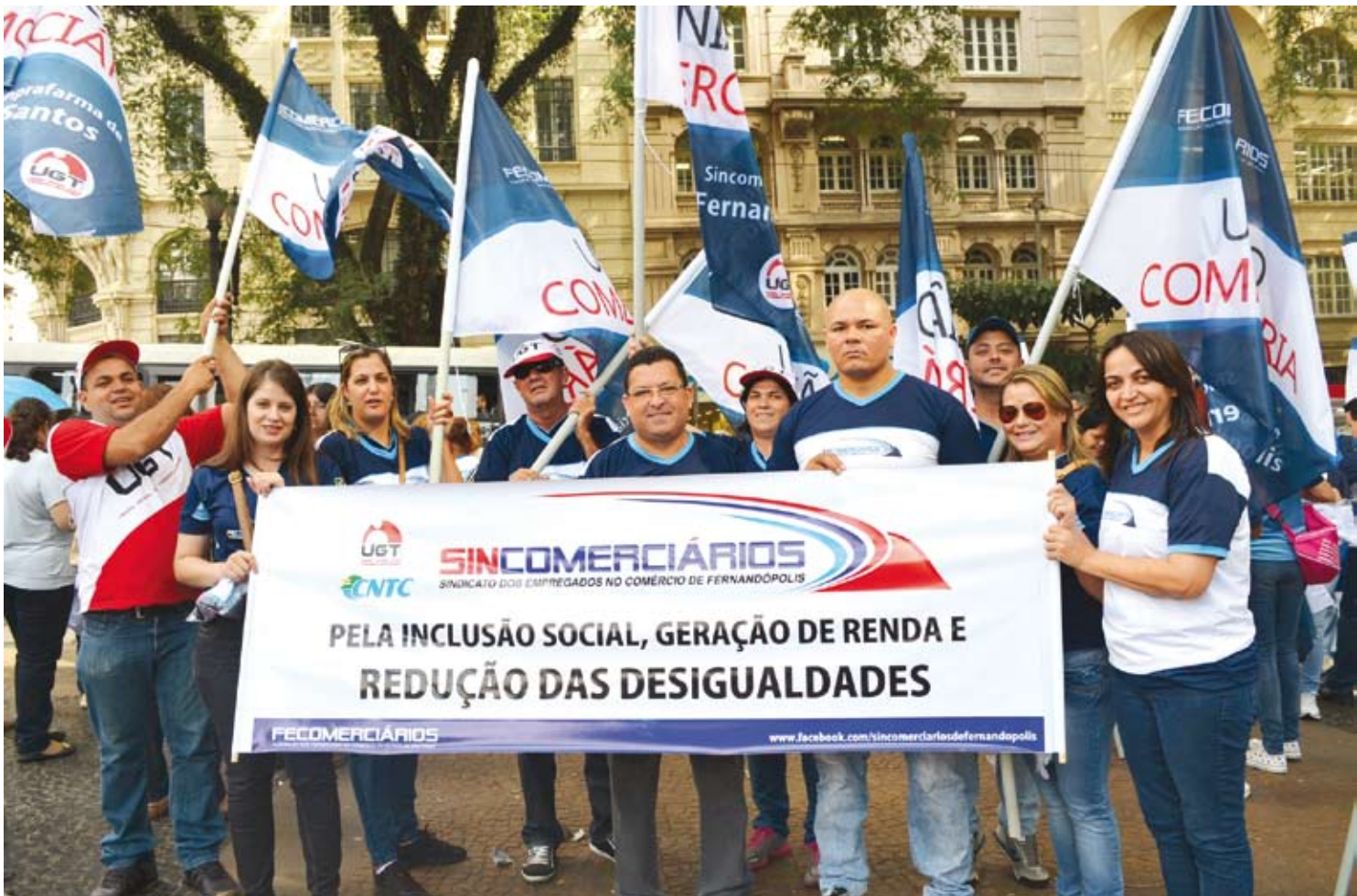
A 8ª Marcha foi organizada pelas seis Centrais Sindicais: UGT, CUT, CTB, CGTB, Nova Central e Força Sindical

A 8ª Marcha foi organizada pelas seis Centrais Sindicais: UGT, CUT, CTB, CGTB, Nova Central e Força Sindical. Unidade e organização marcaram a ação das Centrais pela luta do trabalhador rumo ao avanço das conquistas da classe trabalhadora no Congresso Nacional. O que se espera é um diálogo e conquista das suas