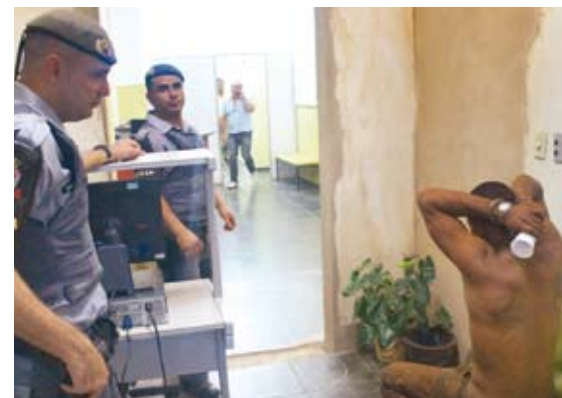
Cenas da perseguição que mobilizou mais de 20 policiais. Na sequência, o acusado já detido na sede do Plantão Policial Permanente: "preso em flagrante"