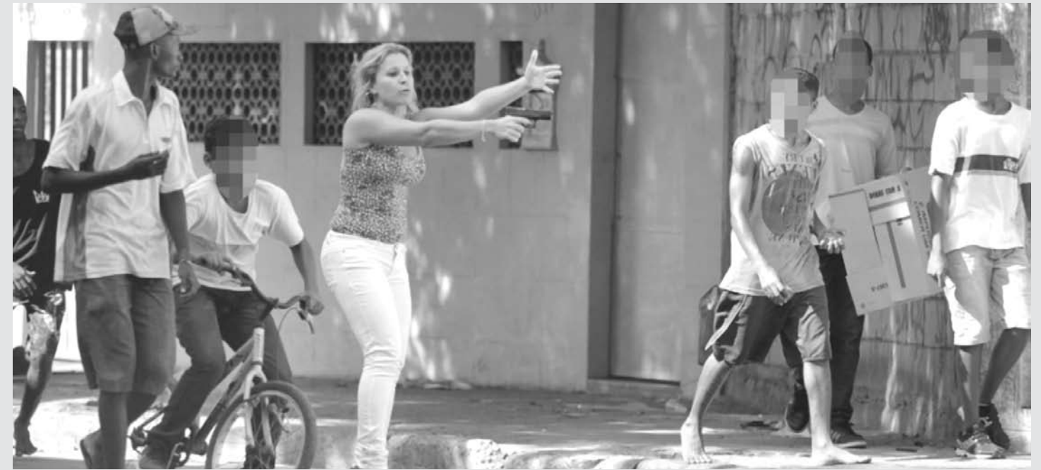
imagem do dia

Policial à paisana sai de seu carro com uma arma na mão para conter um grupo de pessoas que estava na avenida Leopoldo Bulhões, na altura da favela do Jacarezinho, na zona Norte do Rio de Janeiro, na manhã de sexta-feira (11). A favela fica próxima ao prédio da antiga Telerj (Telecomunicações do Estado do Rio de Janeiro) no Engenho Novo, que tinha sido invadido por cerca de 6 mil pessoas e ontem passou por desocupação de posse, que acabou em confronto com a polícia. Com a confusão, os ocupantes correram pelas ruas do bairro e deixaram um rastro de destruição pelo caminho. Três agências bancárias foram depredadas nos arredores do Engenho Novo. Além dos vários focos de incêndio, um veículo de uma emissora de TV foi apedrejado. Cerca de 1.000 pessoas estavam no entorno do prédio, resistindo à reintegração.