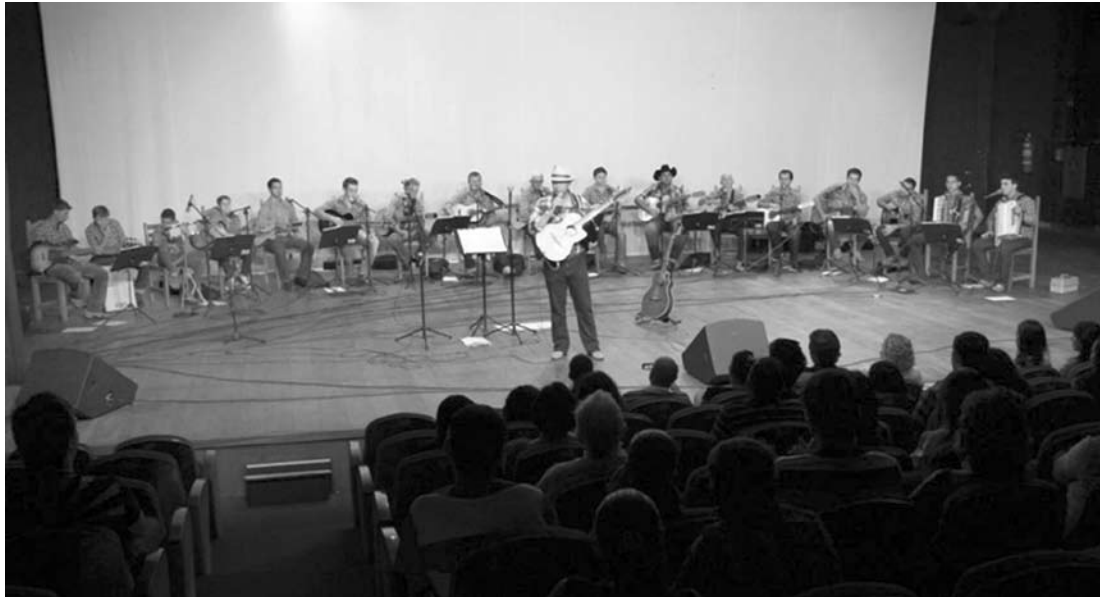
Grupo de viola caipira em recente apresentação no Teatro Municipal

As inscrições poderão ser feitas durante o mês de abril, sempre às segundas-feiras, das 18h às 20h, com o próprio maestro, no Teatro