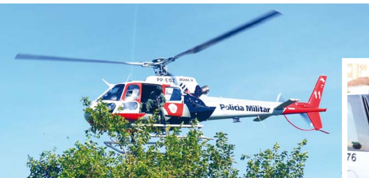
Helicóptero Águia da Polícia Militar foi acionado para auxiliar na perseguição. No detalhe acima, o momento da prisão do acusado pela PM

Depois de 5 horas de buscas, a Polícia Militar prendeu um homem de 34 anos, acusado de fazer parte de um bando que estava assaltando casas na Zona Sul de Fernandópolis. Mais de vinte po-