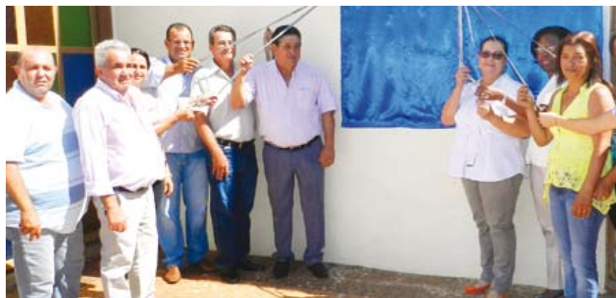
Autoridades municipais entregam as novas instalações

quarta-feira e já disponibiliza cursos de qualificação profissional de aulas de corte e costura, modelagem e empreendedorismo. Página B5