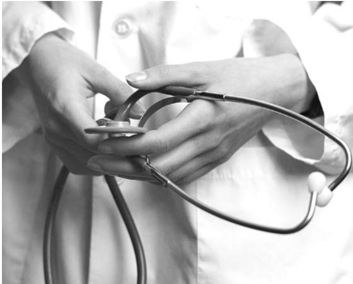
Nenhum médico brasileiro cadastrado no programa Mais Médicos se inscreveu para atuar nas unidades de saúde em Fernandópolis

POSTINHOS Até o final do ano a meta da Secretaria Municipal de Saúde é implantar outras 8 equipes e garantir 100% de atendimento na cidade com a implantação de unidades de saúde no Rosa Amarela, Centro e no Núcleo da Cesp, sendo a última para atender a demanda dos bairros Santista, Santa Filomena, Santo Afonso e adjacentes. Ontem, em sessão extraordinária, os vereadores aprovaram a liberação de recursos para a constru-