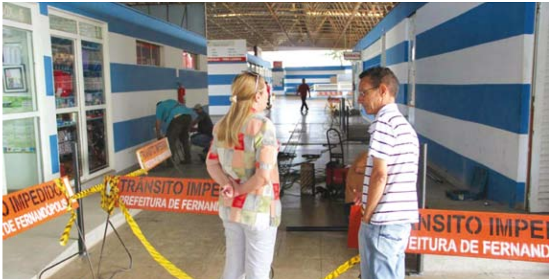
A previsão é de que as obras sejam entregues em Dezembro deste ano

Os investimentos para construção da UBS do Rosa Amarela são provenientes da parceria entre Ministério da Saúde e Prefeitura. O município entrará com uma contrapartida no valor de R$44.147,31, sendo que