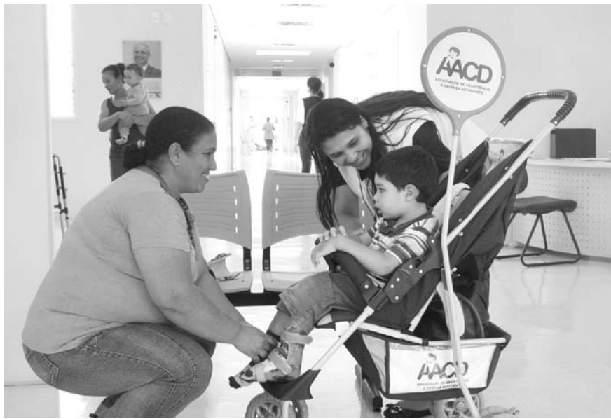
A AACD de Rio Preto atende pacientes de 124 cidades da região noroeste

Representantes da AMA (Associação dos Municípios da Araraquarense), que congrega 124 prefeituras na região de Rio Preto, se reuniram com a AACD para tentar uma extensão desse