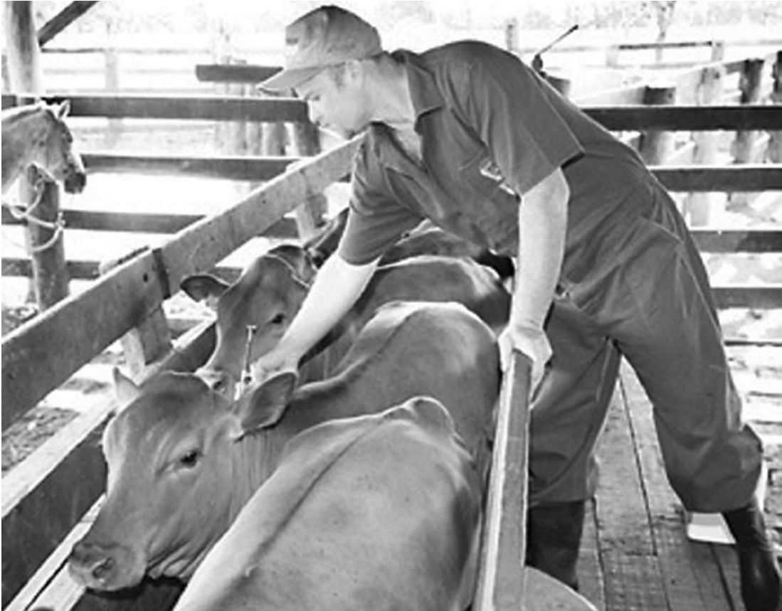
A vacinação contra Aftosa acontece em maio e o criador tem até o dia 07 de junho para comunicar a vacinação ao Escritório de Defesa Agropecuária

E o criador tem até o dia 7 de junho para comunicar a vacinação ao Escritório de Defesa Agropecuária (EDA). Para os criadores que providenciaram senha de acesso, a comunicação deverá ser feita diretamente na internet pelo sistema GEDAVE, na declaração deve constar o número da nota fiscal de aquisição da(s) vacina(s) bem como a declaração do rebanho bovino e bubalino por faixa etária e sexo. O acesso ao sistema GEDA-