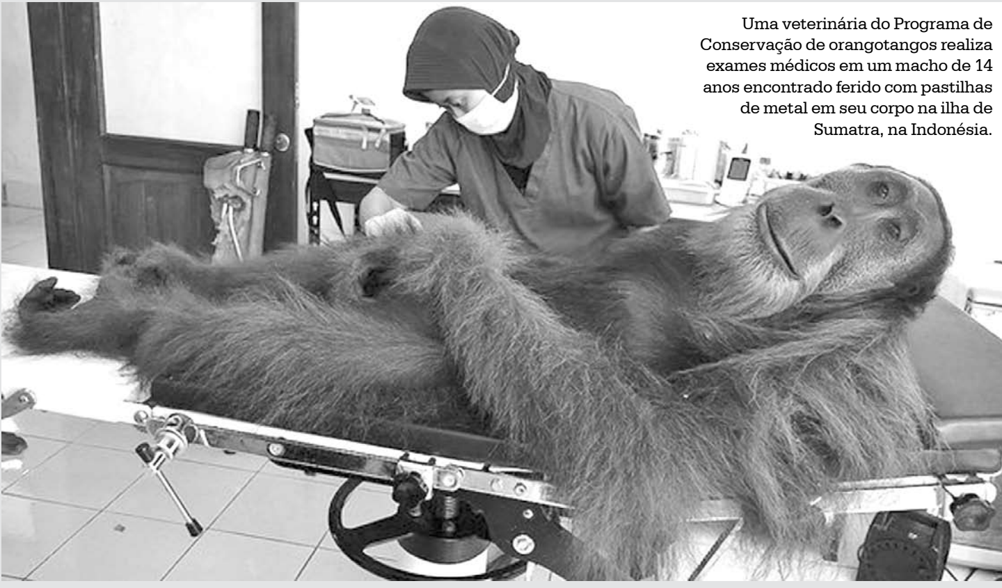
Uma veterinária do Programa de Conservação de orangotangos realiza exames médicos em um macho de 14 anos encontrado ferido com pastilhas de metal em seu corpo na ilha de Sumatra, na Indonésia.