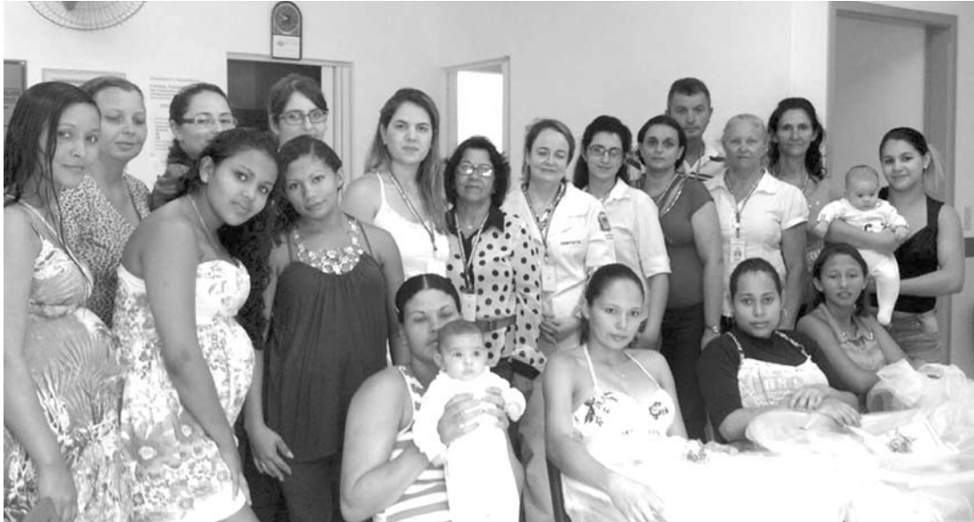
Gestantes foram contempladas com presentes ao final das aulas

A Secretaria Municipal de Saúde promoveu um Curso Preparatório para Gestantes no Distrito de Brasitânia, com duração de oito encontros. O encerramento aconteceu na última quarta-feira, 16, com a entrega de enxovais às 10 participantes.