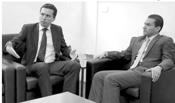
Encontro entre Fausto Pinato e o presidente nacional do PRB, Marcos Pereira