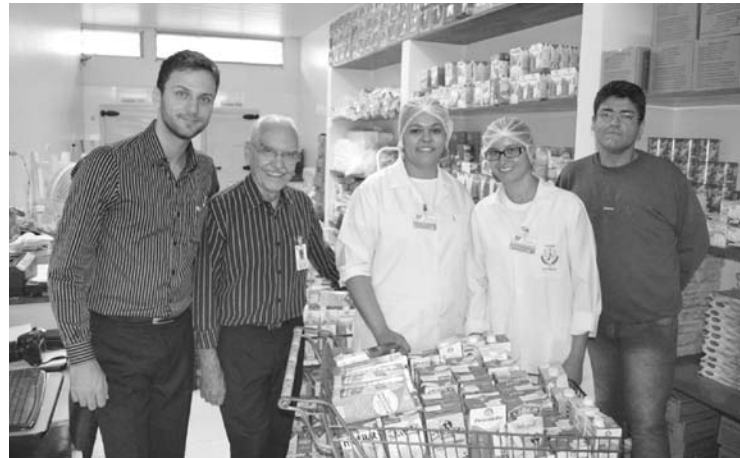
Entidades durante entrega dos donativos à Santa Casa. Consumo mensal de leite no hospital é em torno de 1.900 litros