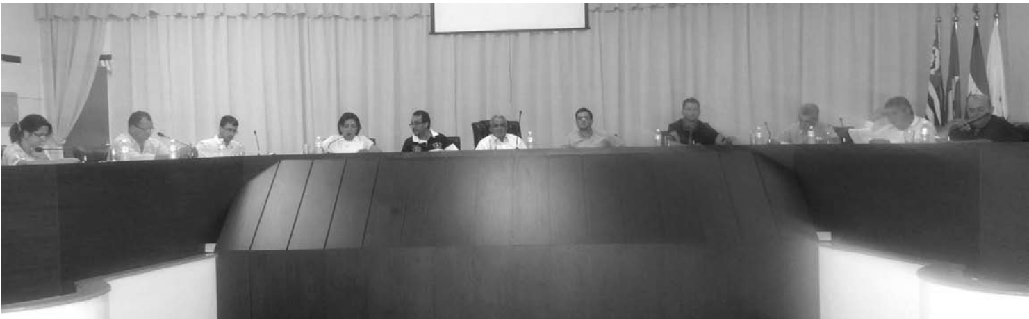
Vereadores durante a última sessão ordinária que aprovou dois Projetos de Lei para construção de novas escolas

Outros projetos também foram votados nesta semana. O Projeto de Lei nº