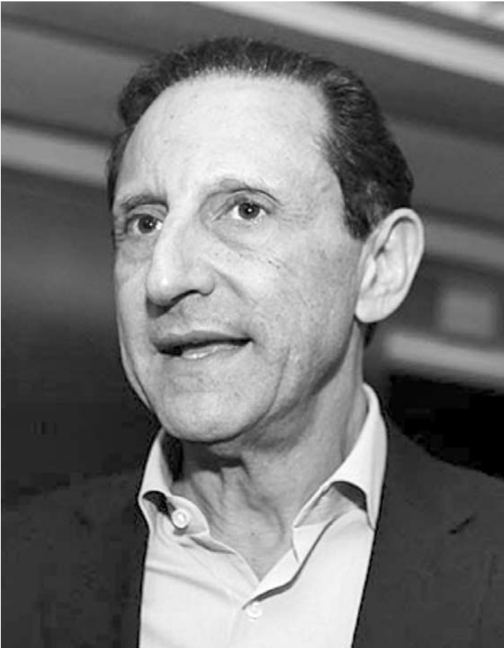
Paulo Skaf, que será homenageado na tarde de hoje na Escola Sesi