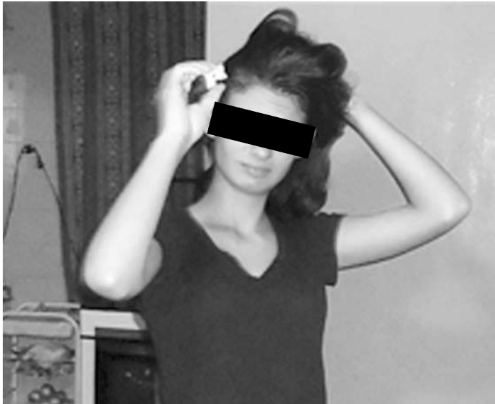
A. volta para Cardoso acompanhada pelos pais

Iniciado um trabalho intenso de buscas, após cinco dias do desaparecimento, A. foi localizada em Vacaria (RS), a 1.170 kms de Cardoso. Policiais e conselheiros tutelares da cidade se deslocaram