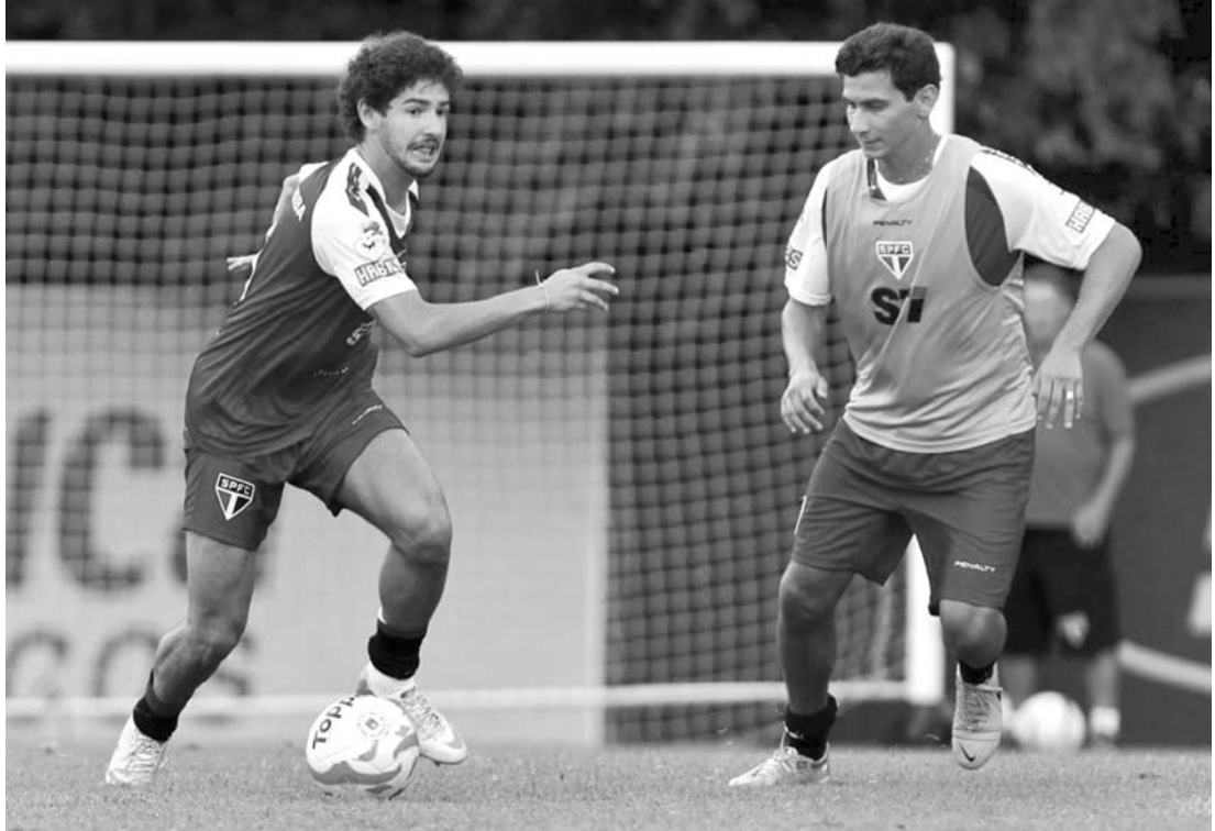
Esquema tático de Muricy Ramalho conta com a força da dupla Pato e Ganso, em alta no Tricolor

Também pela Copa do Brasil, o Corinthians en-