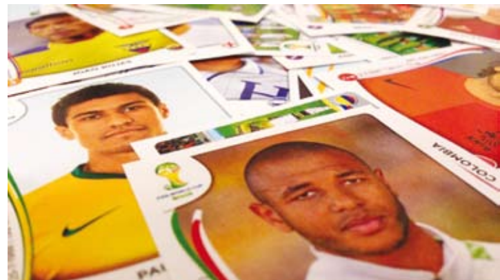
O álbum normal tem 640 cromos, sendo que 40 são especiais metalizados

equipe especializada. Ela sabe que pode "registrar" jogadores que não vão ser convocados, por serem preteridos pelos treinadores ou por contusão antes do mundial, mas considera baixa a margem de erro. Neymar é o garoto-propaganda desta edição que traz algumas curiosidades como a presença de Robinho no time brasileiro. Os jogadores brasileiros escolhidos foram: Julio César, Thiago Silva, David Luiz, Dani Alves, Marcelo, Dante, Ramires, Paulinho, Luiz Gustavo, Hernanes, Oscar, Bernard, Willian, Robinho, Neymar, Hulk e Fred. Na banca "O Seho", que fica no Mercado em Fernandópolis, as figurinhas também estão disponíveis, mas não haverá ponto de troca porque no local o horário de funcionamento é encerrado às 18 horas.