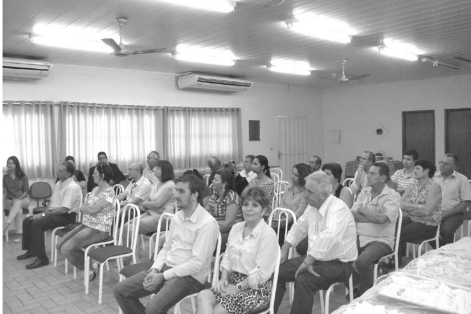
Público presente ao evento em Pedranópolis prestigiando mais uma conquista para o município