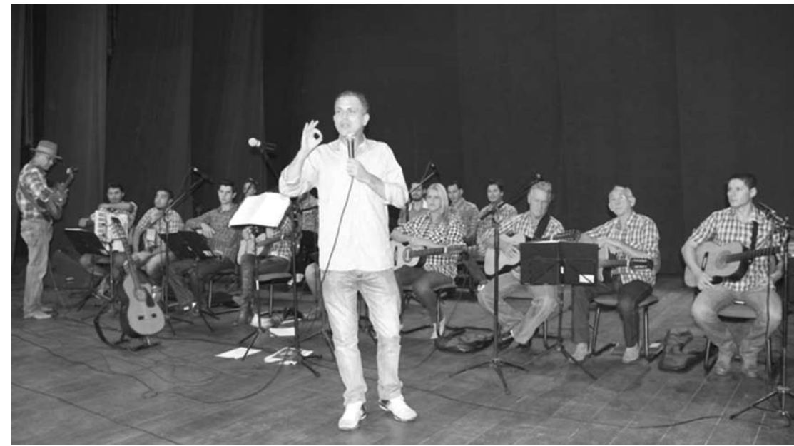
O evento foi promovido pela Secretaria Municipal da Cultura, em parceria com a FEF

O evento foi promovido pela Secretaria Municipal da Cultura, em parceria com a Fundação Educacional de Fernandópolis (FEF). Professores da área de ciências humanas da instituição deverão encaminhar trabalhos sobre o tema tratado na palestra – “O Vampiro Americano X o Caipira Brasileiro”, quando se discutiu a invasão cultural norte-americana no Brasil, em detrimento das manifestações autenticamente brasileiras.