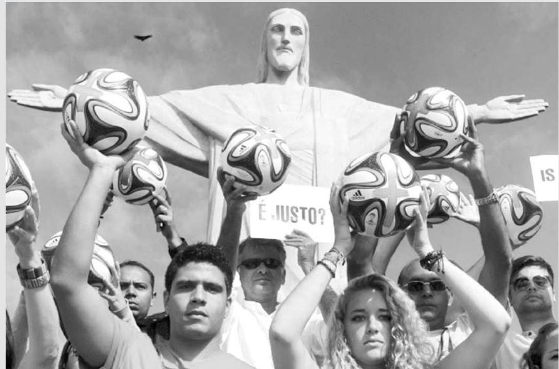
imagem do dia

O Morro do Corcovado foi palco de um protesto contra os gastos públicos na Copa do Mundo na manhã de ontem. Um grupo formado por voluntários da ONG Rio de Paz, que logo ganhou a adesão de turistas que estavam no local, inclusive do exterior, exibiu bolas e cartazes aos pés do Cristo Redentor. Além de doze bolas da Copa com uma cruz vermelha pintada sobre elas simbolizando “o desperdício” de dinheiro público nas sedes do Mundial, a ONG também confeccionou quatro cartazes – dois deles em inglês – com as perguntas “É justo?” e “Quem lucra mais? Fifa, empresários ou o povo brasileiro?”