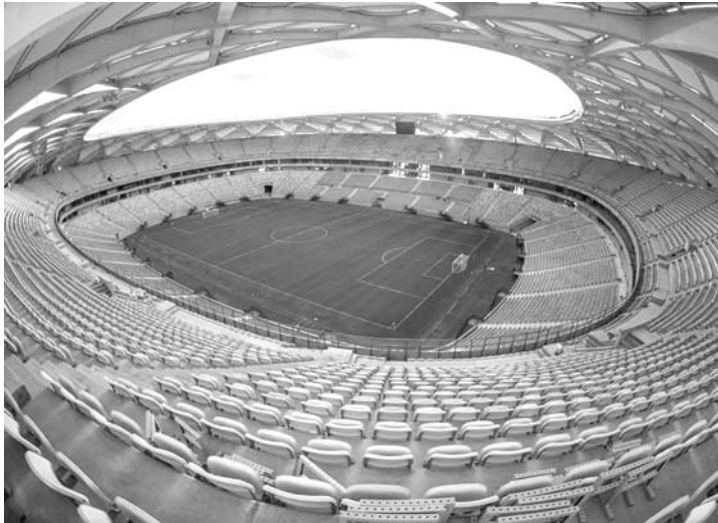
Arena da Amazônia, palco do confronto entre Nacional e Corinthians, hoje à noite, pela Copa do Brasil

na, no Paraguai, em busca da classificação para as quartas de final. Outro mineiro na competição que leva o campeão à disputa do Mundial de Clubes da Fifa, o Atlético joga amanhã, no Estádio Independência, contra o Nacional de Melellín. O Galo foi derrotado por 1 x 0 e só a vitória interessa ao time de Levir Culpi.