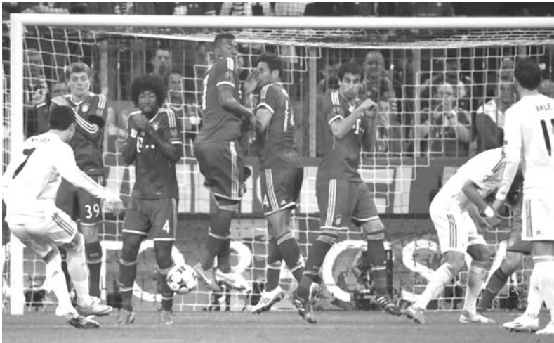
Lances dos dois gols de CR7: no segundo, o artilheiro português bateu falta rasteira, por baixo da barreira, “matando” o goleirão Neuer