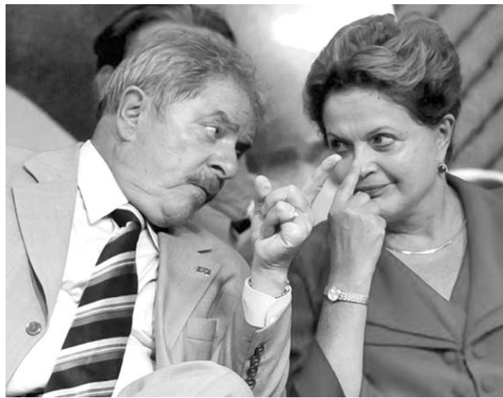
A avaliação do governo da presidenta Dilma Rousseff caiu entre fevereiro e abril

intenções, contra 29,3% do oponente. Com relação a Eduardo Campos, a presidenta venceria com 41,3%. Caso Aécio Neves e Eduardo Campos se enfrentassem em um segundo turno, Aécio venceria com 31,3% dos votos contra 20,1%. A pesquisa da CNT ouviu 2.002 pessoas entre os dias 20 e 25 de abril, nas cinco regiões brasileiras, em 137 municípios de 24 unidades da Federação. A margem de erro é 2,2 pontos percentuais e a pesquisa foi registrada junto à Justiça Eleitoral. VOLTA LULA O ministro-chefe da Secretaria-Geral da Presidência da República, Gilberto Carvalho, afirmou ontem que “não há hipótese” de o PT tirar a presidenta Dilma Rousseff da disputa pela reeleição para substituí-la pelo ex-presidente Luís Inácio Lula da Silva. Na segunda-feira, o lí-