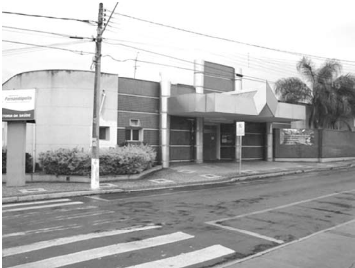
Populares não viram a ação rápida dos bandidos, defronte à Central da Saúde; carro avaliado em torno de R$ 25 mil não tinha seguro

A frota da Secretaria da Saúde conta com cerca de vinte veículos, entre ônibus, carros, peruas e ambulâncias, nenhum deles é assegurado.