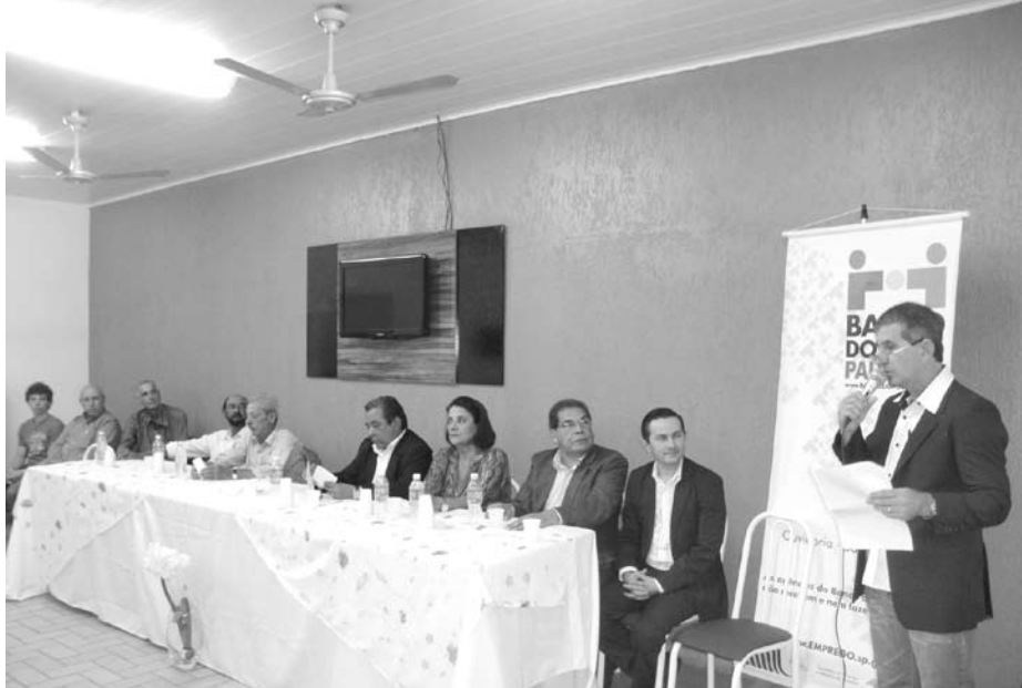
O prefeito Betinho agradeceu ao governo estadual durante seu discurso, ressaltando também a importância de todos os colaboradores da Prefeitura