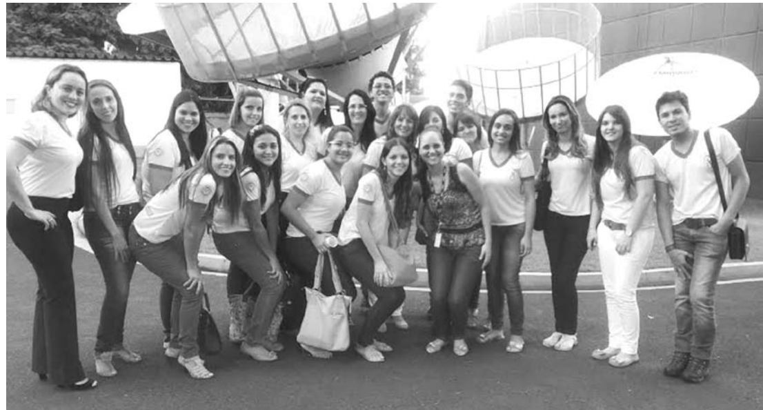
Programação especial contou com a presença de convidados especiais e alunos

A proposta da campanha foi ressaltar a formação profissional de fonoaudiólogos junto a atuação nas mídias, em especial com jornalistas esportivos. Além disso, reforçar a integração entre as áreas, bem como orientar a população em geral sobre os abusos vocais rotineiramente cometidos, sinais e sintomas de uma lesão vocal definitiva e cuidados para manter a saúde vocal.