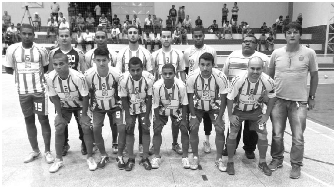
Equipe adversária desta semifinal, o Penápolis comemorou o empate