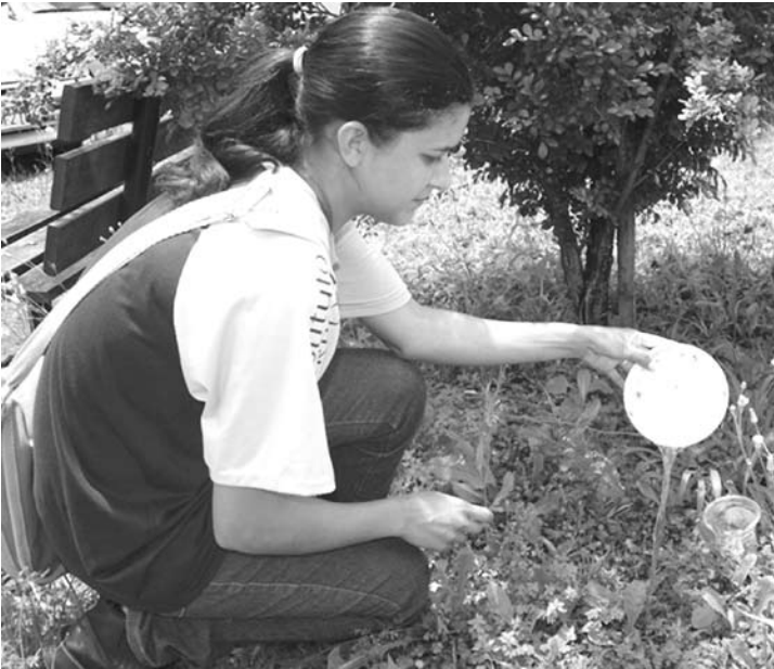
Agentes orientam a população de como eliminar criadouros do mosquito nos quintais