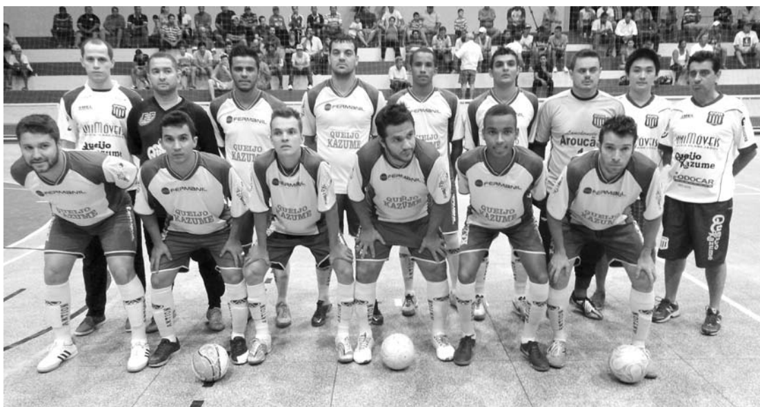
Atletas e comissão técnica do time de futsal fernandopolense em General Salgado

Confira na edição do próximo sábado, dia 3 - o “Extra.net” não circulará amanhã devido ao feriado do