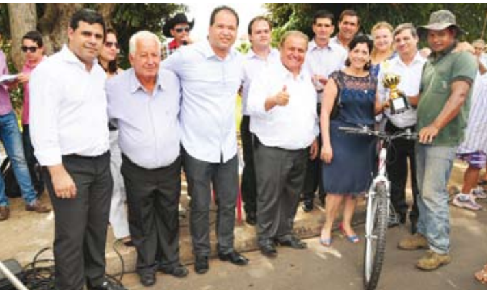
Chopplândia recebeu o tradicional Campeonato de Pesca