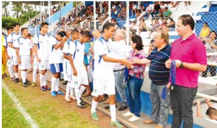
Campeonato Infanto-Juvenil no Centro Desportivo “Raphael Cavalin”