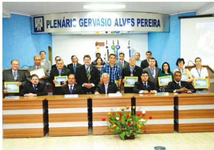
Câmara Municipal homenageou ilustres cidadãos com a Medalha “3 de Maio”