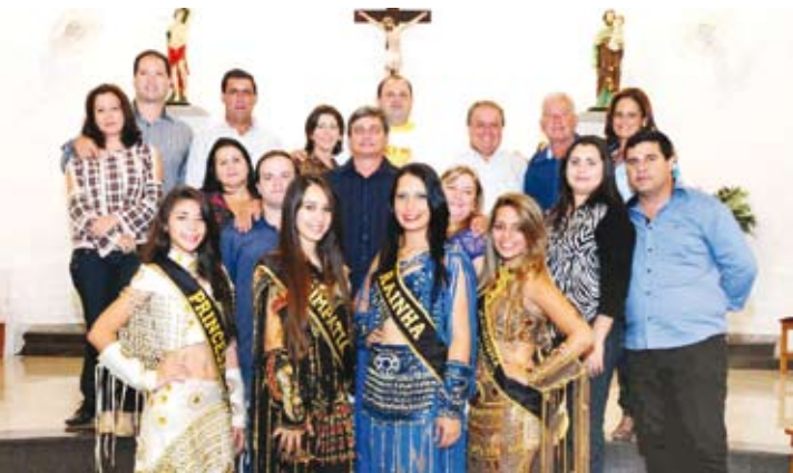
Missa em Ação de Graças celebrada na Paróquia São Sebastião