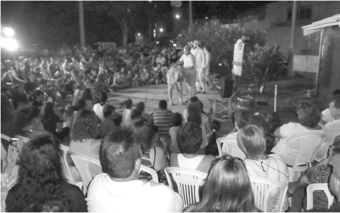
Intervenções artísticas na Praça receberam um excelente público no Circuito Sesc