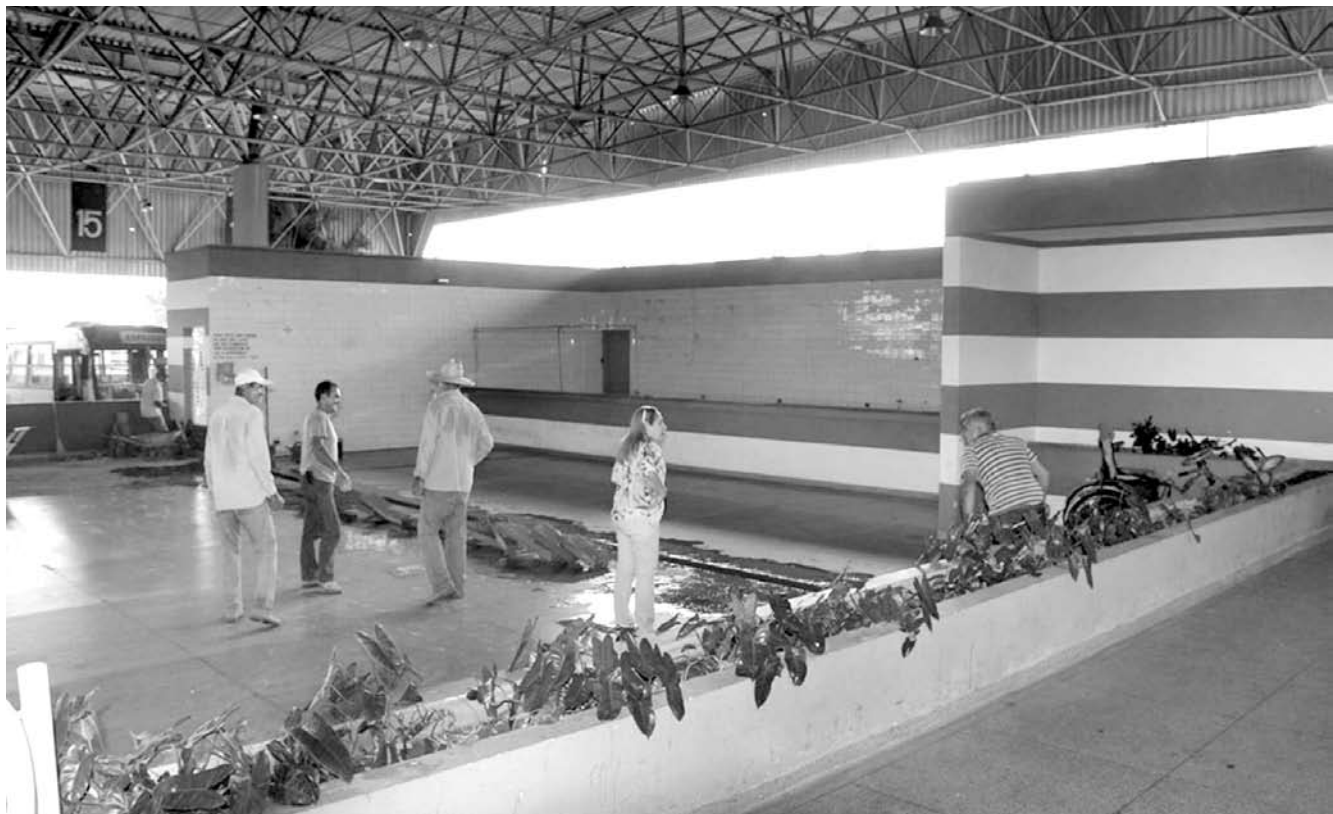
Reforma visa melhorar as condições do Terminal Rodoviário