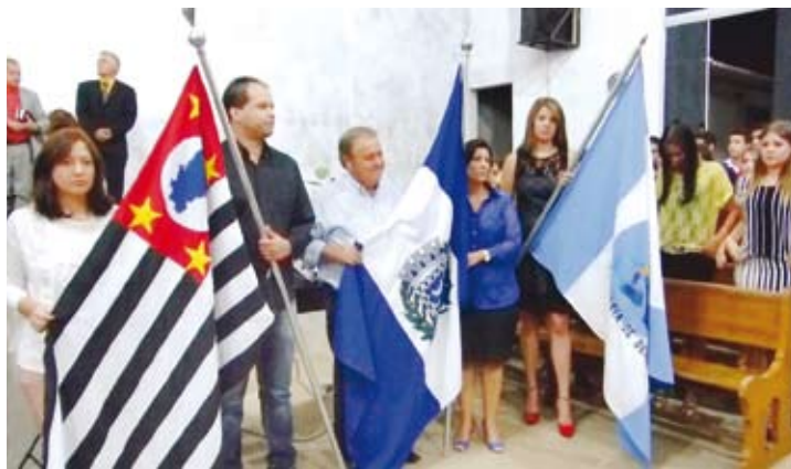
Culto em Ação de Graças na Igreja Assembleia de Deus – Ministério Belém