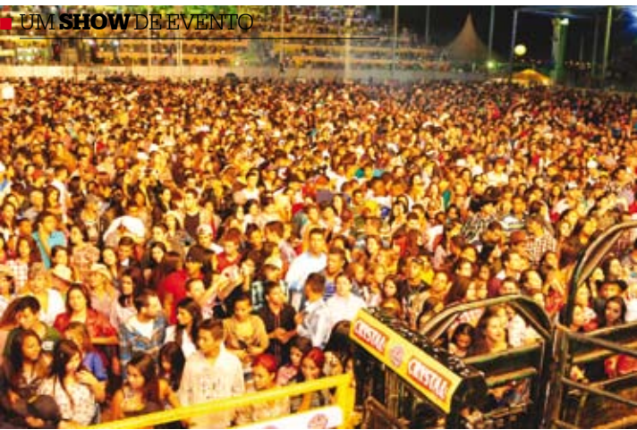
29ª Festa do Peão recebeu cerca de 120 mil pessoas durante quatro noites