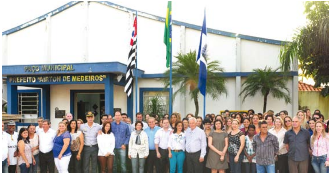
Hasteamento dos Pavilhões no Paço Municipal