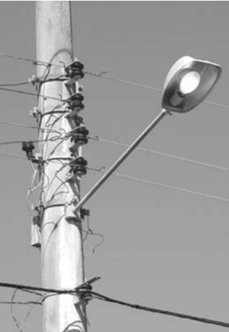
Jogando luz na licitação da iluminação pública: novo modelo de manutenção dos serviços em breve entrará em vigor