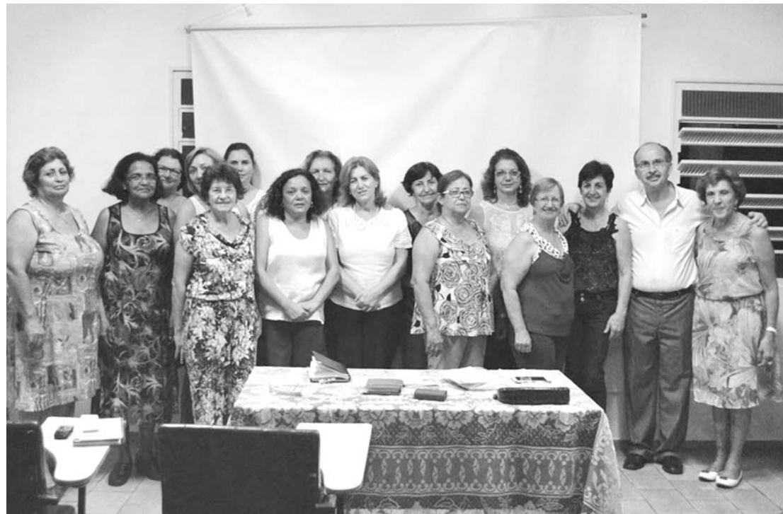
Nova diretoria da Volfer