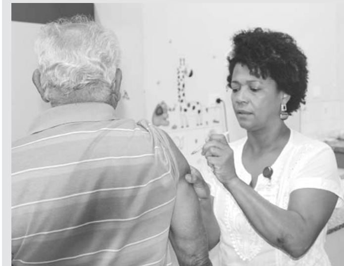
Quem pertence aos grupos prioritários e ainda não foi vacinado deve procurar uma das UBSs da cidade ou a Central da Saúde

Até o fim da Campanha as Unidades de Saúde estarão atendendo em horário normal. Mais informações na Secretaria Municipal da Saúde pelo telefone (17) 3465 0566.