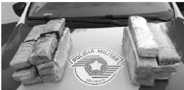
Os 14 tijolos de maconha foram encaminhados à perícia do Instituto de Criminalística

A Polícia Militar Rodoviária prendeu, por volta das 7h30 de segunda (12), duas garotas de programa que transportavam 10,7 quilos de droga, na Rodovia Marechal Rondon, em Castilho – distante