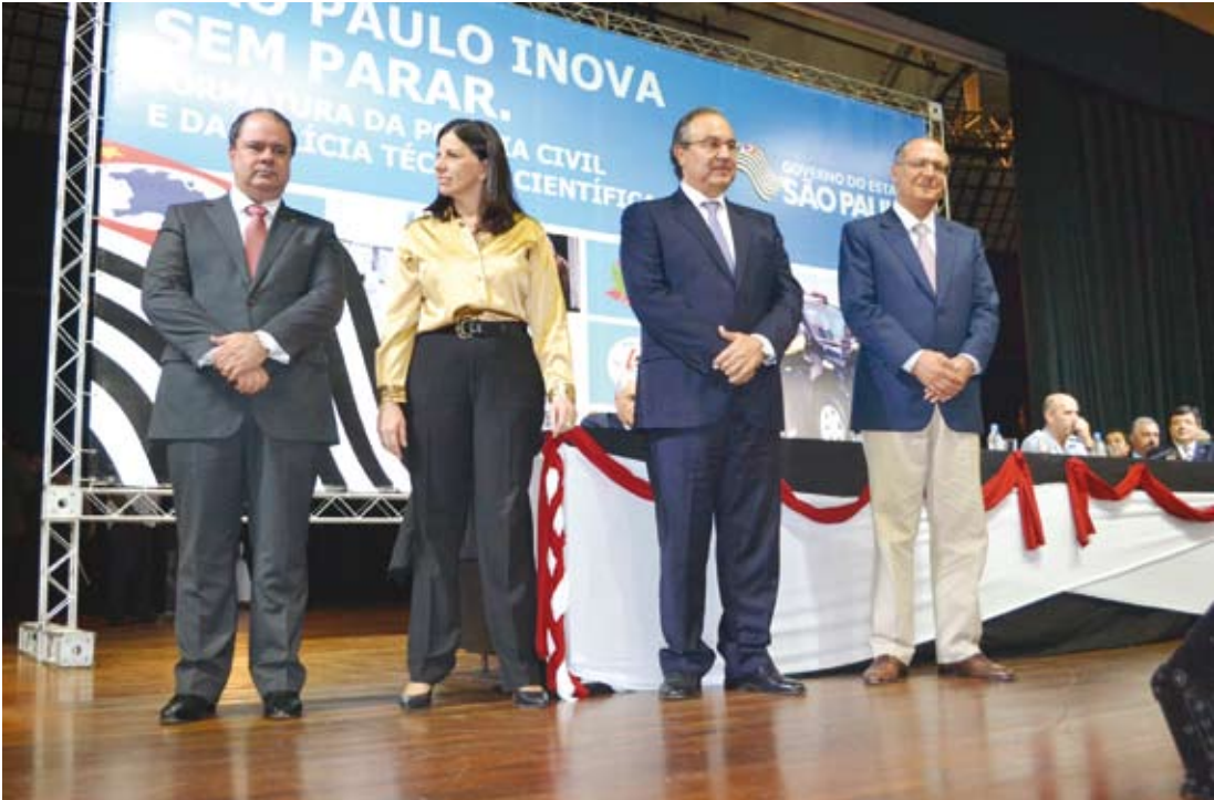
Autoridades durante a cerimônia da Secretaria da Segurança Pública do Estado de São Paulo

O Governo Geraldo Alckmin, por meio do programa “São Paulo Contra o Crime”, lançado em maio do ano passado, está fazendo contratações recorde para as Polícias Civil e Técnico-Científica, com 3.981 novas vagas. O investimento anual com todas as