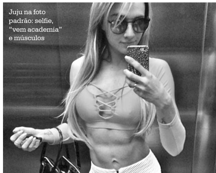
Juju na foto padrão: selfie, “vem academia” e músculos

atriz que se parece comigo. Óbvio que não sou eu porque não sou atriz de filmes eróticos. Nada contra elas, que fique claro! Mas quero esclarecer de novo pq essa mesma atriz já foi confundida comigo há três anos. Ela é bem famosa nesse meio de vídeos adultos, e existem muitos trabalhos dela na internet. Então, aos tarados de plantão, ela é o mais próximo da Juju que vocês verão em um filme desse tipo(risos). Bjs”, escreveu Juju.