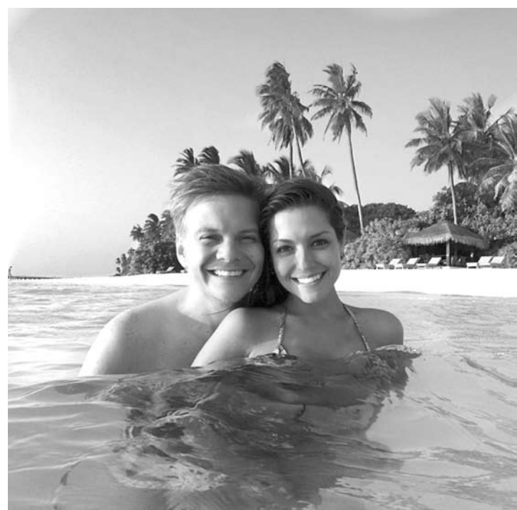
Casal apaixonado curtindo lua de mel

“Agora, realmente, estou plena, me encontrei. Meu sonho é ter um programa de auditório”, revelou, apontando Fausto Silva e Rodrigo Faro como fonte de inspiração. No entanto, ela acredita que possa partir para o ramo infantil. “Essa empatia veio com a novela ‘Da cor do pecado’. E estou realmente muito contente em trabalhar com este segmento. Adoro criança. Já escrevi livros para eles.”