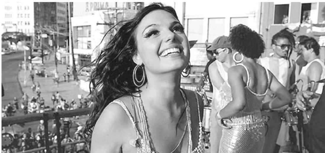
Isis finalmente fala sobre o triângulo amoroso

“Chegou uma hora em que o disse me disse ficou tão grande que foi melhor deixar baixar a bola antes de me colocar”, disse ela em entrevista, ao finalmente abrir a boca para falar sobre o suposto