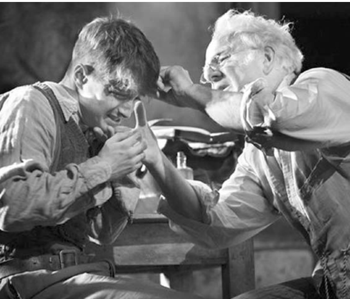
Radcliffe na peça “The Cripple of Inishmaan”