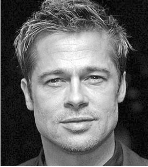
Ator teria sido atacado por Vitalii Sediuk, o terror dos tapetes vermelhos

cinema em menos de duas semanas. No dia 16 de maio, Sediuk foi manchete após invadir o tapete vermelho do Festival de Cannes e entrar embaixo da saia da atriz America Ferrera. No início do ano, o jornalista causou um grande constrangimento ao se abraçar e colocar a cabeça na virilha de Bradley Cooper durante a chegada ao Screen Actors Guild Awards. Ele também já tentou interromper um discurso de Adele no Grammy de 2013 e, um ano antes, levou um tapa na cara após dar um beijo em Will Smith.