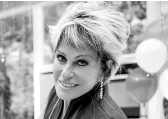
Apresentadora está empolgada com a “Copa do Mundo”

A apresentadora Ana Maria Braga se mostra muito animada e otimista com a “Copa do Mundo” no Brasil. A estrela Global, inclusive acredita que o Brasil tem grandes chances de vencer a competição: “Tenho certeza que o hena é nosso”.