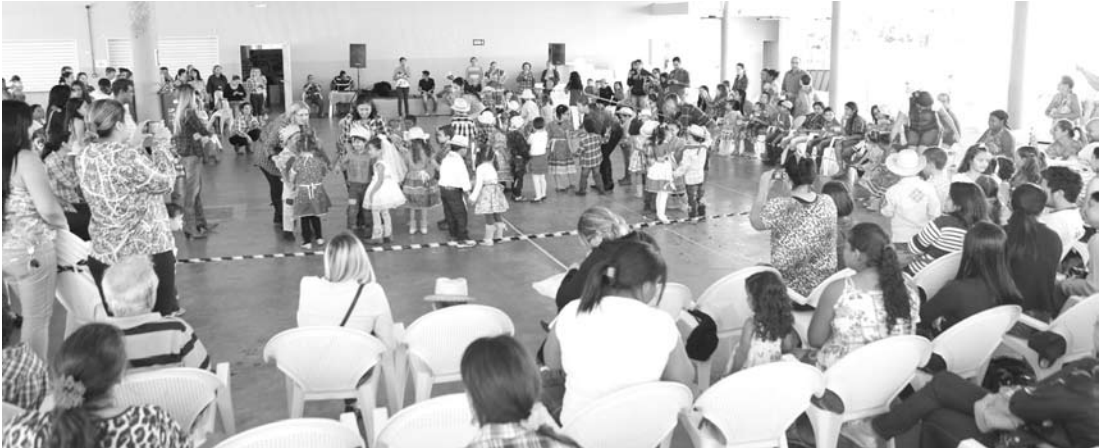
As apresentações das crianças dos dois períodos aconteceram no Salão Paroquial e foi um sucesso