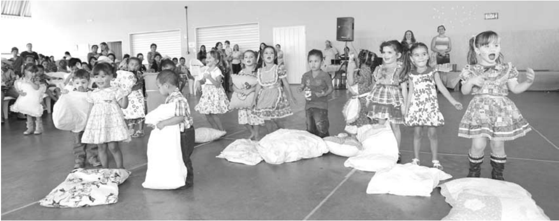
A “Festa Junina” manteve as tradições e garantiu a confraternização entre as crianças, com muita diversão e alegria