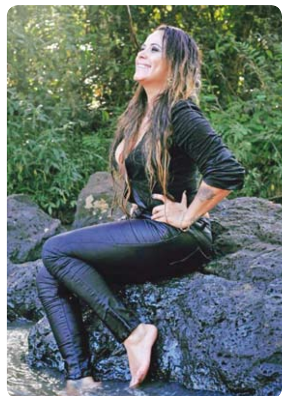
Testando novos estilos ao ar livre