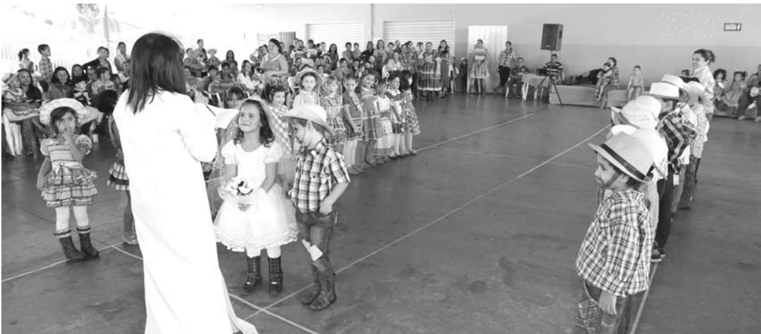
O arraial contou com a apresentação das crianças e com a participação dos pais