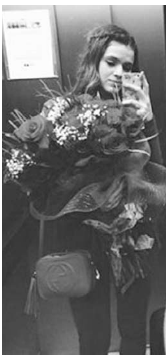
Seguidores da atriz no Instagram atribuíram presente a Neymar e deram força ao casal

Neymar e mandou um recado carinhoso: “Amor, hoje é um dia muito especial pra você, o dia que você começa a viver um dos seus maiores sonhos e eu estou muito feliz que vou poder te assistir! Como sempre vou estar torcendo muito por você! Que Deus te proteja acima de tudo, te abençoe e te guie a cada instante! Eu sei que vai ser muito melhor do que você sonhou! Entra em campo hoje e dá o seu show, eu vou estar toda orgulhosa vendo você fazer o que ama! Boa sorte”. Por causa do apoio da atriz, brincadeiras começaram a pipocar na web. Internautas fizeram um meme onde o rosto dela aparece