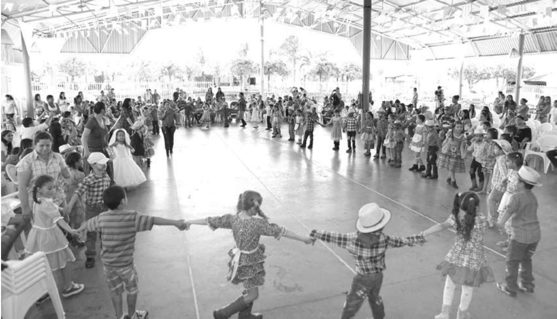
Além de danças típicas e a tradicional quadrilha, a festa foi regada de pratos típicos

→ Da REDAÇÃO contato@oextra.net ABAA – Associação de Bairro “Amigos de Arabá” promoverá um Almoço Dançante com a animação da Banda Sintonia. O evento acontecerá no Recinto de Festas “Antônio Candido de Paula”, em Arabá, amanhã, dia 15, a partir das 12h. Após o almoço, haverá um Leilão de Gado em prol à ABAA. O valor do ingresso é R$ 15,00. “Venha prestigiar com a sua família!”.