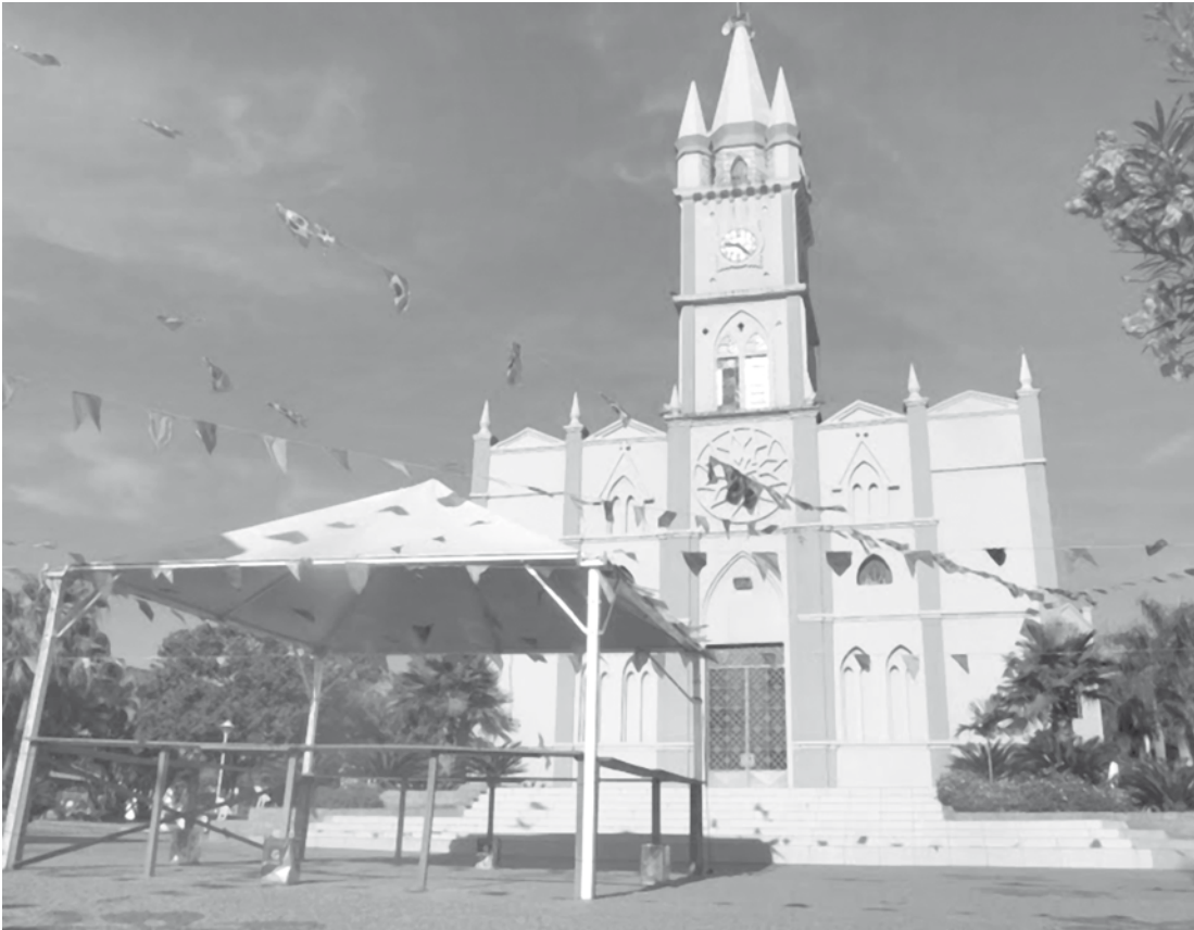
Praça da Matriz de Valentim Gentil recebe preparativos para a Festa Junina

Serão oficialmente entregues à população: uma máquina motoniveladora; um caminhão com caçamba basculante; um caminhão pipa; três ônibus escolares adaptados para cadeirantes; uma ambulância tipo Furgão; um automóvel para a Casa da Agricultura; e um