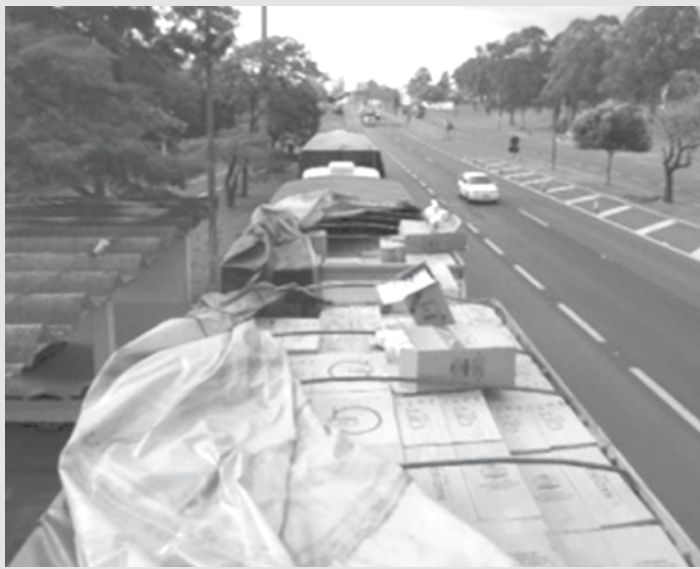
Carregamento apreendido pela Polícia Militar

→ Da REDAÇÃO contato@oextra.net Ao todo, 1.275.000 maços de cigarros contrabandeados foram apreendidos pela Polícia Militar na região de Presidente Prudente. O produto apreendido chegaria para distribuição até a região de Rio Preto. Os condutores ainda apresentaram notas falsas de uma carga de milho para tentar justificar a carga que transportavam, após os três caminhões serem abordados na SP 425, a Rodovia Assis Chateaubriand. A APREENSÃO A ação da Polícia Militar foi registrada na manhã de sábado, dia 14, quando três pessoas foram presas. O policiais da 2ª Companhia do 2º Batalhão de Policiamento Rodoviário (2º BPM/M) fiscalizavam veículos na Rodovia Raposo Tavares (SP 270) quando desconfiaram dos três caminhões. Os PMs passaram a seguir os veículos e os abordaram na altura do quilômetro 450 da SP 425, já próximo a Presidente Prudente. Na tentativa de