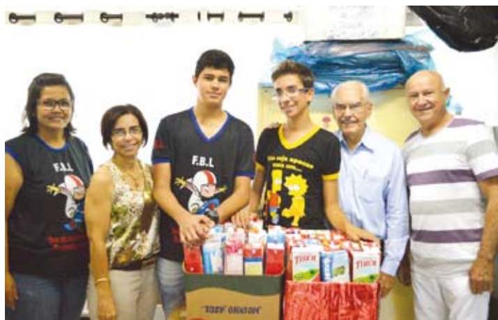
Alunos do Grêmio Estudantil '22 de Maio' doaram 86 litros de leite