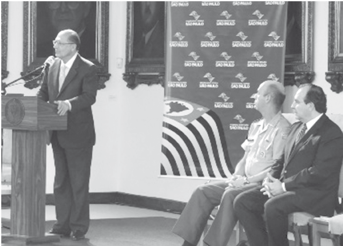
A solenidade de formatura foi realizada no Palácio dos Bandeirantes, quando Alckmin destacou a importância do trabalho do papiloscopista para o esclarecimento de crimes