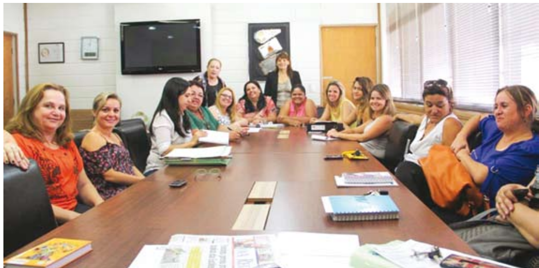
Uma das reuniões no Paço Municipal que definiu o modelo de gestão do Conselho Municipal da Mulher

e demais segmentos da sociedade civil organizada, e seus respectivos suplentes, etará como atribuições formular diretrizes e promover políticas em todos os níveis da administração pública, visando à eliminação das discriminações que atingem a mulher; manter canais permanentes de relação com o movimento de mulheres, propor ao Poder Público a criação de serviços de atendimento específico para mulheres em situação de risco de violência,