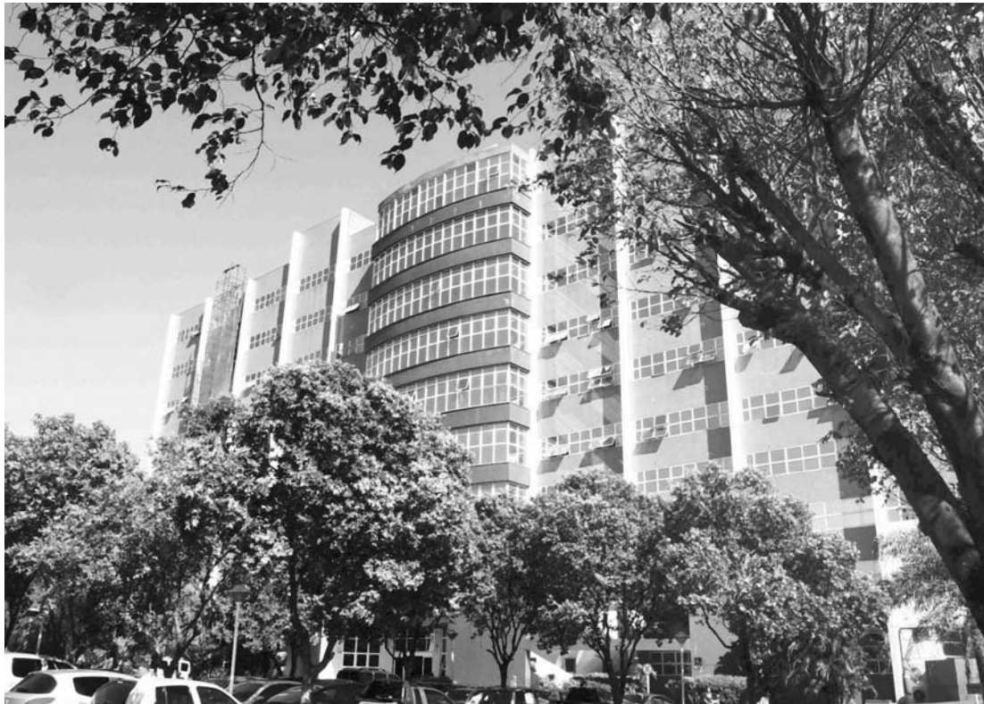
No total, o Governo do Estado investiu mais de R$ 10,7 milhões nas obras de adequação

No total, o Governo do Estado investiu mais de R$ 10,7 milhões nas obras de adequação, sendo mais de