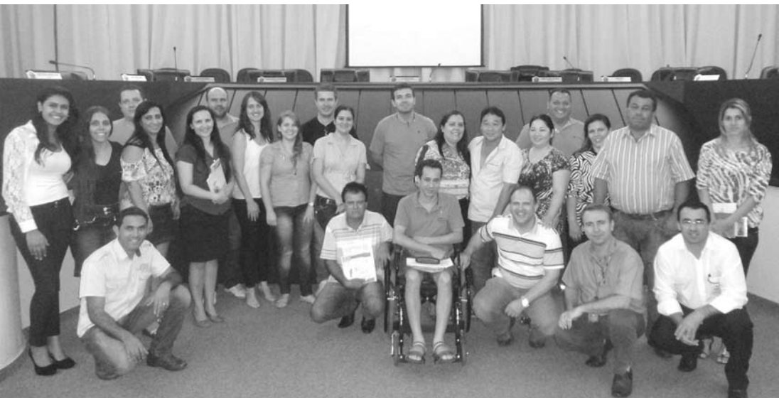
Comerciantes de Ouroeste que participaram da palestra realizada na Câmara Municipal, em evento da ACIO em parceria com o SEBRAE