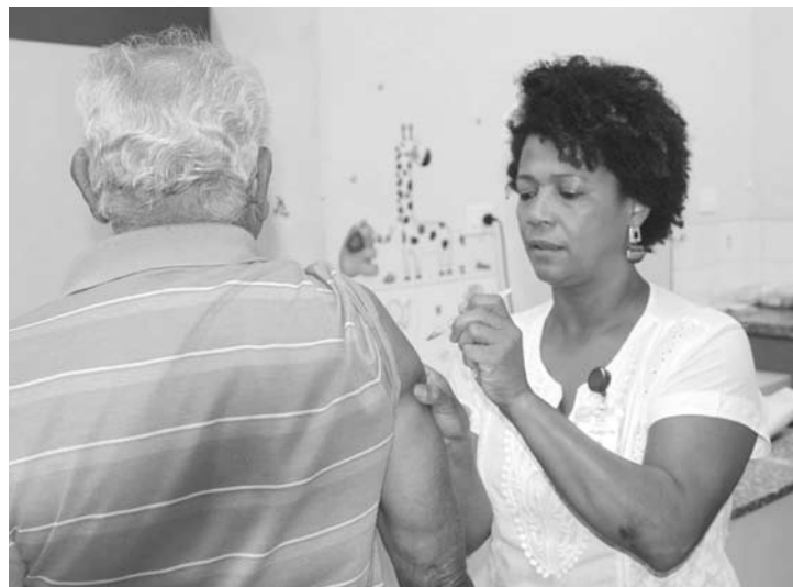
Nova prorrogação: Vacinação vai até dia 30

A vacina protege contra três subtipos do vírus da gripe (A/H1N1; A/H3N2 e influenza B) e suas complicações. A dose é segura e reduz as complicações que podem produzir casos graves da doença, interna-