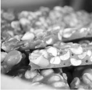
Pés-de-moleque pesaram menos do que apontavam na embalagem encontrada nos mercados da região

Os problemas foram identificados em amostras de pé-de-moleque (sendo no maior deles a falta de 140g em pacotes de 1,1kg), paçoca caseira (com a falta de 10,50g em embalagens que deveriam conter 120g), cocada branca (em que faltavam 159g em embalagem de 1,1kg), pé-de-