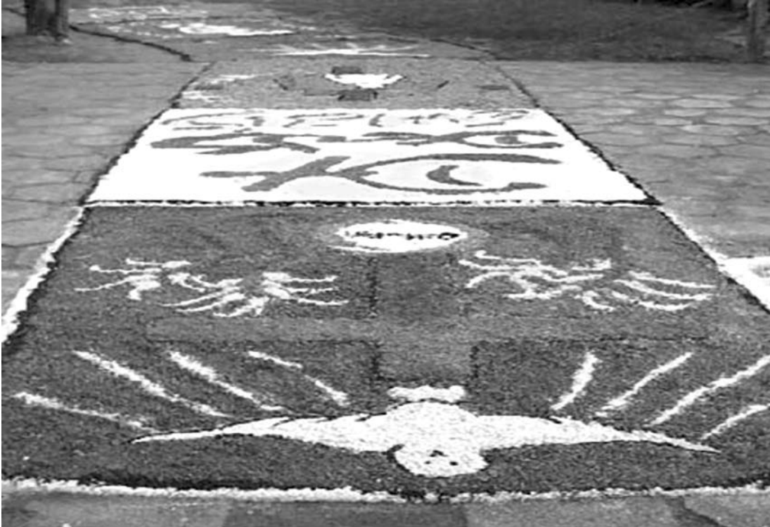
Tapetes serão feitos ainda nesta manhã

Corpus Christi é uma festa ao Corpo de Cristo. É uma data adotada na Igreja Católica, feriado nacional, para comemorar a presença real de Jesus Cristo no sacramento da Eucaristia, pela mudança da substância do pão e do vinho na de seu corpo e de seu sangue (O Cato-