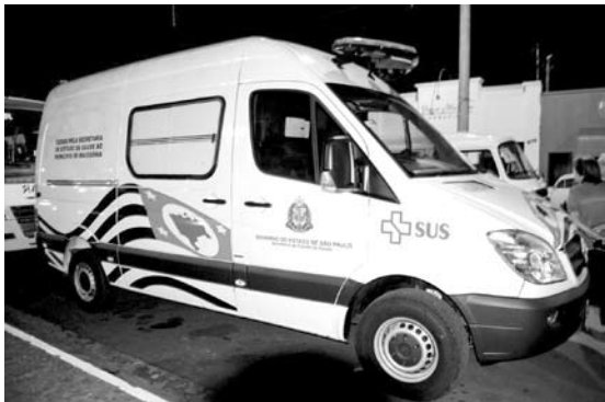
Foram entregues 12 novos veículos ao município, sendo 1 motoniveladora, 3 ambulâncias, 5 micro-ônibus, 1 kombi, 1 caminhão basculante e 1 caminhão poli-guindaste