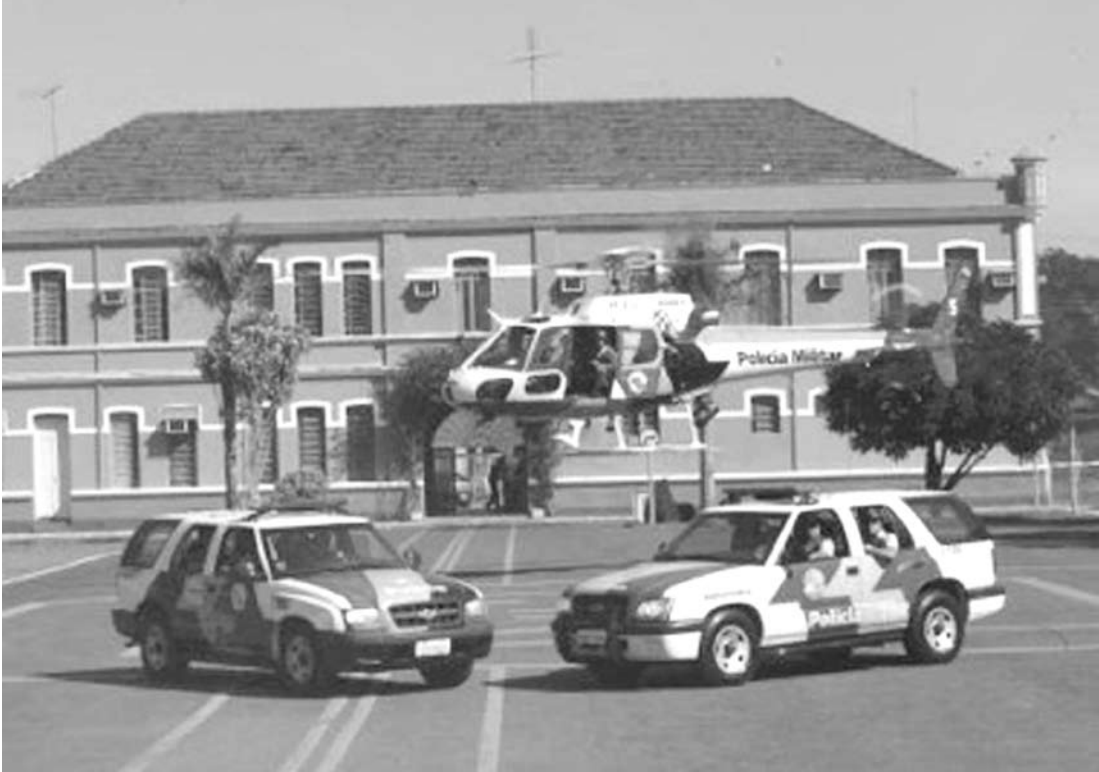
A Operação Corpus Christi começa às 14 horas de quarta-feira e vai até a meia-noite de domingo

A PM alerta que o motorista que for flagrado dirigindo embriagado será multado em R$ 1.915,40 e poderá ter o veículo apreendido e a Carteira Nacional de Habilitação (CNH) retida por 12 meses. O condutor terá ain-