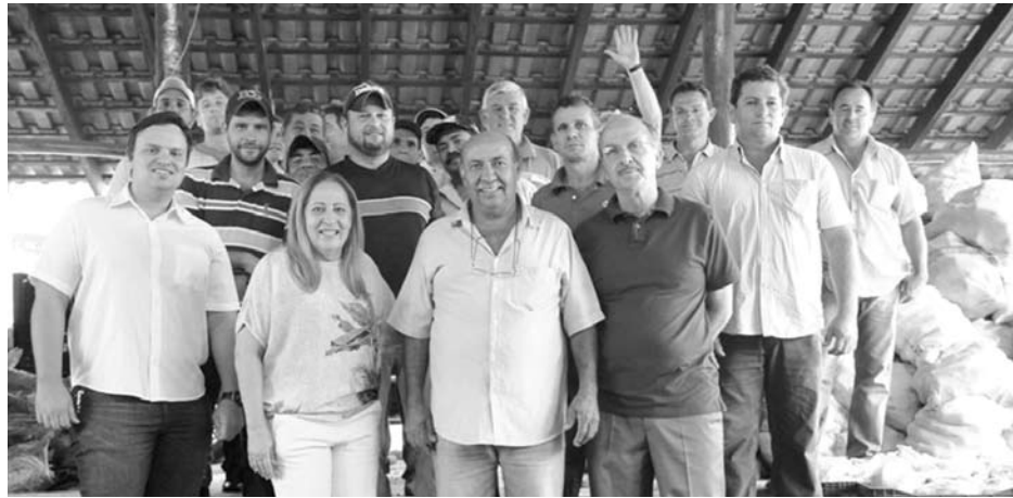
Abastecendo entidades e escolas do município: com estabilidade garantida pela parceria com a Prefeitura, produtores têm venda consolidada durante todo o ano