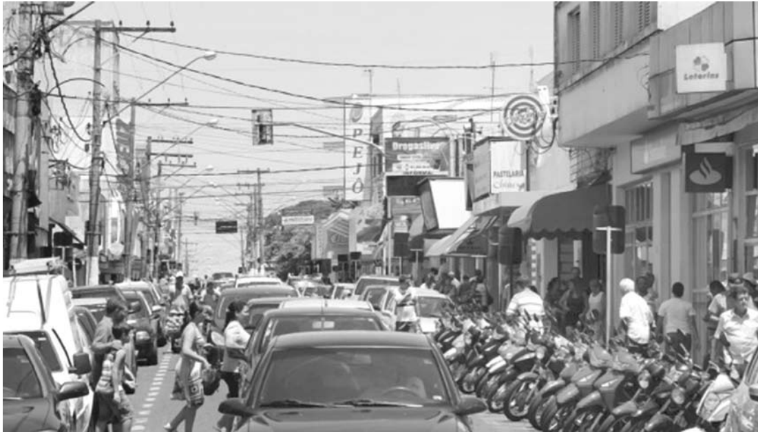
Em 2013, o recurso do IPVA somou aproximadamente R$ 9,9 milhões

Ainda de acordo com a Fazenda, o contribuinte