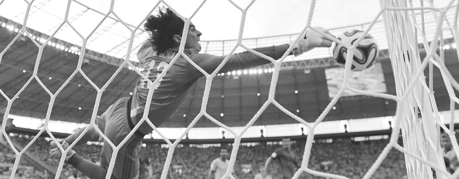
Ochoa, a “Muralha do México”: Seleção Brasileira não ‘furou’ a meta mexicana e 0 x 0 deixa claro que time precisa de mudanças