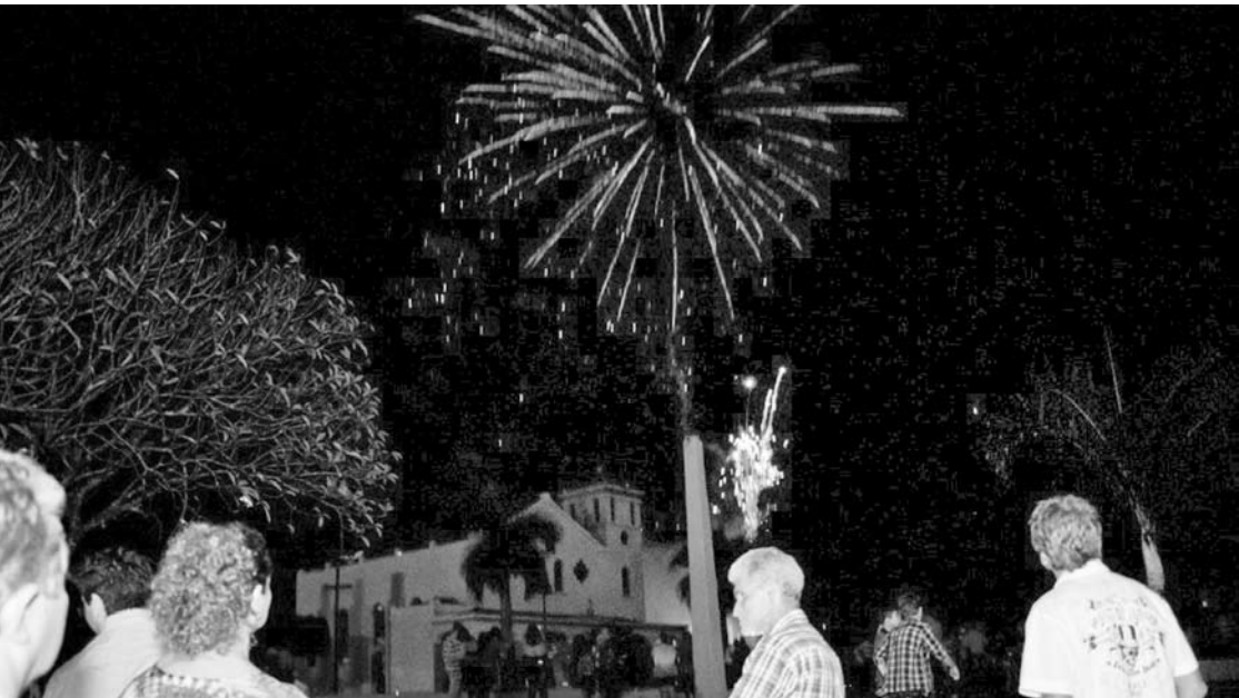
Queima de Fogos