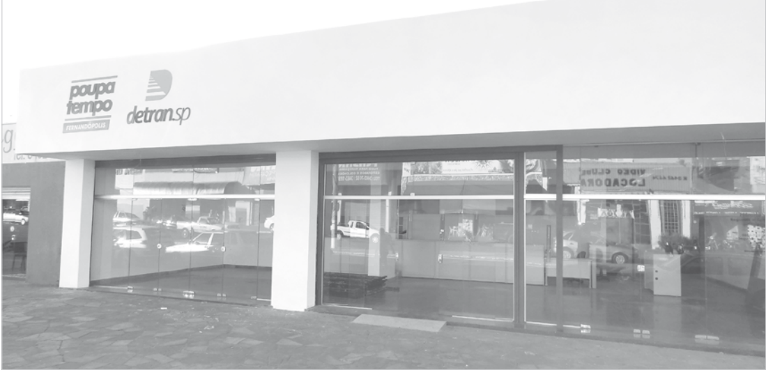
Prédio onde estão sendo instalados o Poupatempo e o novo Detran em Fernandópolis

O novo Detran, (Departamento Estadual de Trânsito) que também começa o atendimento na próxima segunda, anexo ao Poupatempo, está ligado a secretaria de Planejamento e Desenvolvimento Regional do Departamento Estadual de Trânsito de São Paulo, é