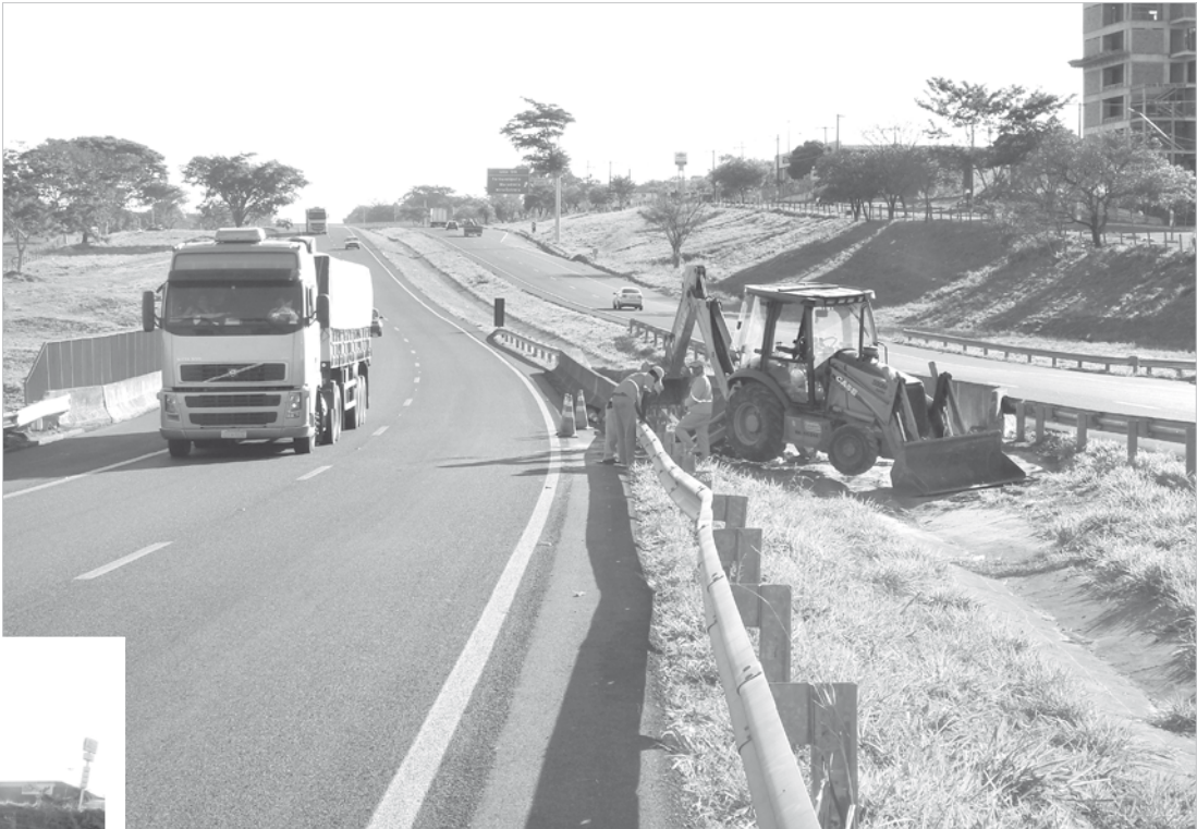
Funcionários da empresa CONSDON trabalham nas obras do DER em Fernandópolis