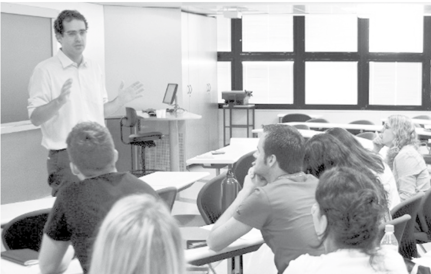
Alunos de faculdades particulares já têm direito às bolsas da Capes, hoje de R$ 1,5 mil no mestrado

O governo federal vai anunciar no segundo semestre a abertura de crédito educativo para 25 mil alunos de mestrado e doutorado em faculdades particulares. O Fundo de Financiamento Estudantil (Fies) da pós, projeto que ganhou força nos debates internos do Ministério da Educação (MEC) nos dois últimos anos, é uma das apostas para ampliar o acesso, como ocorreu na graduação. “O lançamento ocorrerá em breve, nos próximos meses. Será um sucesso, pois atenderá à grande demanda das instituições não públicas, além de reduzir a inadimplência”, aposta Jorge Guimarães, presidente da Coordenação de Aperfeiçoamento de Pessoal do Nível Superior (Capes), órgão ligado ao MEC. Alunos de faculdades particulares já têm direito às bolsas da Capes, hoje de R$ 1,5 mil no mestrado e R$ 2,2 mil no doutorado. Reivindicação antiga, o programa terá regras iguais às da graduação, com financiamento parcial e integral e início do pagamento do empréstimo um ano e meio após a formatura. O crédito valerá para cursos avaliados pela Capes, como mestrados