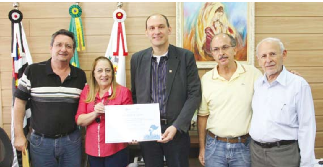
Projeto Sebrae Prefeito Empreendedor é um reconhecimento dos melhores projetos municipais que fomentam o empreendedorismo