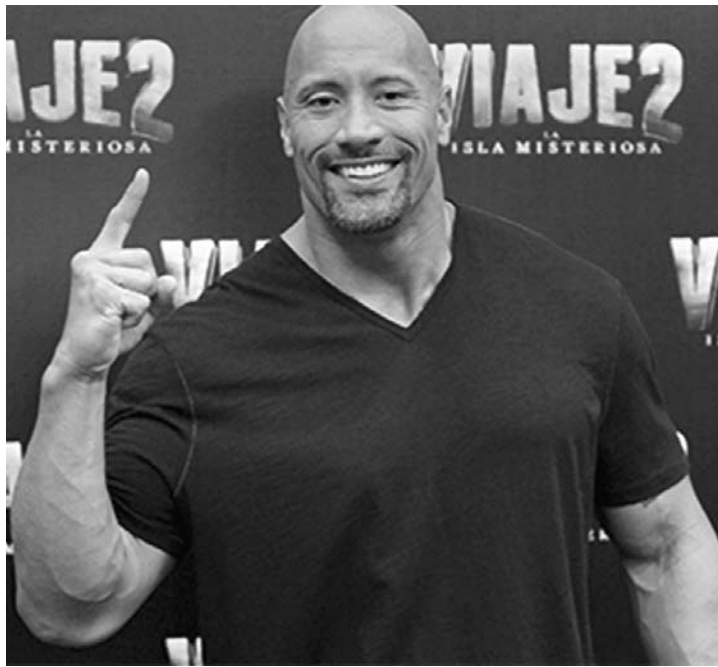
A carreira de ator ajudou Dwayne a lutar contra a depressão

Astro da saga "Velozes e Furiosos", Dwayne Johnson nem sempre foi esse cara sorridente e cheio de amor pra dar. Em uma entrevista ao The Hollywood Reporter, ele revelou um drama do passado que o atormentou na juventude: a depressão.