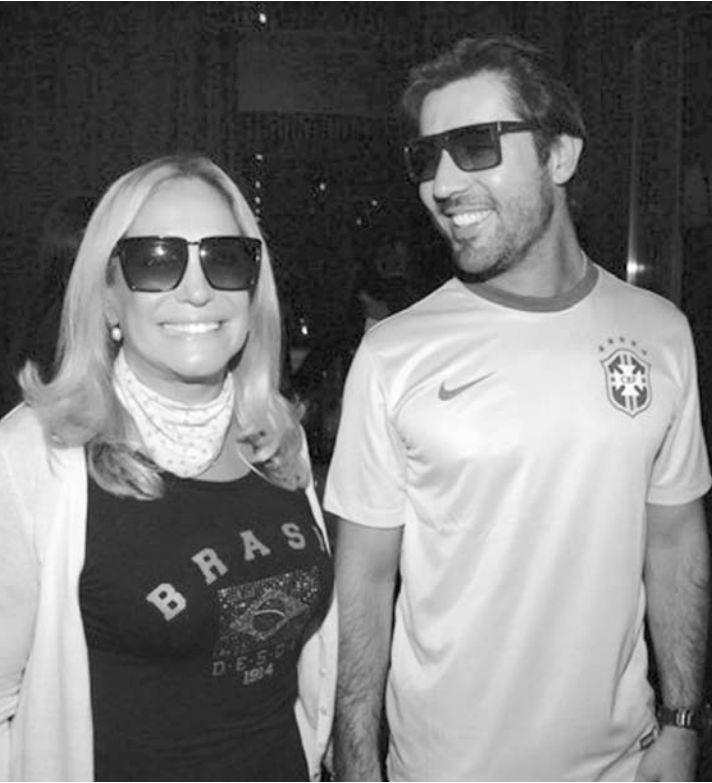
Os dois apareceram sorridentes e de mãozinhas dadas