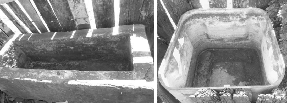
Animal que vinha sendo vítima de maus tratos em propriedade rural de Populina