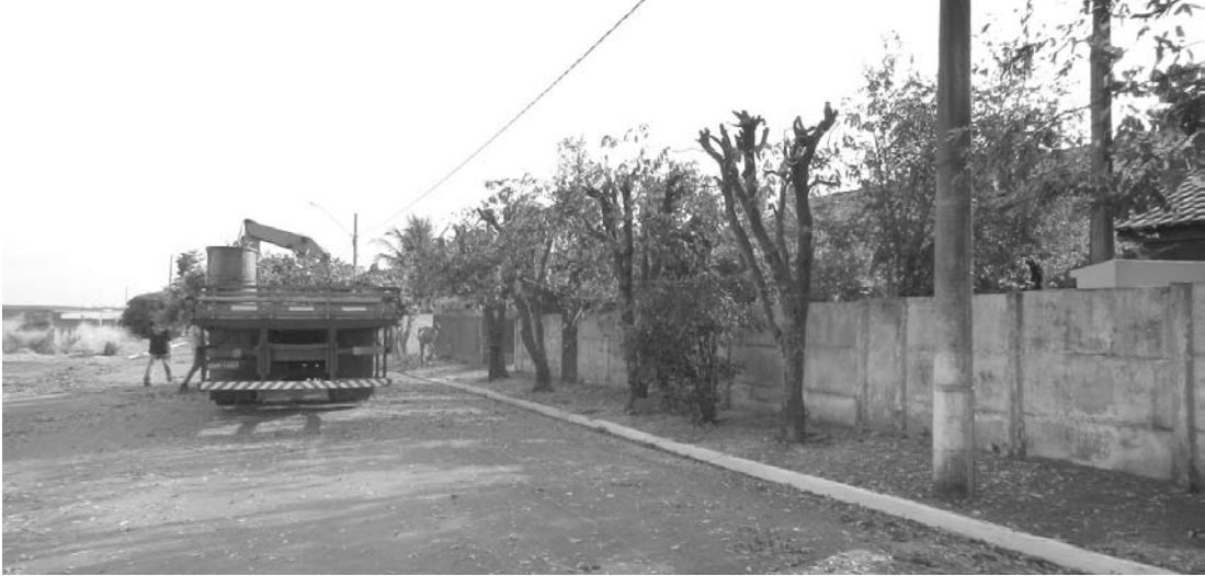
Além de revitalizar, respeitando a arborização, a poda evita acidentes e danos à fiação elétrica, e principalmente à segurança da população

→ Da REDAÇÃO contato@oextra.net A Prefeitura de Ouroeste iniciou uma nova etapa dos serviços de poda de árvores em vias públicas da cidade.