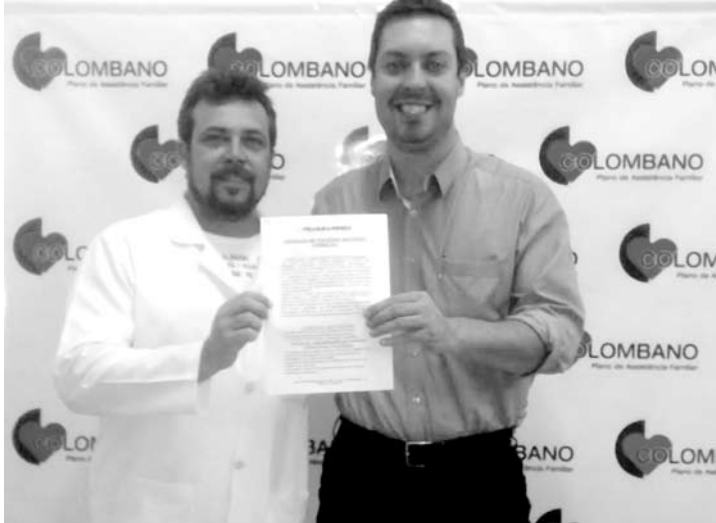
Empresários firmando a parceria