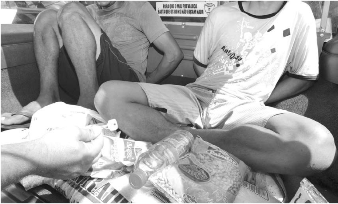
Fernandópolis registrou 284 boletins de ocorrência de furtos entre janeiro e maio

Dez casos de estupro foram registrados até maio, um a mais que o mesmo período do ano passado. O tráfico já soma 40 casos. Já o porte de drogas somou 50 episódios. Na mesma época, no ano passado, eram 67 ocorrências por tráfico de entorpecentes, até o fechamento do ano foram 148.