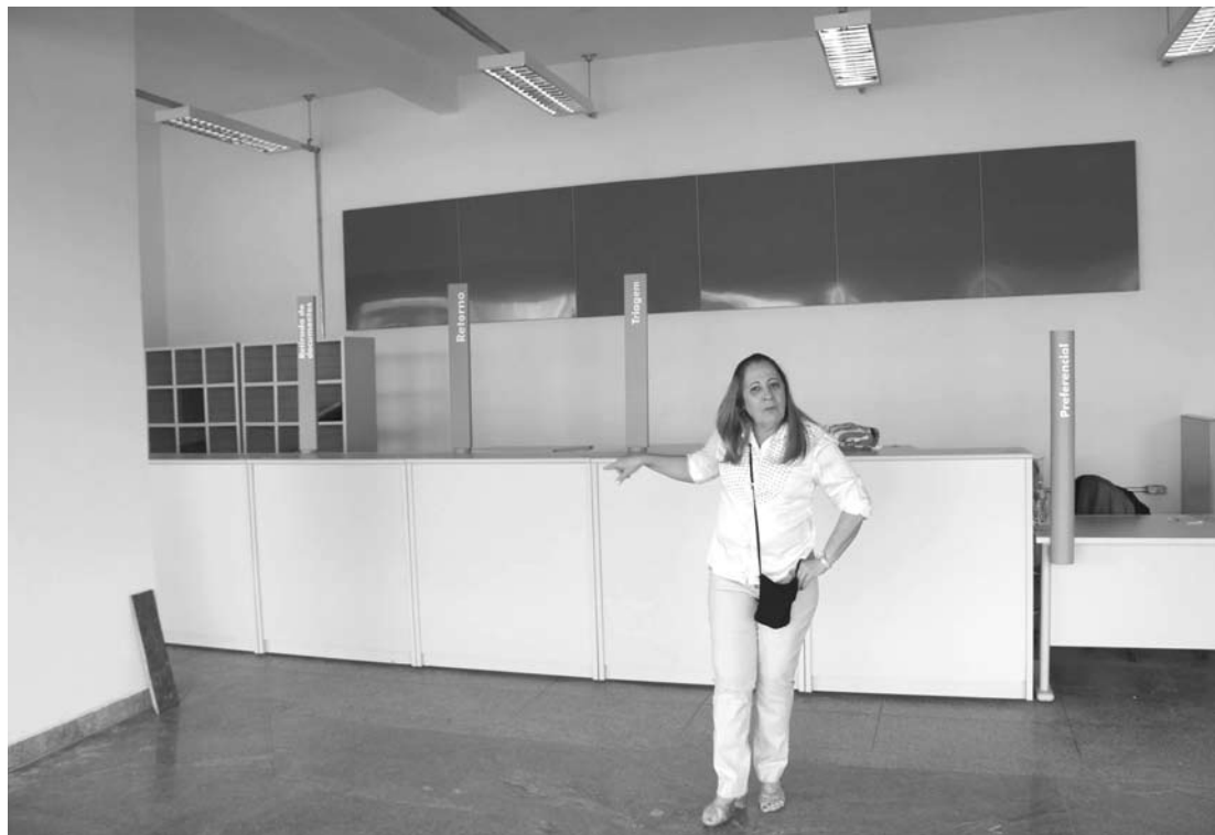
Prefeita ressaltou a importância dessas conquistas para a população

A unidade do Poupatempo, a Superintendência Regional do DETRAN e os departamentos municipais de atendimento ao público funcionarão das 8h às 17h de segunda a sexta, e aos sábados, das 8h às 12h. O prédio está localizado na Avenida Líbero de Almeida Silveiras, 2.705 – Coester (Antigo Prédio do Ribeiro Center).