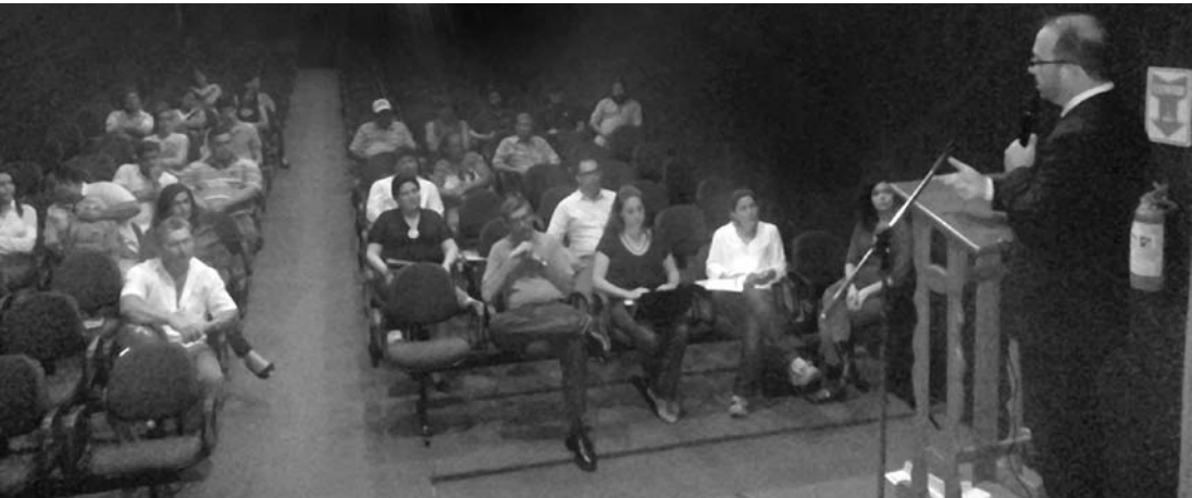
Juiz ministrando palestra aos comerciantes participantes do encontro