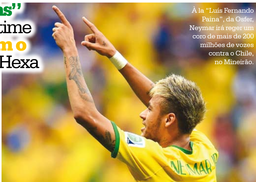
À la “Luís Fernando Paima”, da Osfer, Neymar irá reger um coro de mais de 200 milhões de vozes contra o Chile, no Mineirão.

“Boas” coincidências, pelo menos para o Brasil, batem à porta das oitavas de final da Copa do Mundo deste ano, que se inicia logo mais à tarde com o confronto Brasil x Chile. E muitas delas, aliadas ao retrospecto positivo da Seleção Brasileira diante do Chile, “entrarão em campo” hoje em Minas. Confira a história da “segunda chance” de um torcedor de 85 anos que perdeu a final de 50, mas estará no Maracanã este ano. Página A11