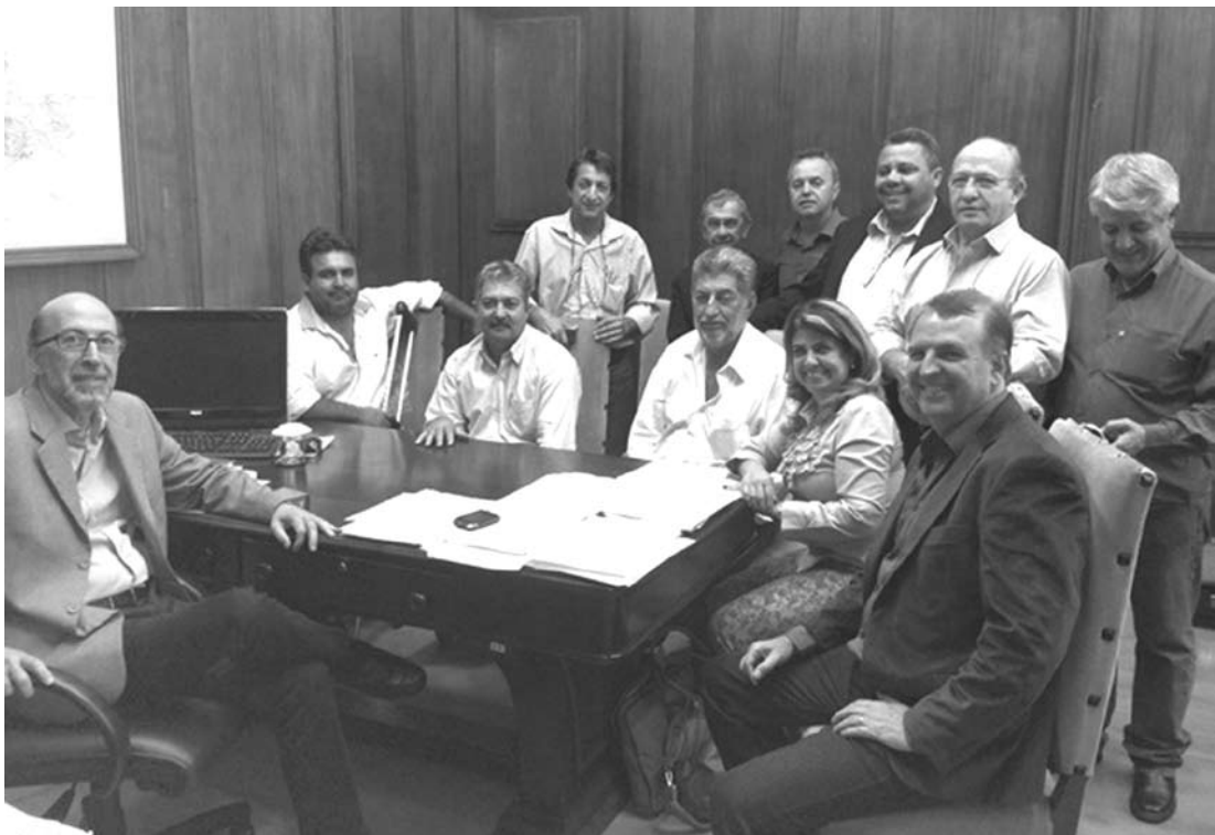
Prefeitos aproveitaram para protocolar pedidos e discutiram a transferência do 2º Pelotão da Polícia Militar Ambiental

"Entregamos um ofício ao governador Geraldo Alckmin no dia 2 de junho, em Votuporanga, quan-