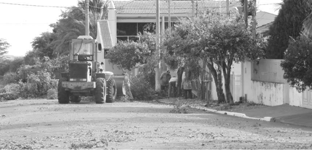
Os serviços de poda de árvores garantem a revitalização da cidade e vêm sendo realizados em diversas vias públicas