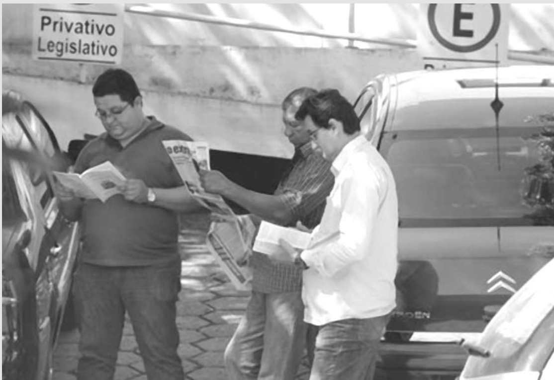
imagem do dia

“Flagra no Privativo” Uma imagem chamou a atenção de toda a Redação de “O Extra” ontem pela manhã. No estacionamento “Privativo do Legislativo”, no Paço Municipal, três vereadores acompanhavam atentos nossa edição desta sexta-feira. A reunião serviu para que conferissem a edição do Jornal e também exemplares da Lei Orgânica Municipal. Para registro: o trio de vereadores tem, sem dúvida, um excelente hábito de leitura.