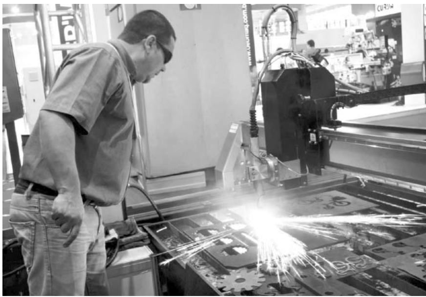
Entre outros produtos vendidos para o mundo estão móveis de metal e de madeira

→ TATIANA BRANDINI tatiana@oextra.net Fernandópolis está com as exportações em alta, com balança comercial de 8,34% no acumulado desde janeiro. Até o mês de maio, Fernandópolis foi responsável por US$ 2,8 milhões em exportações. O total representa 663,3 quilos de produtos exportados de Fernandópolis para o mundo. Do total, 17,5% vai direto para os países da Ásia. A maior parte representa couros e peles de bovinos que fez US$1,9 milhão em negócios nos cinco primeiros meses do ano. Entre outros produtos exportados da cidade estão móveis de metal, móveis de madeira para quartos de dormir, assentos para veículos automóveis e ainda silenciosos e tubos de escape para tratores e veículos automotivos. Os produtos de Fernandópolis estão indo direto para a Coreia do Sul, Angola, Espanha, China, Namíbia, Uruguai, Itália, África do Sul, Portugal, Hong Kong, Paraguai, Estados Unidos, Canadá e Irlanda. Embora os países da Ásia representem a maior parte das exportações da cidade, houve crescimento de 52% das exportações para os países da União Europeia em relação ao mesmo período do ano passado.