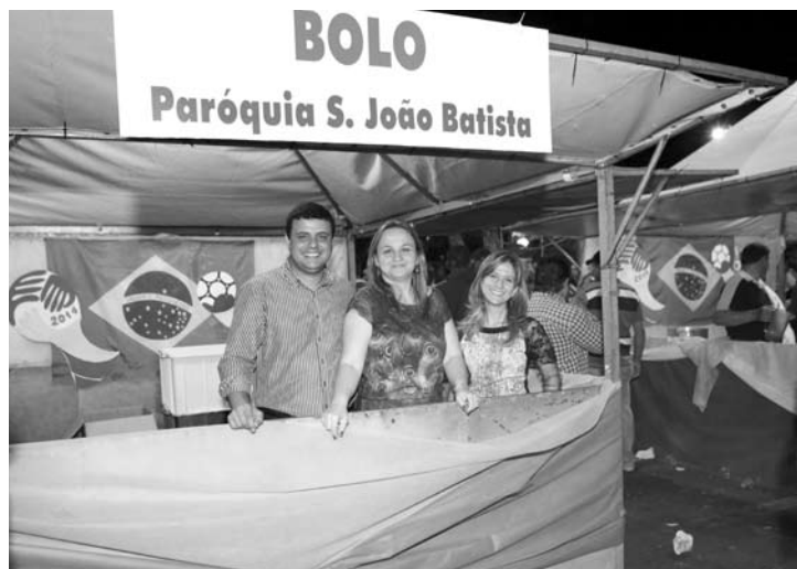
Membros da Paróquia São João Batista, também parceira da festa