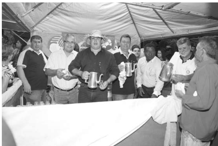
Membros do Rotary Clube de Ouroeste, que mais um ano trabalharam para o sucesso da festa