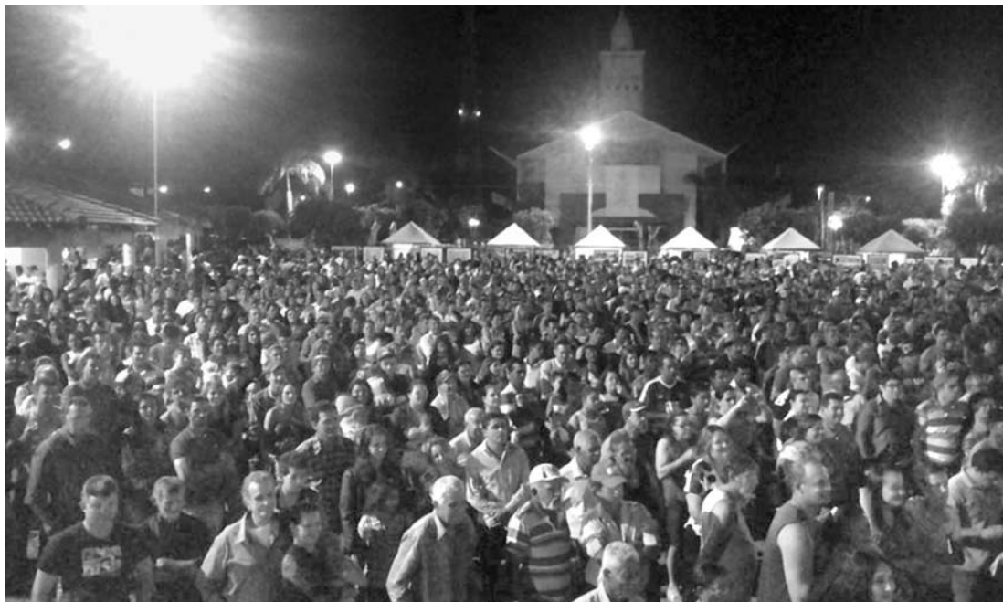
Centenas de pessoas participaram da programação do 6º Arraial de Ouro, na Praça de Eventos

O Arraial se consolidou como uma das melhores Festas Juninas da região pela organização, público e atrações