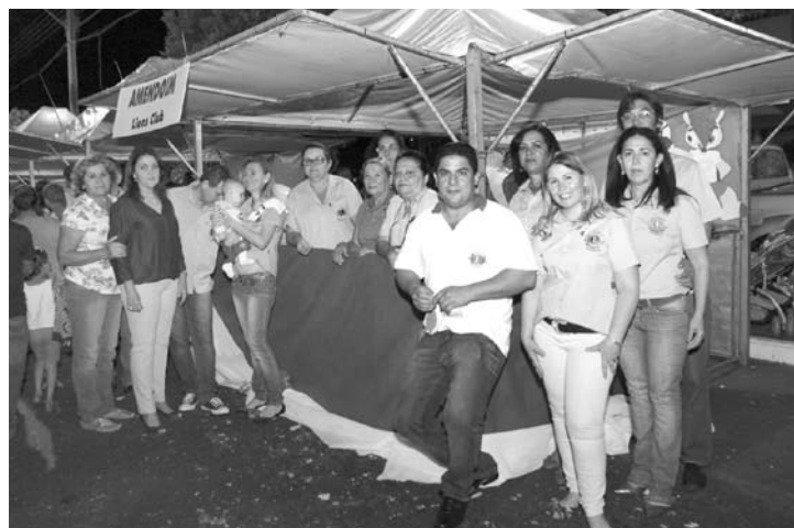
Membros do Lions Clube de Ouroeste, que todos os anos prestam serviços no Arraial