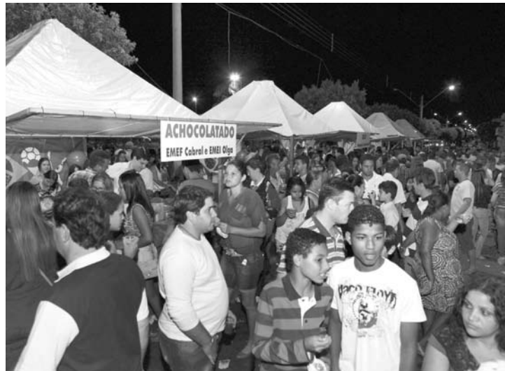
O Arraial distribuiu gratuitamente pipoca, amendoim, quentão, biscoito, bolo, leite achocolatado