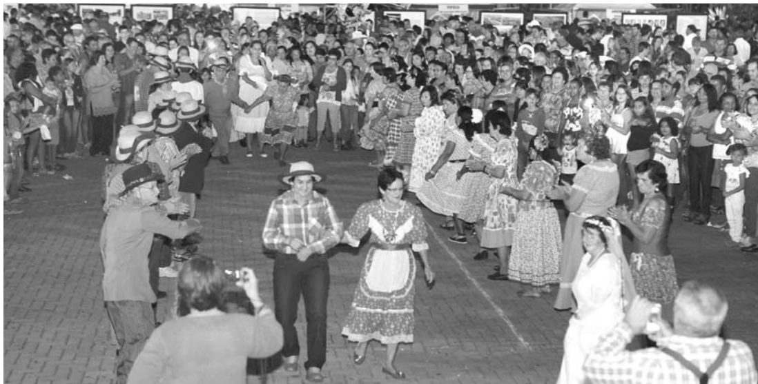
O grupo da Terceira Idade arrancou aplausos pela belíssima apresentação