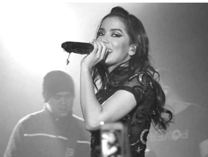
Anitta canta em show (inflacionado)

O produtor de eventos que quiser ter o show de Anitta, um dos maiores nomes da música brasileira nos últimos tempos, poderá desembolsar a bagatela de R$ 140 mil. Isso, claro, apenas de cachê, já que as despesas extras, que chegam a R$ 30 mil, também ficam por conta do contratante. A mesma coluna Retratos da Vida, do Extra, que trouxe a informação, ainda diz que a maior parte desses R$ 30 mil são gastos em exigências como gar-