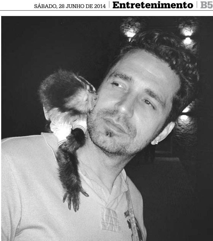
Latino e seu animalzinho de estimação