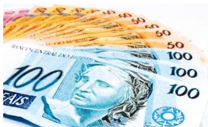
Servidores públicos municipais terão final de semana de 'bolso cheio'