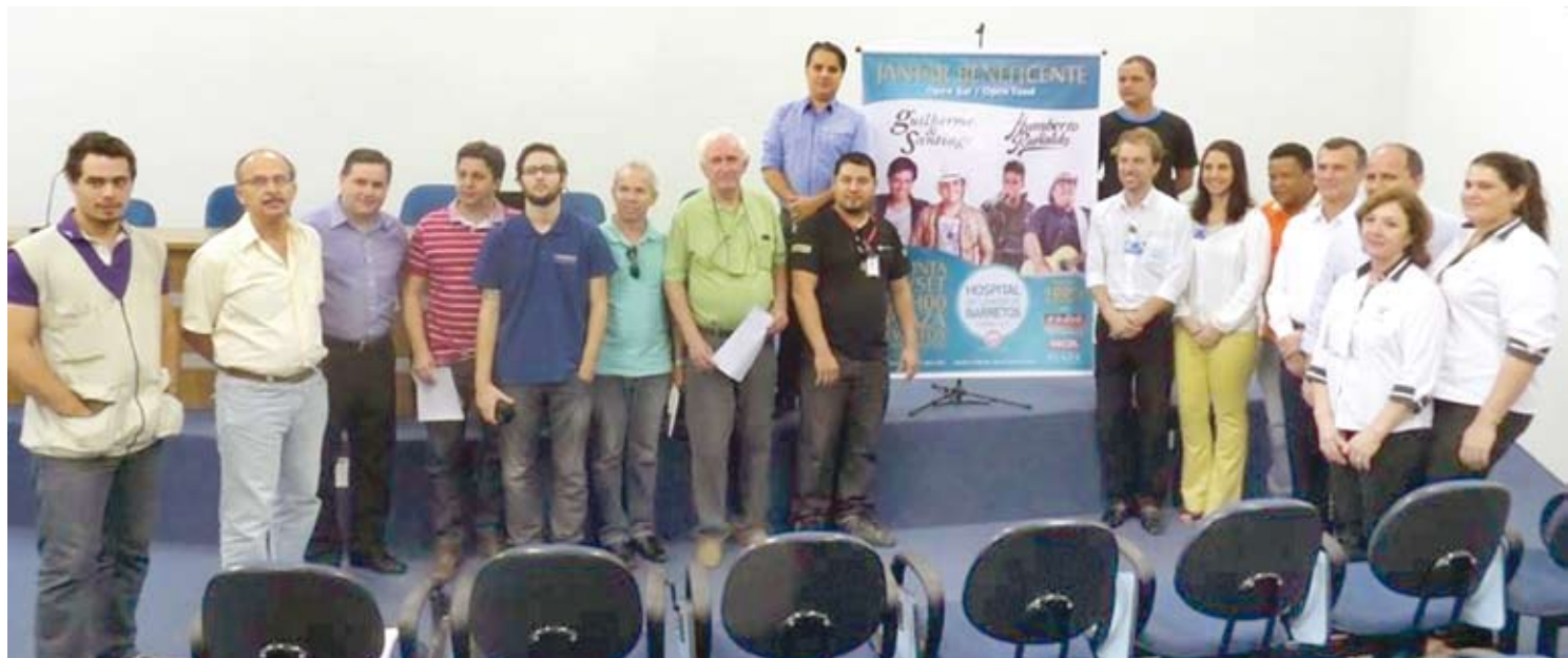
Participantes da coletiva de divulgação do Jantar Beneficente

Atualmente a unidade de prevenção de Fernan-