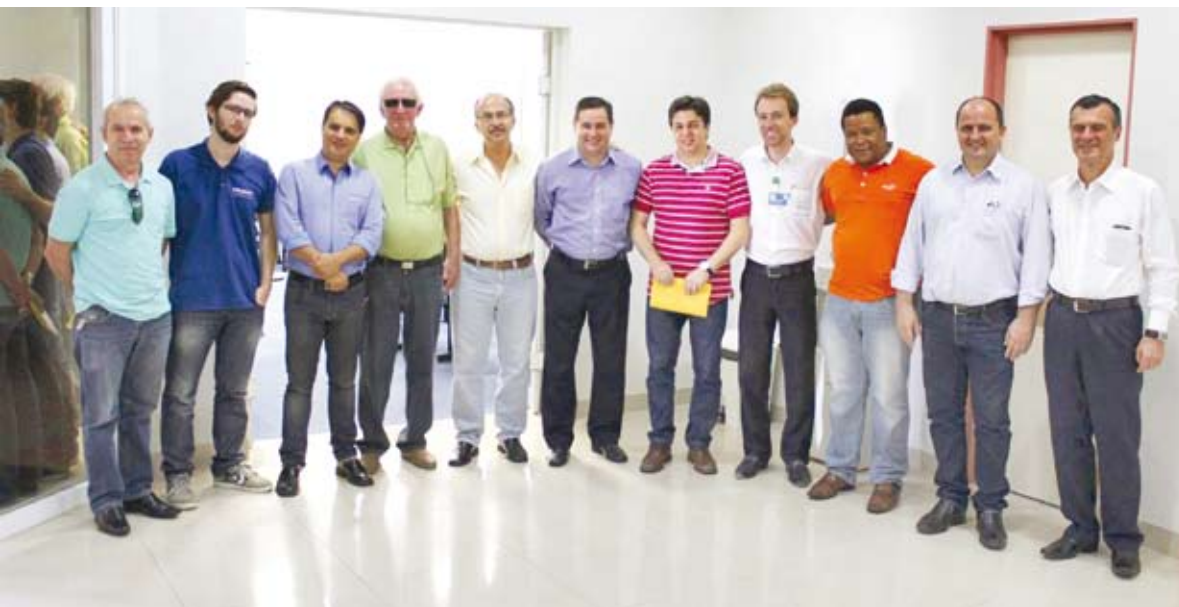
Autoridades e empresários apoiarão o evento solidário em prol ao Hospital de Câncer

média de 3.700 exames de mamografia realizados pelas Unidades Móveis, sendo quatro mamógrafos, atendendo toda a região de São José do Rio Preto e Araçatuba.