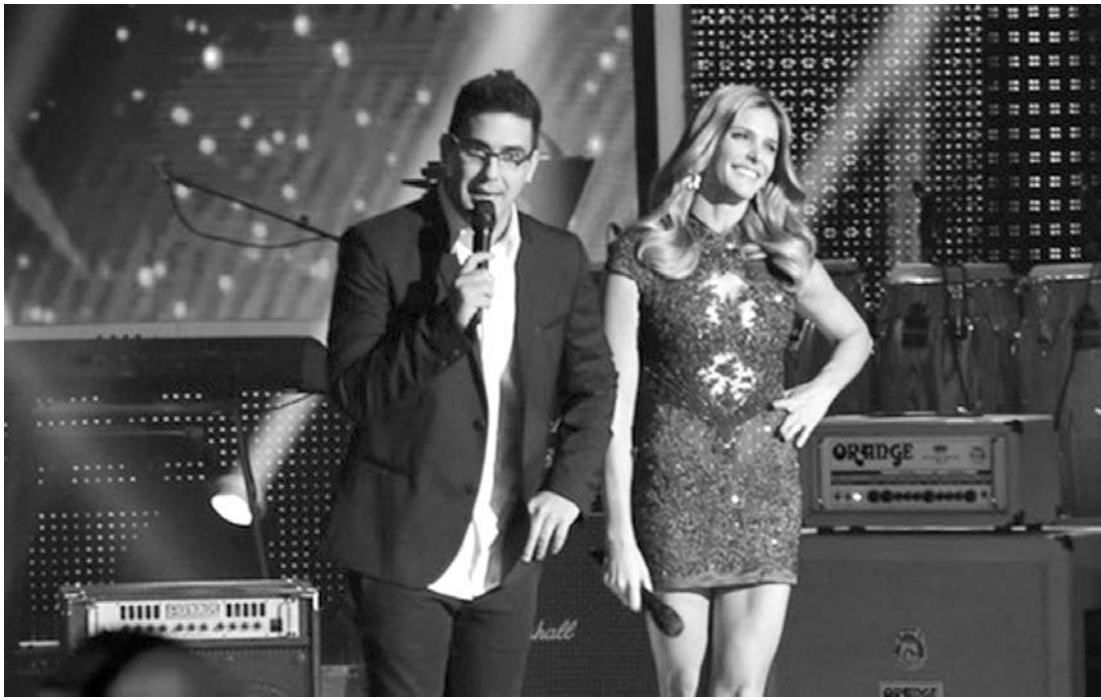
Andre Marques e Fernanda Lima

E adivinha quem bombou na plateia? Sim, gente conhecida que não tinha nada a ver com a história. Pelo menos deu pra se divertir durante o programa tentando reconhecer todo mundo que estava nas cadeirinhas, toda vez que Fernanda Paes Leme aparecia por lá.