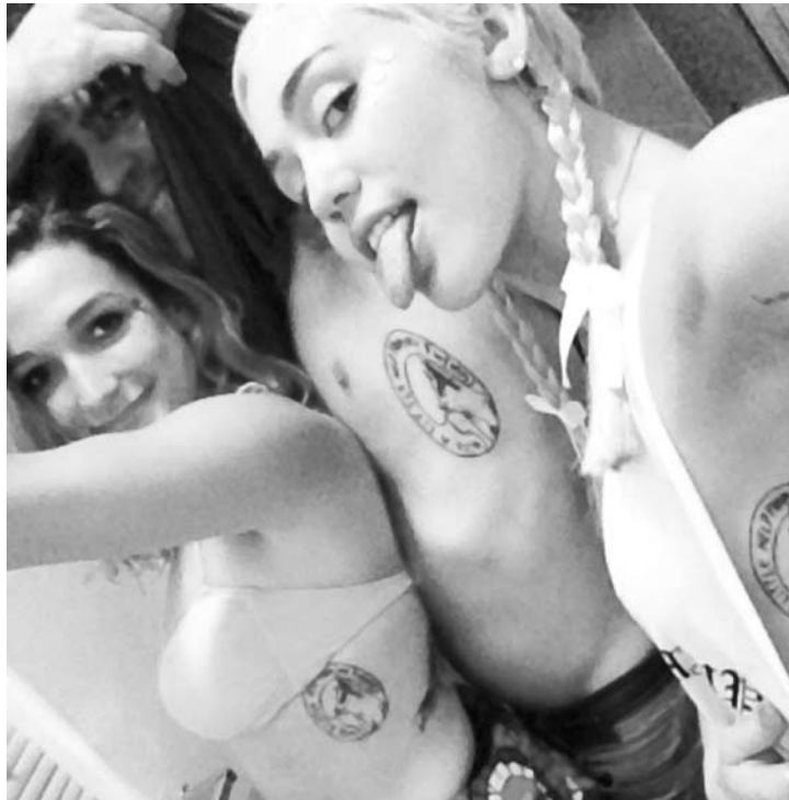
Amigos fazem tatuagem igual à de Miley Cyrus