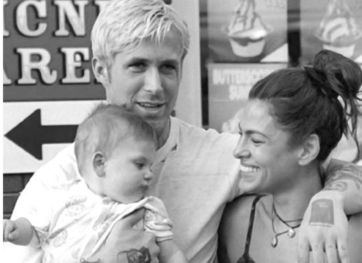
Eva Mendes e Ryan Gosling comemoram a chegada do primeiro filhinho. Na foto eles aparecem em gravação de filme

des e Ryan Gosling acertaram na loteria e estão esperando o primeiro filhinho. Pelo menos é isso que garante as revistas de fofocas.