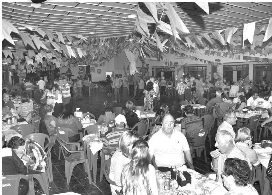
Salão de festas da Casa de Portugal tomado pelo grande público que prestigiou o ‘Arraiá da AVCC’

re’, formada por voluntários qualificados especificamente a este tipo de atendimento, leva uma palavra de carinho e de apoio, além do tratamento de saúde que ameniza a dor física dos enfermos. Eles