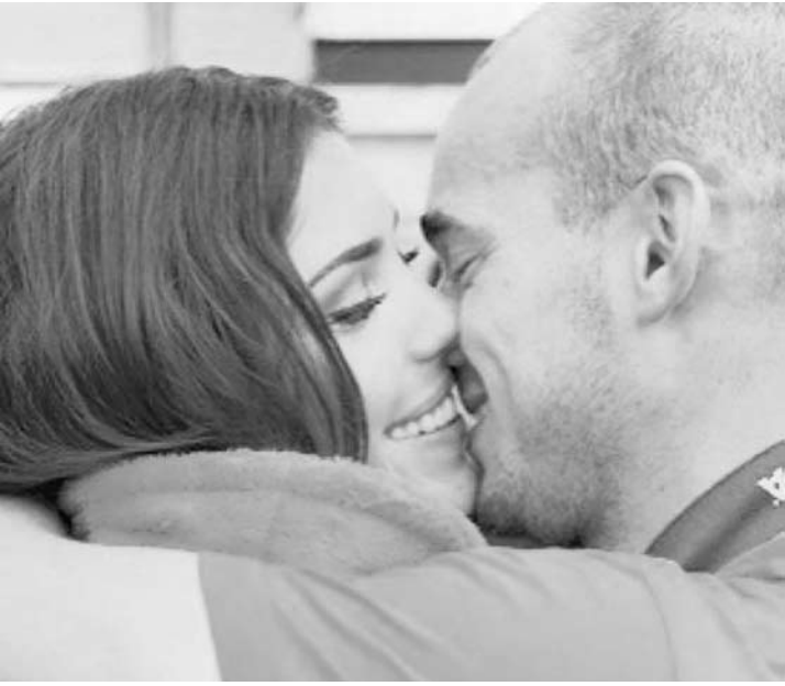
Yolanthe Cabau e Sneijder

Grazi tá apaixonada, e é fácil entender o porquê. O bofe é um poço de fofura.