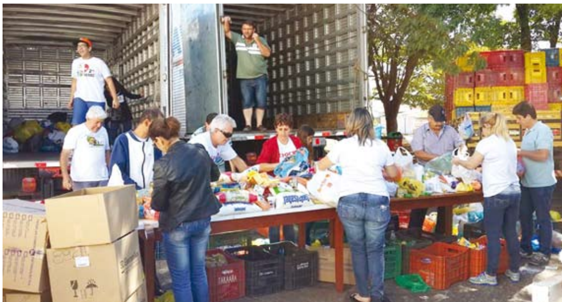
Dia foi de muita dedicação e trabalho para os voluntários

Como nos anos anteriores, o grupo se reuniu no Centro Pastoral para a con-