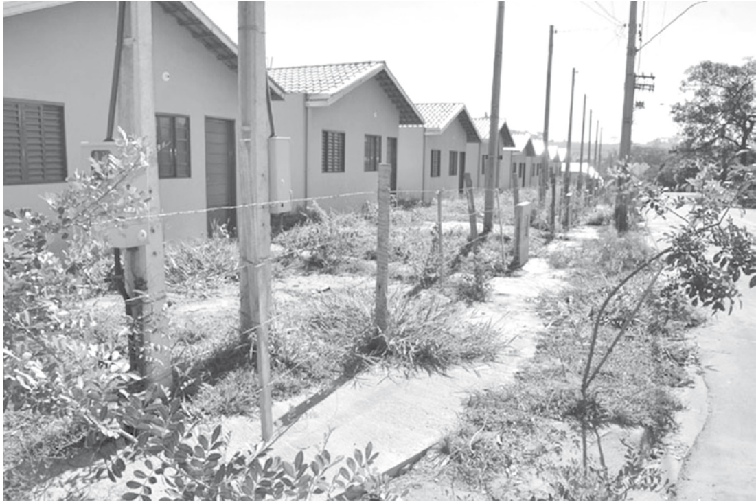
Entre as prioridades está o acompanhamento social dos beneficiários – cadastramento em programas sociassistenciais