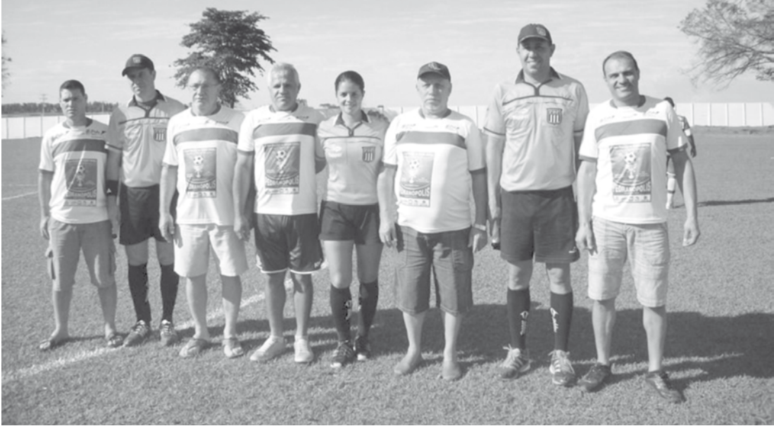
Com juizes e assistentes profissionais, a arbitragem de alto nível garante bons jogos durante a 2ª Copa de Futebol Amador “Valdecir Della Rovere”

vamente por 1 x 1, entre as equipes do Beat Styl E.C. de Santa Fé do Sul e o A.R.E. Miraestrelense. Na segunda decisão de pê- naltis da rodada, vitória da equipe de Mira Estre- la, por 4 x 2. A.A. Pontalin- dense e A.R.E. de Mira Es- trela garantiram vaga na fase semifinal. Já neste domingo, dia 27, será realizada a 6ª roda- da da Copa “Valdecir Della Rovere”, em, Pedranópolis, quando mais duas equipes garantirão classificação. No