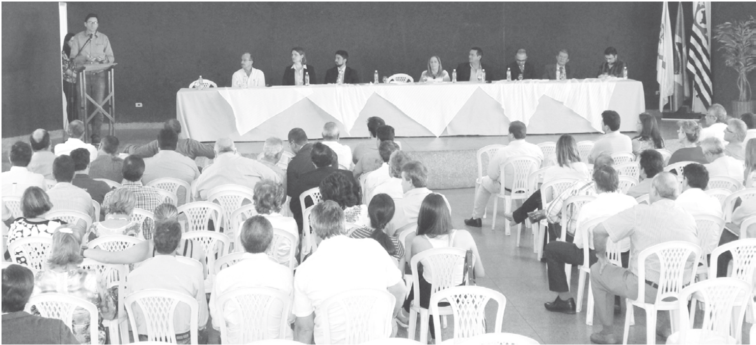
Evento marcou a abertura de consulta pública do Edital de Licitação da ZPE Paulista. O documento já está disponível no site da Prefeitura de Fernandópolis, onde permanecerá durante 15 dias para que os interessados possam tirar dúvidas ou/e enviar sugestões. O edital está disponível para download no endereço www.fernandopolis.sp.gov.br em uma janela extra ou no item “Licitações Públicas”, “Editais”. As dúvidas ou sugestões sobre o edital devem ser enviadas para a Secretaria Municipal de Desenvolvimento Sustentável, através do email: desenvolvimento@fernandopolis.sp.gov.br