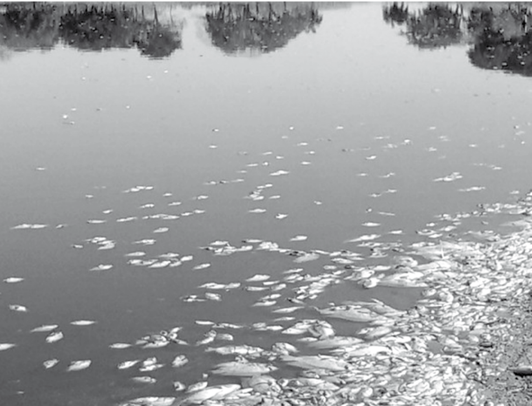
Cetesb investiga o que poderia ter causado morte de peixes

Suspeita é de que a falta de oxigênio na água tenha causado as mortes e amostras da água foram coletadas para análise