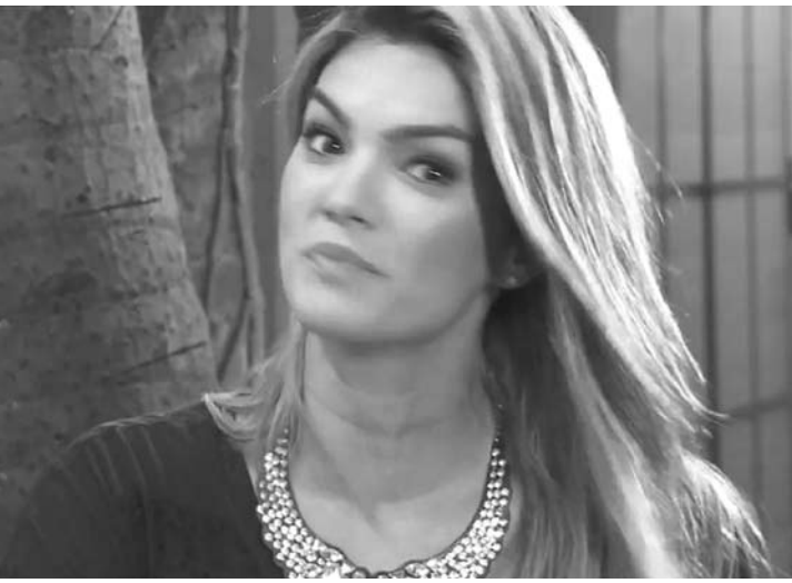
Kelly Key no programa "Na Lata"