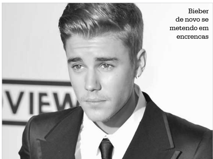
Bieber de novo se metendo em encrencas

Será que Bieber está fazendo isso tudo para, como alguns dos ídolos da música americana, como Elvis Presley e Frank Sinatra, passar um tempo na cadeia?