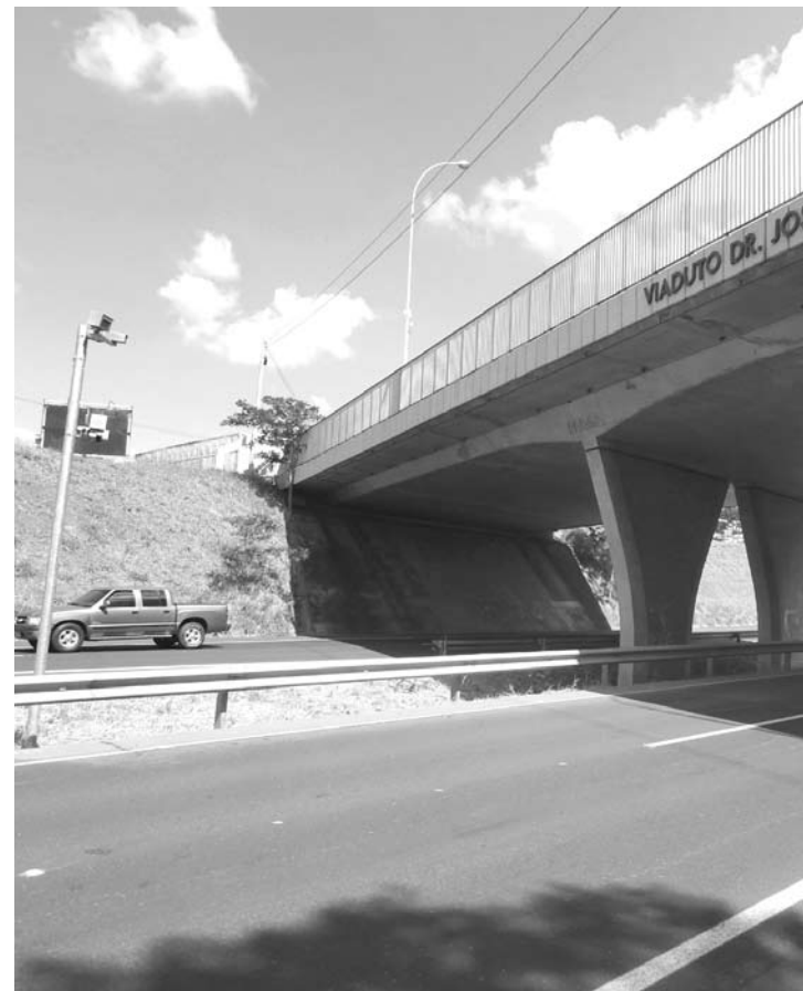
Em Fernandópolis, os dois radares já estão instalados na altura do pontilhão que dá acesso ao Shopping, mas ainda estão desligados

Além de Tanabi, receberam radares Fernandópolis (km 551), Jales (km 583), Santa Fé do Sul (km 623) e Votuporanga (516). O último prazo do DER afirmava que os aparelhos começariam funcionar na segunda quinzena deste mês, mas a previsão é de que os radares sejam ligados até o final de agosto.