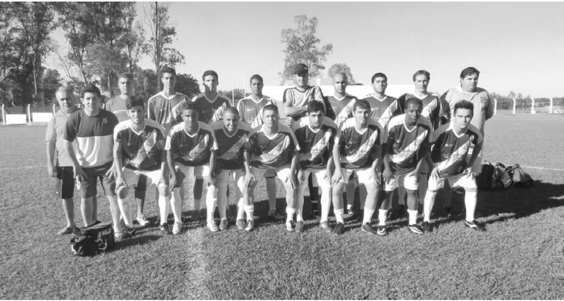
Jogadores e equipe técnica do Clube Esportivo de Ouroeste