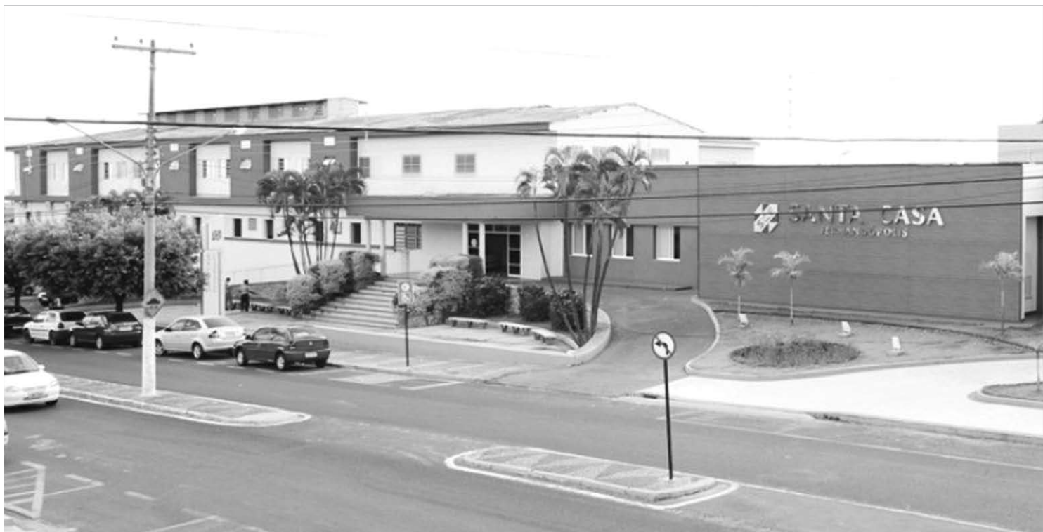
A Santa Casa de Fernandópolis enfim recebeu o “sinal verde” do BNDES

operação financeira em que a instituição financeira fornece recursos para outra parte que está sendo financiada, de modo que esta possa executar algum investimento que precisam necessariamente ser investidos do modo acordado em contrato.