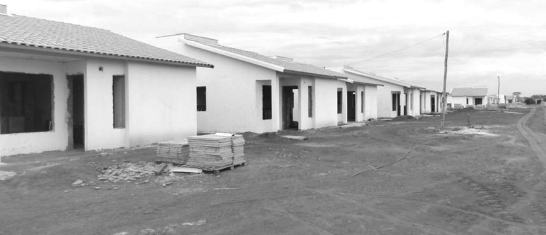
As unidades contarão com o padrão de qualidade da CDHU, piso cerâmico em todos os cômodos, azulejos no banheiro e nas paredes da cozinha, e muro de divisa entre os lotes