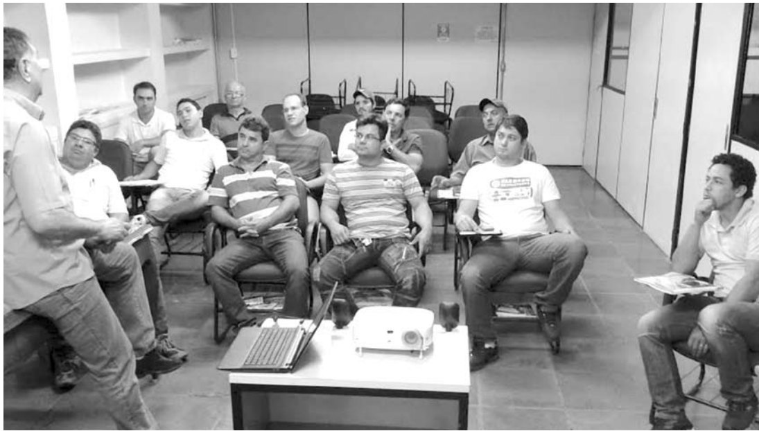
O curso faz parte das ações coordenadas pelo NURA

Segundo a coordenadora do Projeto Empreender