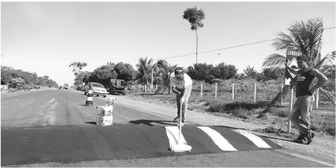
Acima e ao lado, os redutores de velocidade (lombadas), construídos nos dois sentidos, num trecho em frente ao Frigorífico Ouroeste; as ondulações transversais respeitam as normas estabelecidas pelo Conselho Nacional de Trânsito