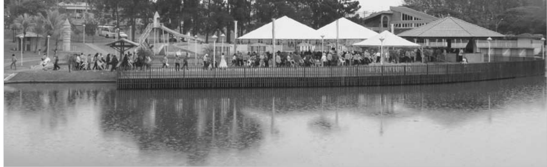
Encontro realizado na Chopplândia reuniu mais de mil pessoas representando 12 municípios da região e contou com a exposição de oficinas e apresentação de 'desfile de moda' sustentável

O II Encontro Intermunicipal da Melhor Idade em Meio Ambiente foi prestigiado por autoridades das cidades integrantes do Consórcio. Representando Valentim Gentil, estiveram presentes a prefeita