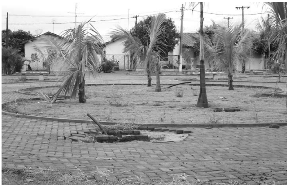
Vista da Praça do Jardim das Flores, em Guarani d'Oeste, com muitos buracos e em situação de abandono, mesmo antes de ser concluída; ao lado, postes de iluminação jogados no local, ficando ao sol e à chuva, se deteriorando com o tempo

“No local que seria utilizado para as crianças brincarem, para o lazer