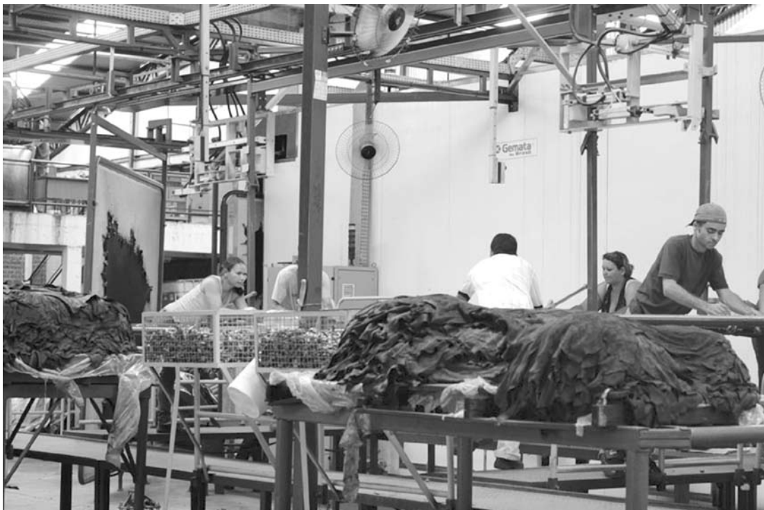
O crescimento das exportações na cidade é resultado da indústria de transformação do couro semi-acabado e acabado

Com a diversificação dos acabamentos especializados, o curtume atende ao mercado nacional e no exterior em três diferentes segmentos: estofamentos, calçados e artefatos.