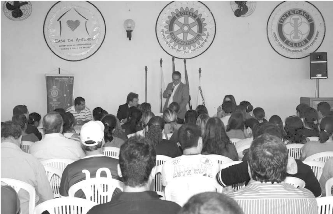
Assembleia de criação do “Sindicato dos Auxiliares de Administração Escolar de Fernandópolis e Região” rio do Trabalho e Emprego para tanto, passa a ser feita por sindicato específico, devidamente instituído, constituído por Auxiliares da Administração Escolar e filiado à “Federação Paulista dos Auxiliares da Administração Escolar do Estado do São Paulo – FEPAAE”, podendo, a partir de agora, servir aos anseios de toda a classe, podendo atuar de maneira legítima e legal. Com isso, a entidade já estruturada, poderá dar início ao processo de filiação, bem como, à realização das atividades pertinentes à sua atuação.

festavam o desejo de ver seus interesses defendidos de maneira objetiva, clara, acessível e respeitosa. A criação do SAAEFER mostrava-se, há tempos, como grande anseio dos funcionários da categoria que, a partir de agora, serão ouvidos e recebidos em sede própria, em uma relação de proximidade, atenção e respeito. Com isso, a representatividade da categoria que, antes, era realizada de maneira difusa por sindicato de outra categoria e sem a autorização do Ministé-