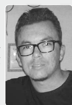
Elder Câmpoli Empresário

Não concordo com esse aumento, sinto que cada vez mais os consumidores são lesados, já pagamos um absurdo nos produtos que comercializamos, as taxas de juros são muito altas no Brasil e dificulta cada vez mais a vida do trabalhador. Eu que viajo diariamente sinto isso de maneira intensa no final de cada mês, pois não são apenas despesas com o combustível, tem também os impostos, pedágios e a manutenção do veículo. Infelizmente temos que conviver com isso.