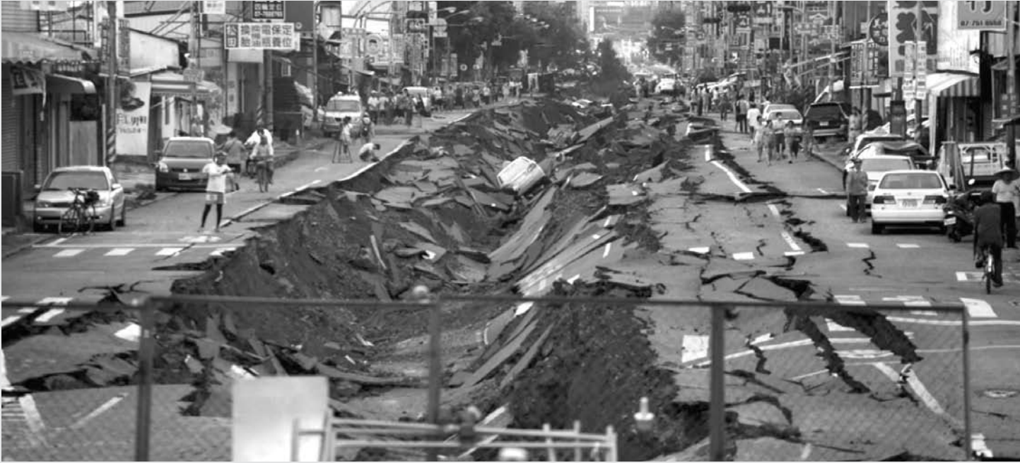
imagem do dia

Rua de Kaohsiung (Taiwan) fica destruída em extensão de várias quadras após uma sequência de explosões na tubulação de gás da cidade portuária, ocorrida na madrugada de ontem. As explosões atingiram cerca de três quilômetros quadrados do distrito de Cianjhen. Ao menos 20 pessoas morreram e mais de 200 ficaram feridas no incidente.