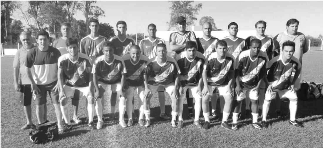
Jogadores e equipe técnica do Clube Esportivo de Ouroeste