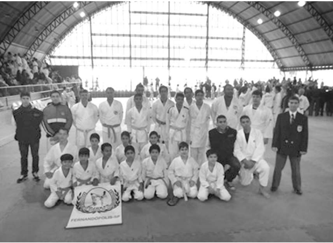
Atletas de Fernandópolis premiados na competição