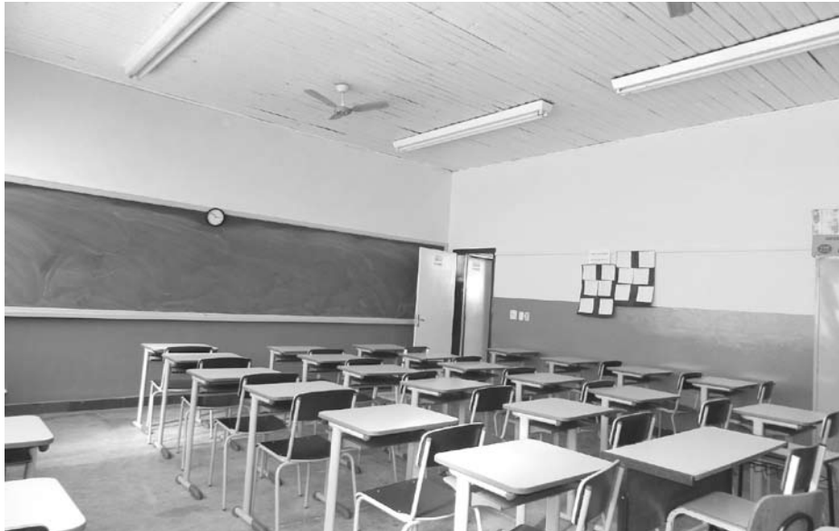
As salas de aula também ganharam nova pintura, o que deixou o ambiente mais limpo e confortável