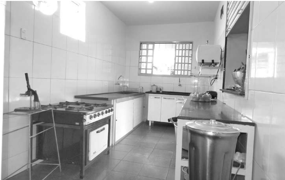
A cozinha da escola foi adequada com a troca de revestimentos, pisos e instalação de novas janelas