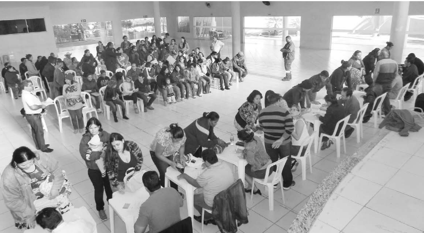
Cerca de 1.300 agendamentos foram realizados e já foram processadas mais de 1.000 inscrições