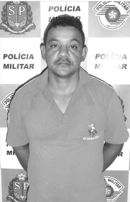
D.R.C., de 38 anos de idade, é ex-morador de Ouroeste e estava sendo procurado desde julho de 2013