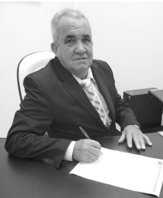
O presidente Luizinho tomou a iniciativa de instituir no município o Parlamento Jovem