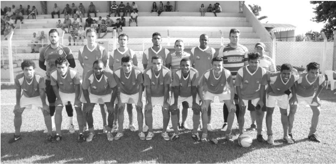
Equipe de Pontalinda, finalista deste ano em Pedranópolis