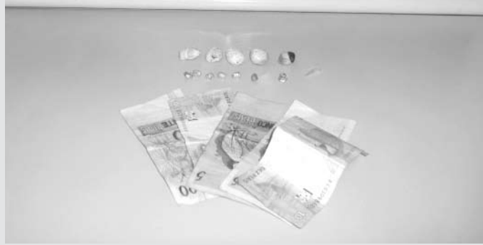
Porções das drogas apreendidas e dinheiro do tráfico