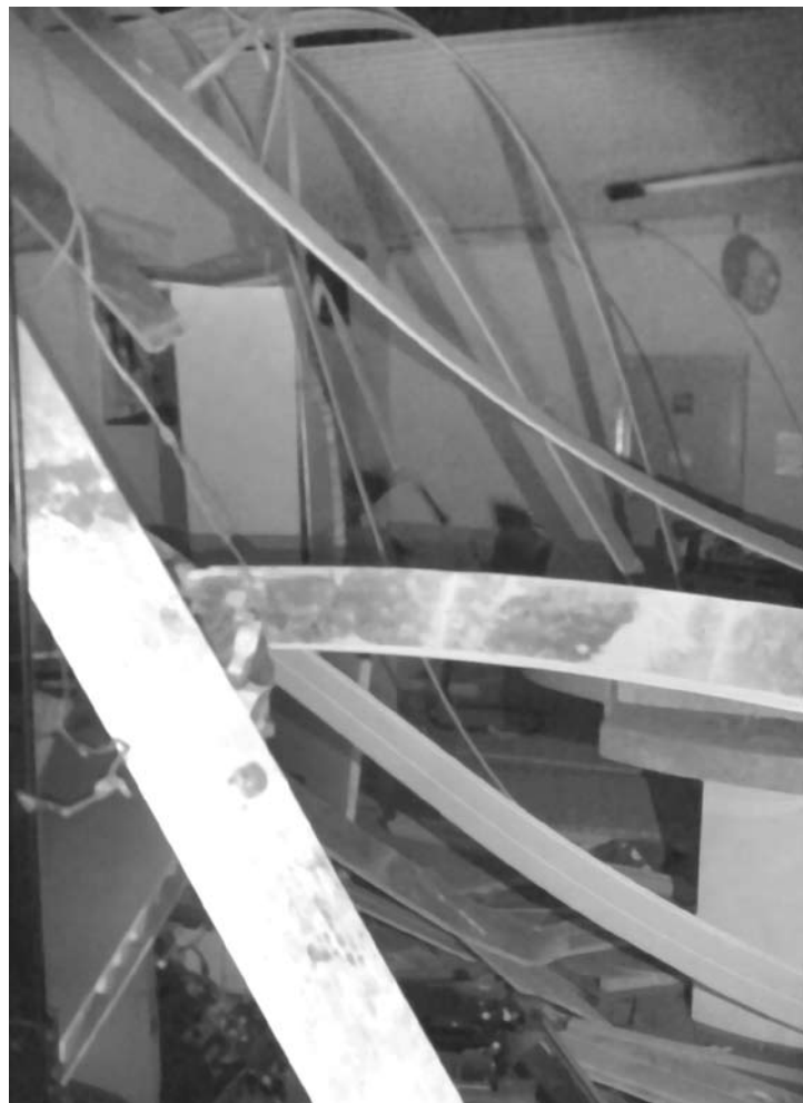
Vista da agência do Banco Bradesco em Guarani d'Oeste, registrando seu estado após a ação da quadrilha

destruído. Os integrantes da quadrilha de roubo a bancos, todos encapuzados, foram vistos portando uma "arma longa" - pos-