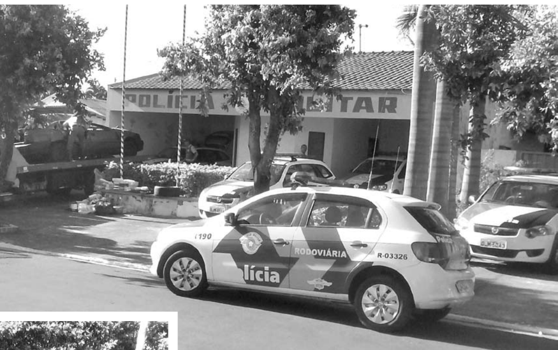
A ação contou com o trabalho da Polícia Militar de Ouroeste, Polícia Rodoviária de Fernandópolis e Polícia Federal de Jales

que estava acompanhado por mais dois passageiros, perdeu o controle do carro e capotou. Antes da chegada das viaturas policiais, os produtos foram escondidos em um matagal e o veículo também foi removido do local do acidente. Diante dis-