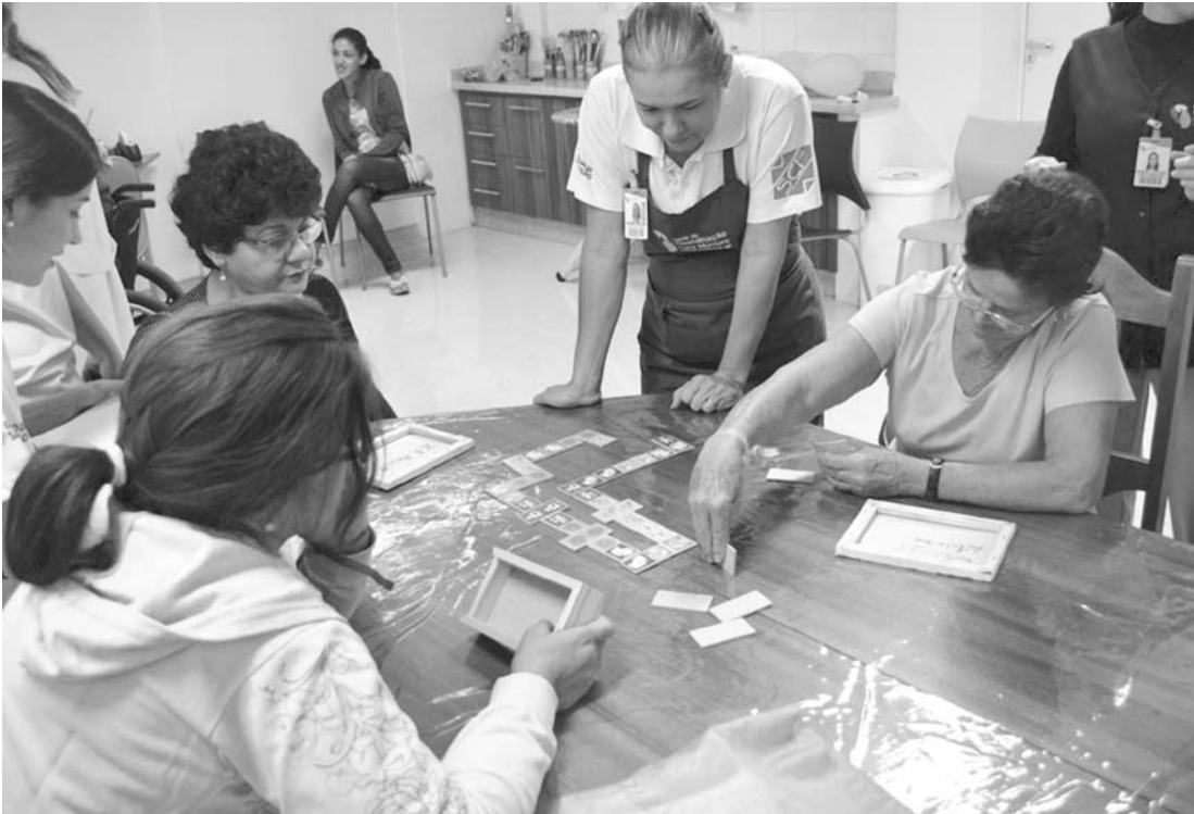
Pacientes e funcionários se divertiram em gincana

UNIDADE FERNANDÓPOLIS A Unidade de Reabilitação Lucy Montoro de Fernandópolis iniciou suas atividades em 15 de junho de 2012, atendendo a 52 municípios da região, com