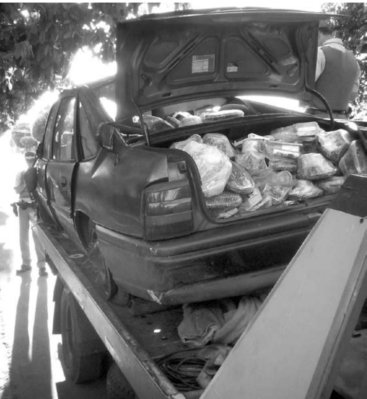
O veículo que capotou com uma carga de diversos produtos elétrico-eletrônicos ficou parcialmente destruído

va de um policial militar do Distrito Federal - que estaria nas proximidades de Ouroeste com outro veículo, para apoiar no carregamento dos produtos. Os ocupantes do veículo foram encaminhados à Delegacia da Polícia Federal de Jales junto com os produtos apreendidos. Após o flagrante, eles foram ouvidos, pagaram fiança e acabaram liberados, sendo que responderão em liberdade pelos crimes de contrabando e descaminho. Segundo informações extraoficiais, o valor de toda a carga contrabandeada está em torno de R$ 25 mil, sem nota fiscal alguma.