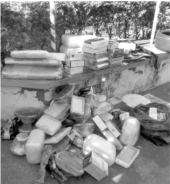
Segundo informações extraoficiais, o valor de toda a carga apreendida está em torno de R$ 25 mil