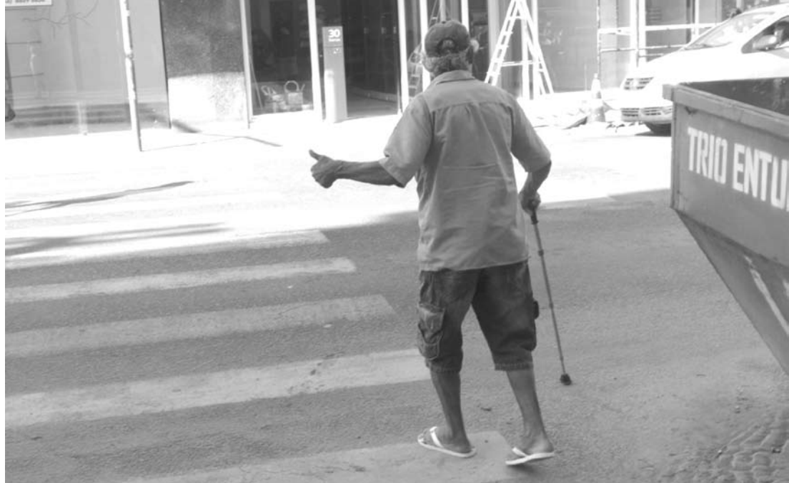
A principal deficiência informada pelos eleitores foi a de locomoção, seguida da visual.

Com intuito de garantir a acessibilidade das seções eleitorais, o TSE aprovou e divulgou algumas determinações. Como por exemplo: a Resolução