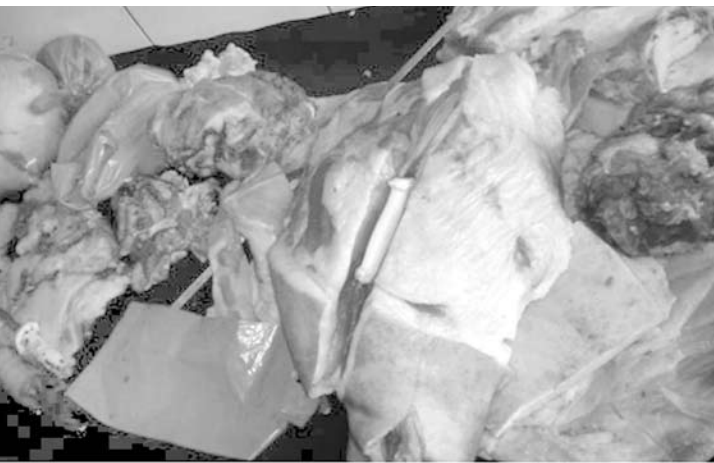
Foram apreendidos 137,7 kg de carne suína imprópria para o consumo e que estava sendo comercializada em Arabá

O consumo de carne de animais abatidos sem procedência, higiene e expostos à sujeira, pode acarretar diversos problemas de saúde. O risco maior é a de infecção alimentar, que pode levar à morte, sem contar as zoonoses (doenças que são transmitidas dos animais para os seres humanos), causando uma série de problemas. As zoonoses de maior importância são a Tuberculose, Brucelose, Cisticercose, entre outras. Essas doenças podem levar à infertilidade, artrites, febres constantes, abortos e até à demência.