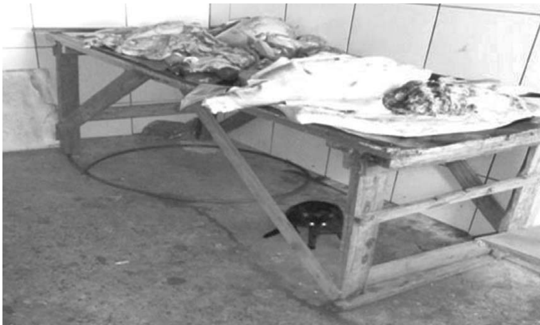
Após o flagrante, toda a carne ficou sobre a mesa por várias horas com a presença de animais, moscas e exposta à temperatura inadequada

A equipe de Vigilância Sanitária de Ouroeste, juntamente com a Guarda Municipal, Polícias Civil e Militar, apreendeu no último dia 31 de julho, 137,7 kg de carne suína que estavam sendo comercializados no distrito de Arabá. As denúncias anônimas já vinham sendo feitas em dias anteriores, porém, a situação de flagrante do comércio ilegal só se concretizou assim que a equipe chegou ao local e se deparou com a residência sem nenhum morador ou pessoa que pudesse dar qualquer informação. Diante dos indícios observados da atividade ilegal, foi acionada a Polícia Militar e a Guarda Civil para registrar o caso. Toda a carne ficou sobre a mesa por várias horas