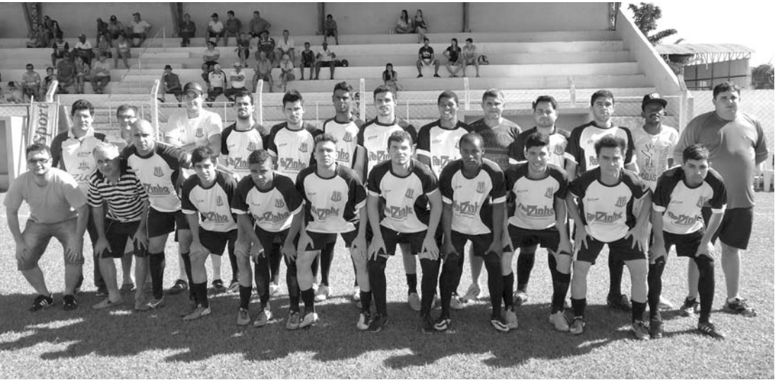
Time de Ouroeste, que chega a mais uma final do futebol amador