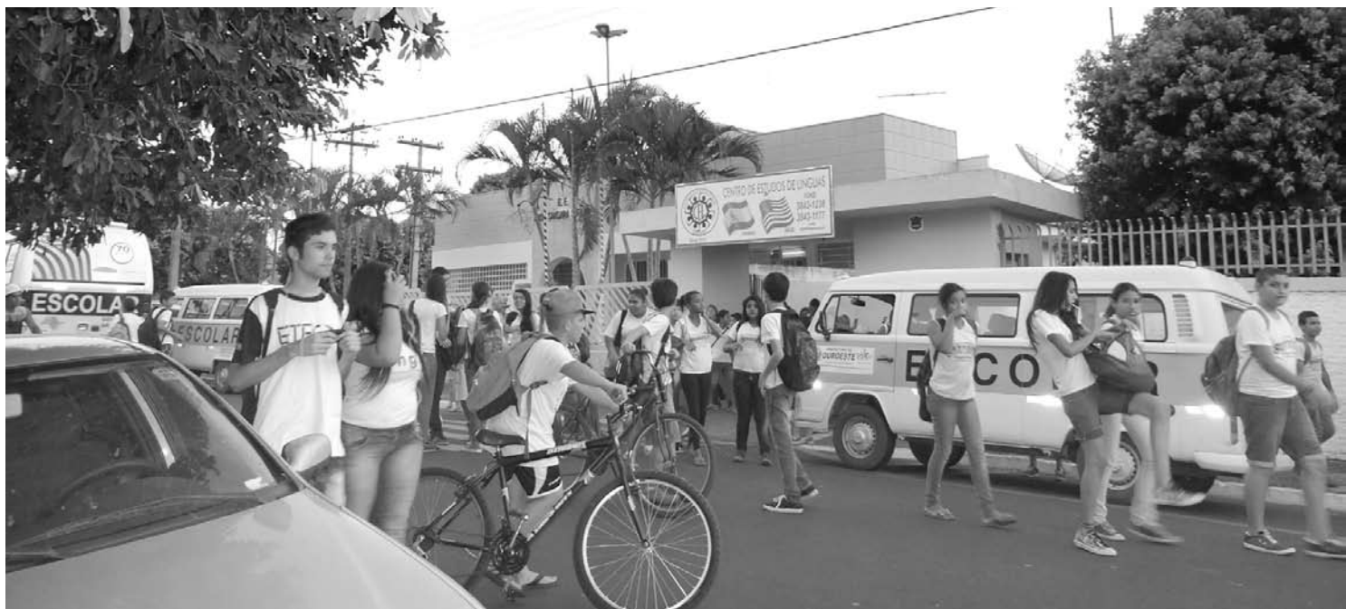
O Projeto tem como objetivo inserir o jovem no processo legislativo, possibilitando o conhecimento de como funciona a Câmara em seu dia a dia

de todos no parlamento mirim a conhecer de perto os trabalhos da Casa Legislativa. “Um projeto como esse desperta ainda a cidadania de cada um dos jovens e pais que consequentemente virão prestigiar seus filhos. Assim que for aprovado pelo Executivo, vamos nos reunir com diretores e coordenadores nas escolas para falar sobre o Projeto”, declarou o presidente. O vereador “Cidão Paçoca” foi à Tribuna para comentar sobre o Projeto de Resolução. “A aprovação do Projeto que cria no município o Parlamento Jovem permitirá a inserção dos jovens na