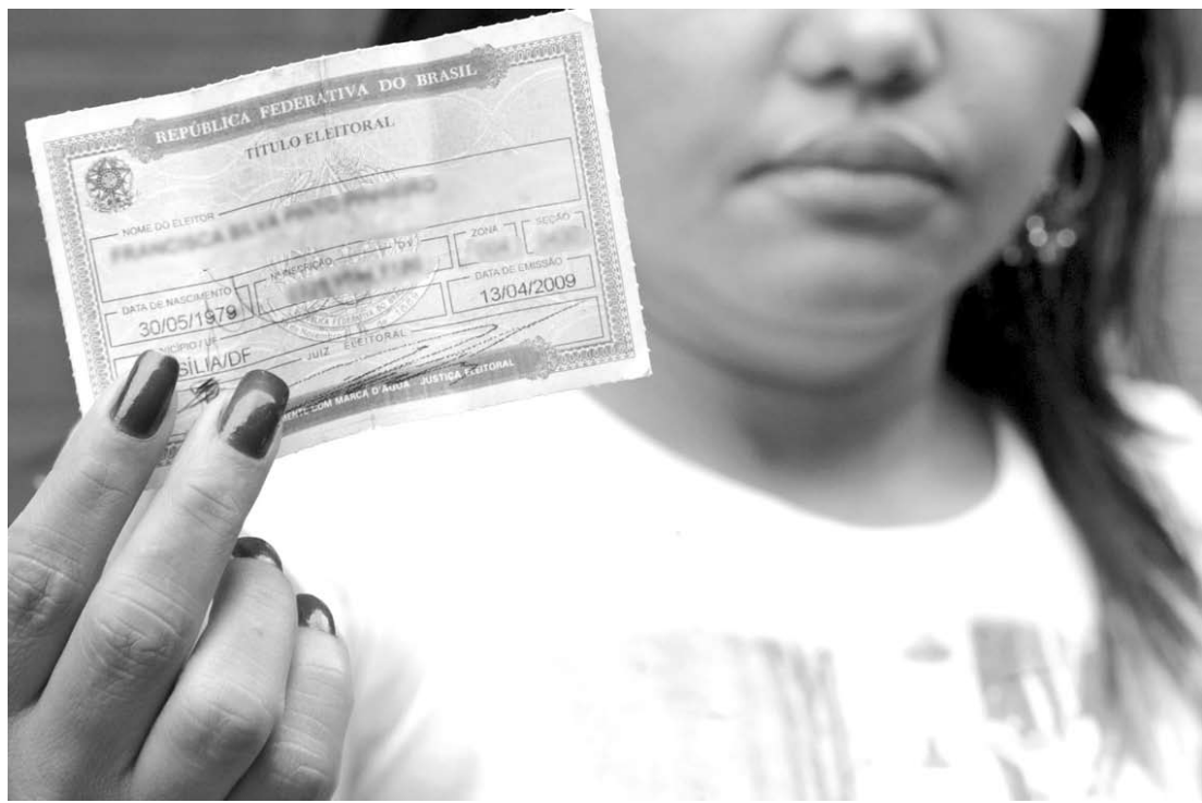
Número de pessoas com superior incompleto também subiu em relação a 2010, aumentou em 1,5 milhão

De acordo com o especialista, com o aumento da escolarização e da renda, fazer campanha em uma região pobre não significará encontrar um eleitor