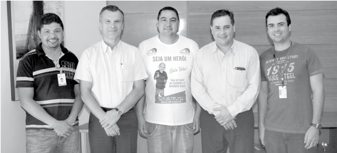
FEF e Núcleo de Hemoterapia atuam juntos nesta causa solidária

No dia 26 de junho, alunos do curso de Engenharia de Alimentos e Nutrição da FEF, participaram da