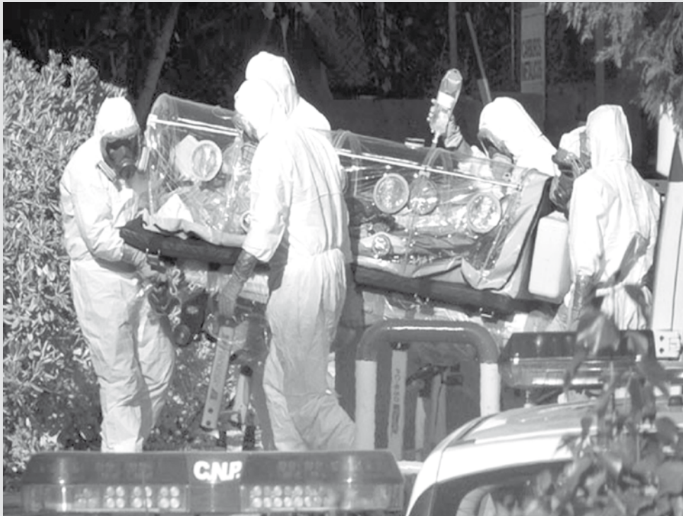
Missionário espanhol com ebola morre em Madri

Este jornal não se responsabiliza por conceitos, opiniões, pareceres e outras manifestações emitidas em artigos assinados ou encartes que são de inteira responsabilidade de seus autores.