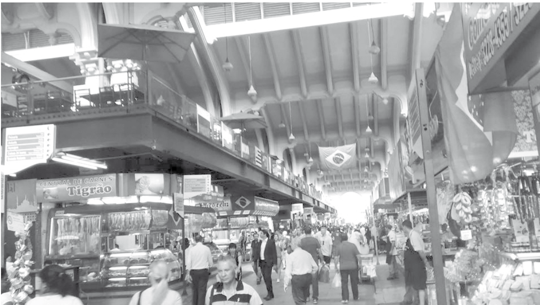
Registro da Feira Internacional realizada em São Paulo, que contou com a participação da Engenharia de Alimentos e Nutrição da FEF

30ª edição da Fispal Food Service - “Feira Internacional de Produtos e Serviços para Alimentação Fora