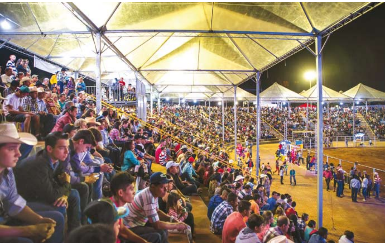
Público local e da região marcou presença durante todos os dias da Expô de Estrela

Cerca de 25 mil pessoas passaram pelo recinto nos quatro dias de festa