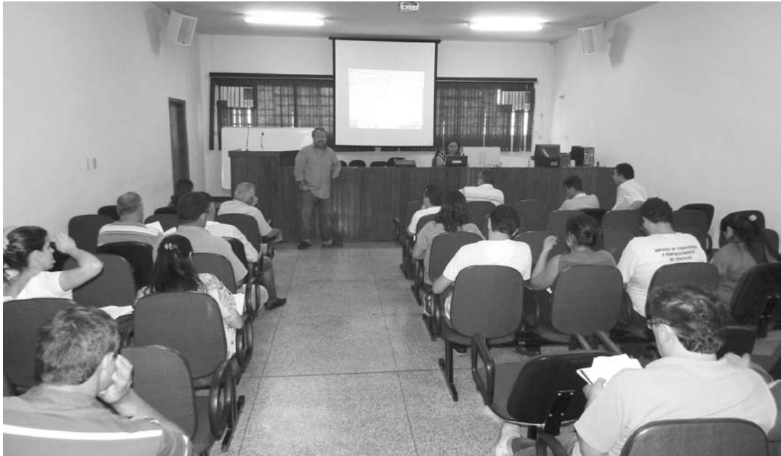
O Plano Diretor Participativo é uma Lei Municipal, que deve ser elaborada com a participação ativa da sociedade

minantes e as vocações da cidade, bem como os problemas e as potencialidades do município. É um conjunto de regras básicas que determinam o que pode e o que não pode ser feito em cada parte da cidade. É um processo de discussão pública que analisa e avalia o município para depois formular a cidade que se quer. Neste encontro, o Plano Diretor deve ser discutido para ser aprovado pela Câmara de Vereadores e sancionado pelo prefeito. O