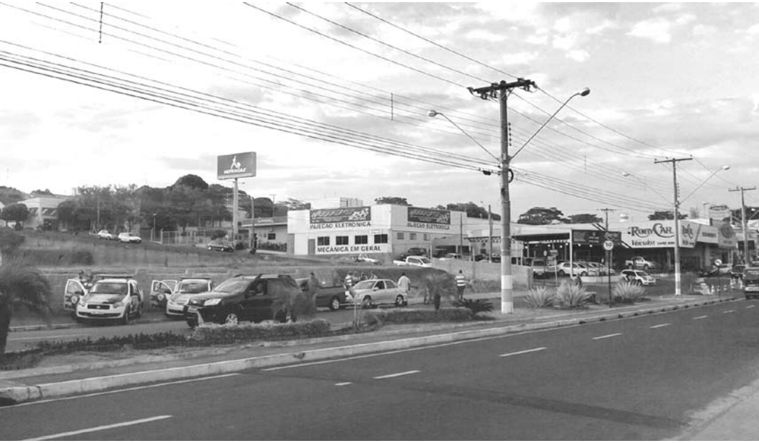
PM durante operação em Avenida de Fernandópolis

→ Da REDAÇÃO contato@oextra.net O 16º Batalhão da Polícia Militar, com sede em Fernandópolis, desenvolveu na última quinta-feira, dia 14, das 15 às 23hs, a Operação “Liga de Delos”, nos municípios de Fernandópolis, Votuporanga e região, com a mobilização de 650 policiais Militares, 140 viaturas, 10 cães e 1 helicóptero Águia. O objetivo principal da ação, que contou com apoio das polícias Ambiental e Rodoviária, foi proporcionar a sensação