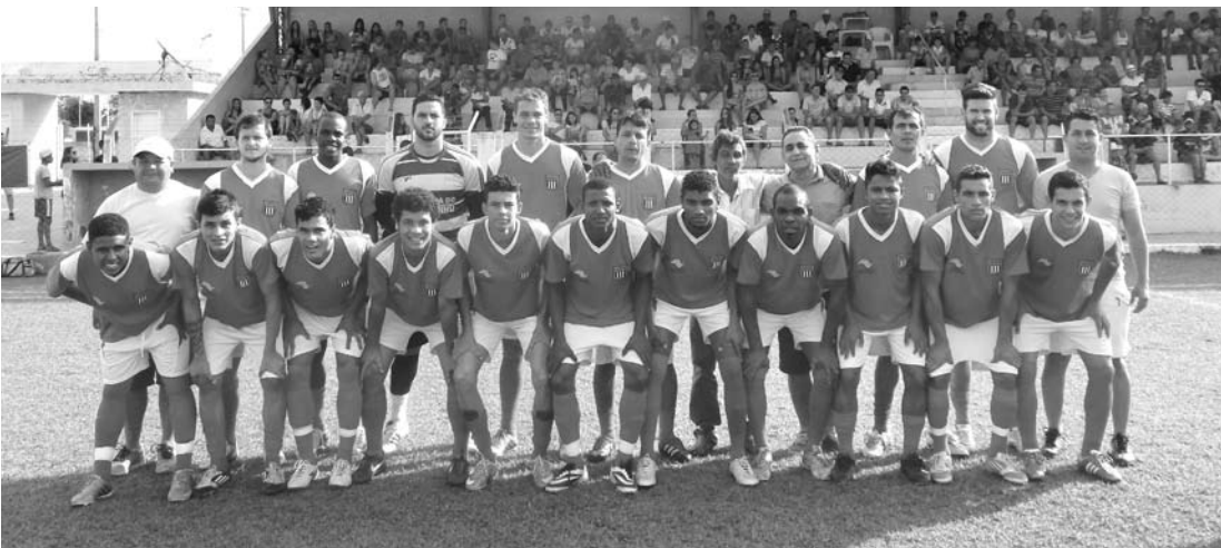
Atletas da A.A. Pontalindense, campeões da 2ª Copa de Futebol Amador “Valdecir Della Rovere”