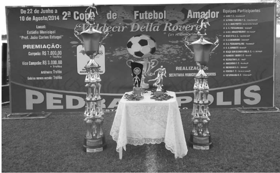
Troféus e medalhas oferecidos pelos organizadores da competição

campeão, uma premiação de R$ 3 mil e medalhas de prata. Esta competição contou com o apoio da Prefeitura e Câmara Municipal de Pedranópolis, sendo uma realização da Secretaria Municipal de Esportes.