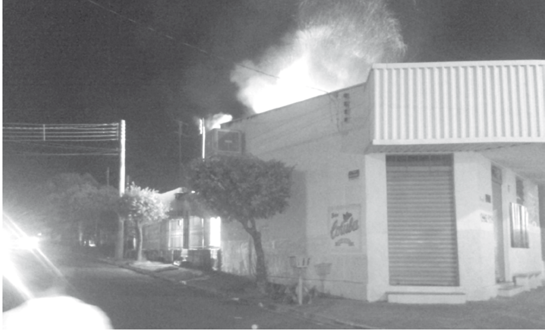
Incêndio se alastrou rapidamente por toda a residência

Bombeiros precisaram agir rápido para conter o fogo