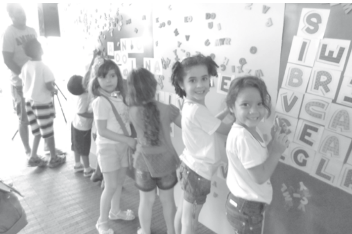
Durante a visita, os alunos utilizaram uma lousa na qual era possível montar palavras para fazerem leituras diversas