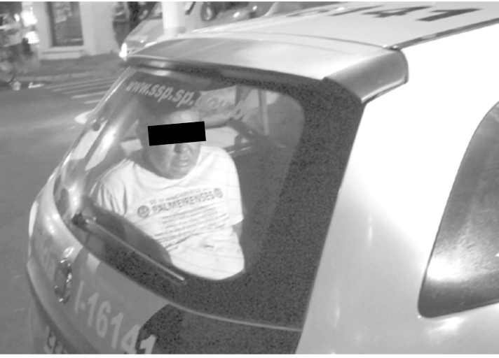
Acusado de incendiar residência assumiu autoria do crime