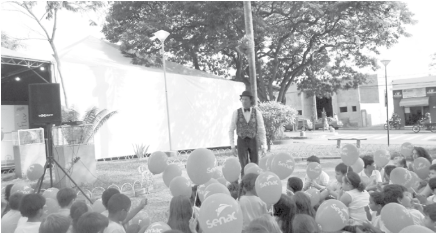
Momento em que os alunos assistiram a um contador de história

As crianças da segunda etapa da EMEI Paraíso Infantil de Ouroeste, juntamente com suas professoras e auxiliares docentes, visitaram a Feira Literária de Votuporanga, FLIV, que aconteceu durante os dias 6 e 7 de agosto. Durante a visita, apreciaram o estante de editoras de livros e o “Espaço Brincar”, onde divertiram-se com escorregadores e telefone sem fio feito com canos de PVC, além utilizarem uma lousa para montar palavras e fazerem leituras diversas. Divertiram-se, também, ao assistirem a um contador de histórias. O evento proporcionou o enriquecimento cultural para os alunos, além de muita diversão.