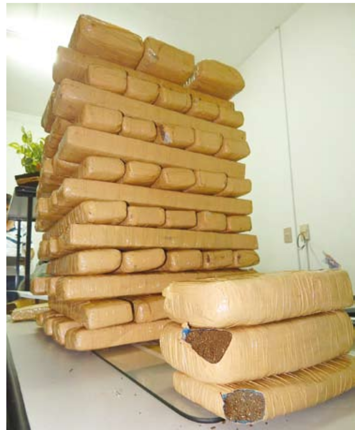
Droga apreendida: 69,5 Kg de maconha e 2,4 Kg de haxixe encontrados no porta-malas da SUV Santa Fé, e mais 900 gramas de maconha apreendidos em Votuporanga

Investigado: U.E., de 27 anos, morador em um sítio nas proximidades de Jales e São Francisco. Eletricista de profissão, mesmo não sendo considerado “procurado” está na mira da Polícia por ser suspeito de pilotar o Fiat Palio, placas de Votuporanga, que teria atuado como “batedor” para seus comparsas, que traziam a droga apreendida na noite de domingo.