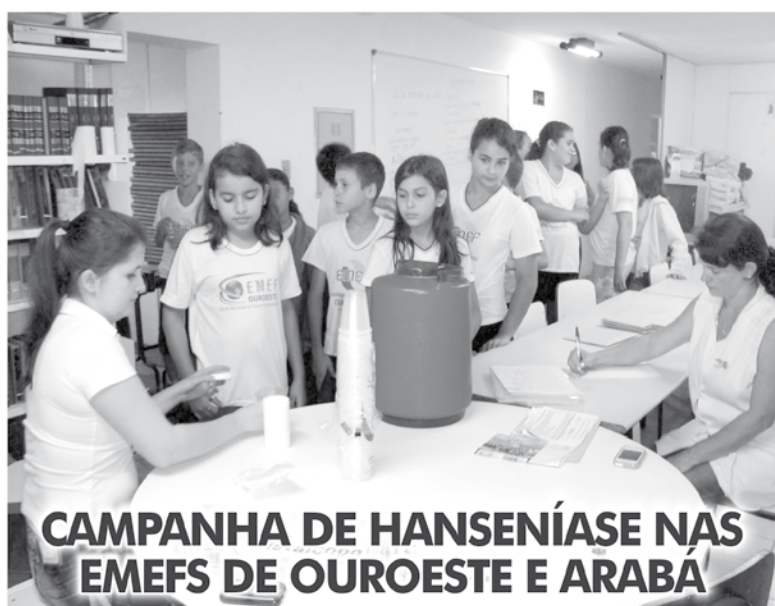
CAMPANHA DE HANSENÍASE NAS EMEFS DE OUROESTE E ARABÁ