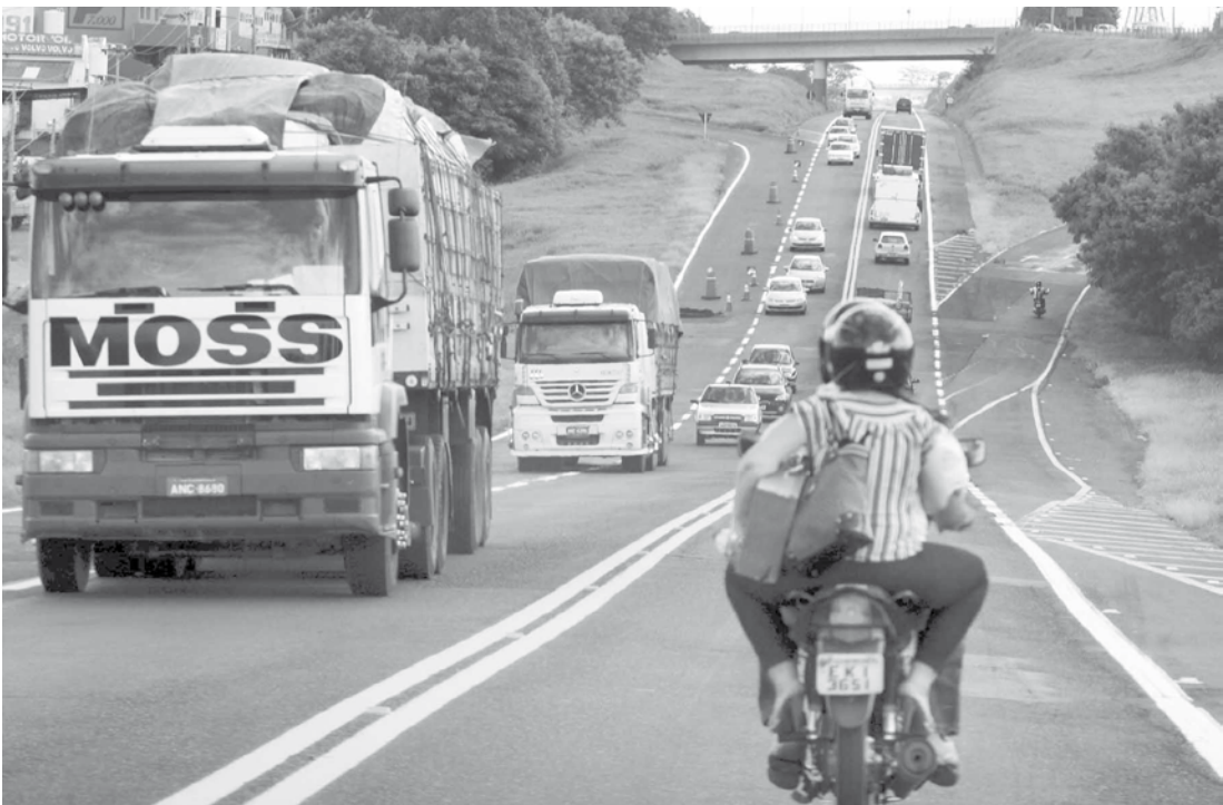
O Dnit vai duplicar 17 quilômetros de Rio Preto a Bady Bassitt

Rio Preto a Bady Bassitt. A obra completa deve ser entregue em três anos e está orçada em cerca de R$ 180 milhões. Com a duplicação, serão construídos pontilhões e acessos mais seguros retirando os cruzamentos em níveis, responsáveis por vários acidentes. A duplicação da BR-153 se arrasta há mais de 10 anos na região.