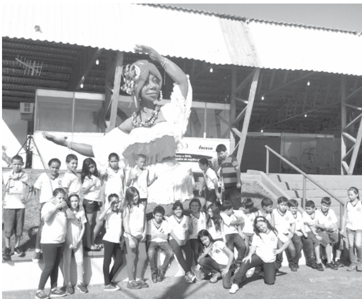
Os alunos durante visita a Olímpia