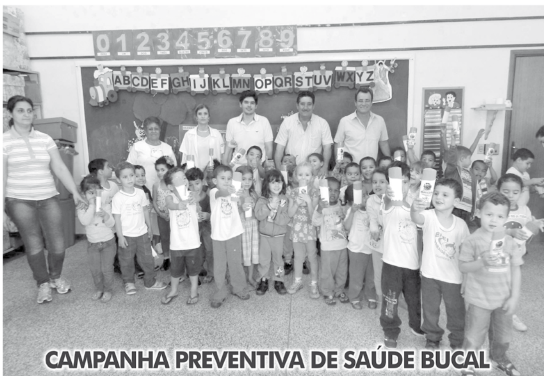
CAMPANHA PREVENTIVA DE SAÚDE BUCAL