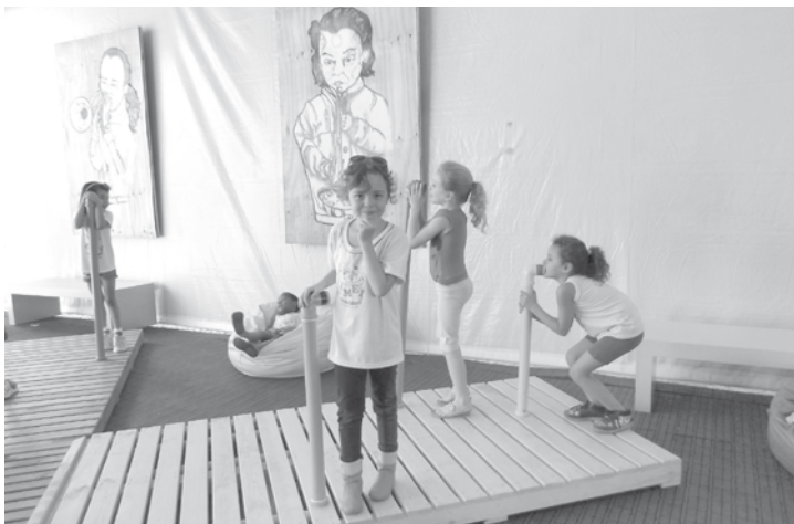
Alunos se divertindo com escorregadores e telefone sem fio feito com canos de PVC