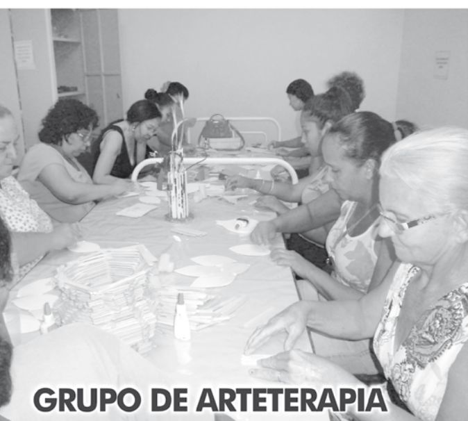
GRUPO DE ARTETERAPIA