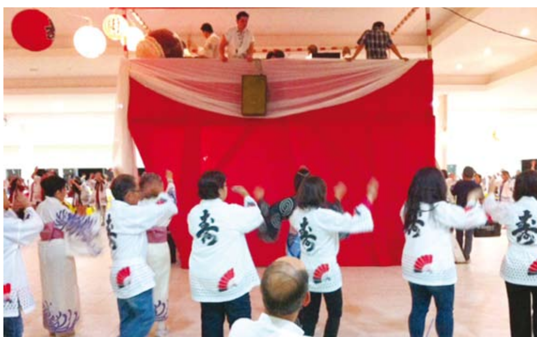
Grupo se apresentando na edição Bom Odori de 2013

tradicional está acontecendo em várias cidades da região.