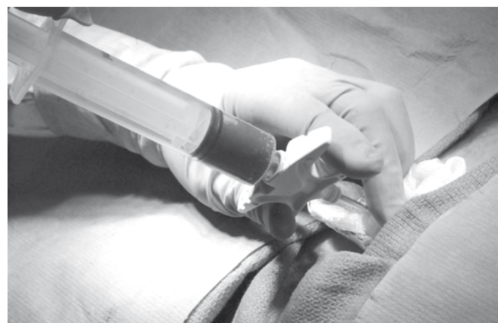
"Não se deve pulverizar os recursos em novos centros de tratamento, e sim, fortalecer os já existentes", enfatiza a médica Lúcia Silla

trução de um centro de transplantes de medula alogênica, não aparentada, no Nordeste é necessária, mas enfatizou que não se deve pulverizar os recursos em novos centros e sim fortalecer os já existentes. "Esse tipo de transplante é muito complexo, pois as chances de rejeição são bem maiores, por isso requer uma estrutura hospitalar de última geração pa-