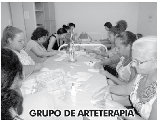
GRUPO DE ARTETERAPIA