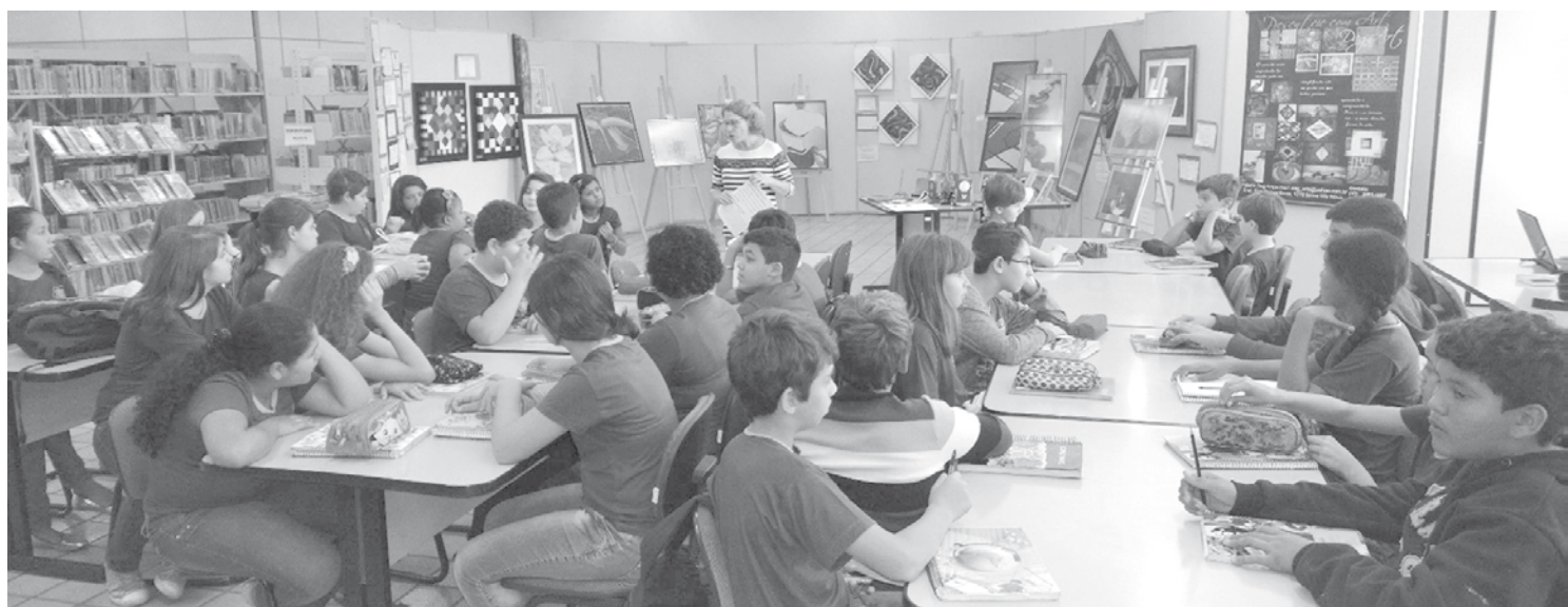
Alunos da EELAS em visita à Biblioteca Municipal

As medidas anunciadas começarão a vigorar a partir da publicação de duas medidas provisórias, o que, segundo o ministério, deve ser feito até a semana que vem. Algumas delas dependem, ainda, de resolução do Conselho Monetário Nacional.