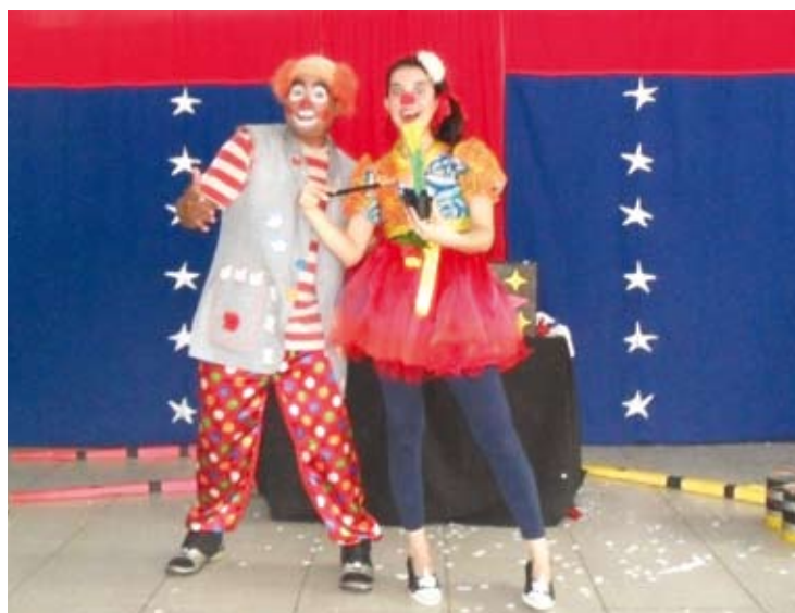
Espectáculo é prioritariamente voltado para o público escolar