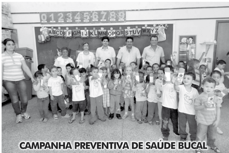
CAMPANHA PREVENTIVA DE SAÚDE BUCAL