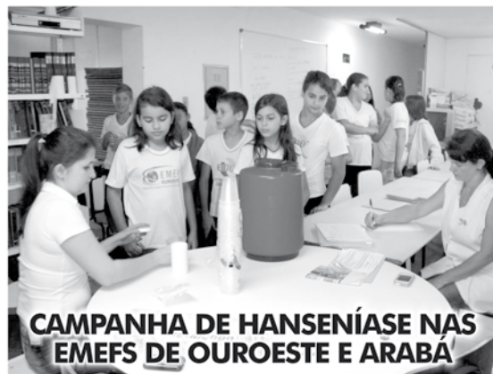
CAMPANHA DE HANSENÍASE NAS EMEFs DE OUROESTE E ARABA