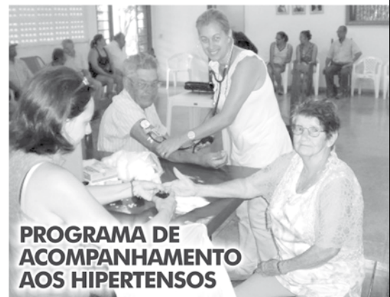
PROGRAMA DE ACOMPANHAMENTO AOS HIPERTENSOS

PREFEITURA DE OUROESTE Juntos Fazemos Mais