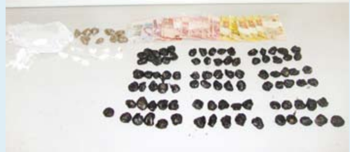
As porções das drogas apreendidas pela PM