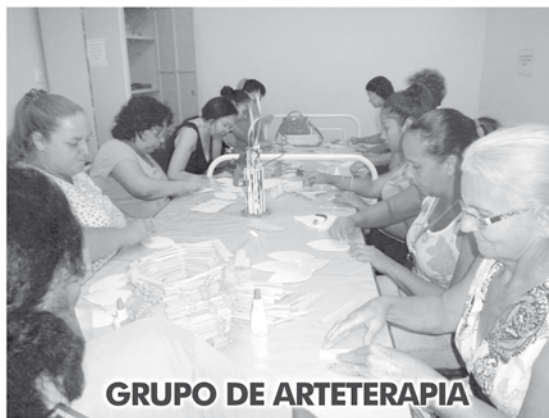
GRUPO DE ARTETERAPIA