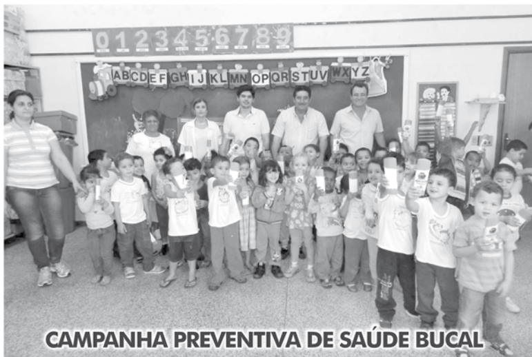
CAMPANHA PREVENTIVA DE SAÚDE BUCAL