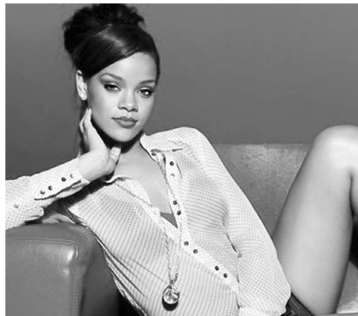
Rihanna elegendando ‘os mais’

ta pela cantora foi Penélope Cruz. “Ela é f*da! Se eu pudesse acordar amanhã e ser parecida com ela, isso seria ótimo”, explicou. Nada mais justo. Agora, quando o assunto são os meninos, a opinião de Riri é menos consensual. “Vince Vaughn. Ele é maravilhoso. Fantástico”, disse. O que é uma coisa até difícil de conceber, pois Vince faz aquele monte de filme de comédias, muitas vezes fazendo personagens paspalhões que são o oposto de sexy. Mas se Rihanna falou, tá falado.