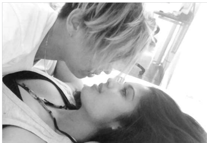
Patricia Yurena Rodriguez e a namorada