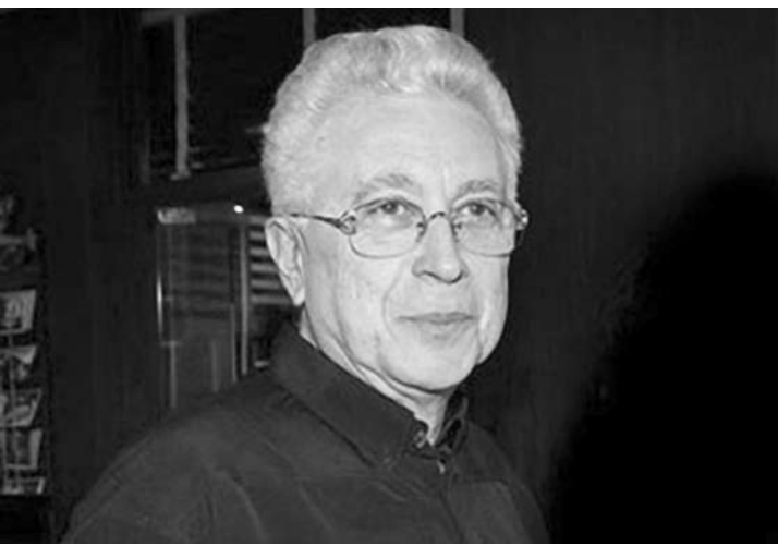
Novela está há 1 mês no ar e conquistou o telespectador