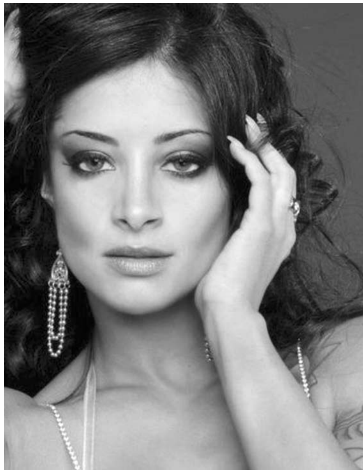
Pelo jeito, foi a Caprichosos que saiu perdendo.

“Ainda sinto alguma tontura, mas não mais como antes. Estou progredindo e sei que sairei 100% daqui”, disse, se referindo ao hospital. Enquanto está sob cuidados médicos, Netinho se dedica a escrever sua biografia. O livro, inclusive, foi o principal tema da conversa durante o almoço.