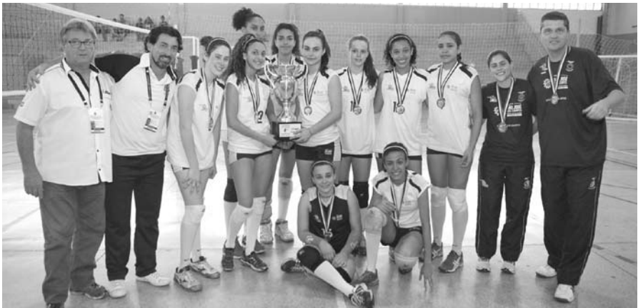
A equipe feminina de São José dos Campos ficou com o segundo lugar