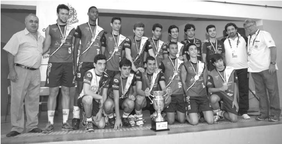
A equipe de Mauá, que conquistou o segundo lugar na competição