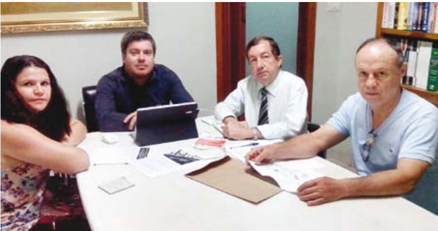
Integrantes do CONSEG discutem ações que serão desenvolvidas na Semana de Trânsito

O tema da Semana de Trânsito pretende ampliar o conceito de segurança com a finalidade de conscientizar a sociedade, com vistas à internalização de valores que contribuam para a criação de um ambiente favorável ao atendimento de seu compromisso com a “valorização da vida” focando o desenvolvimento de valores, posturas e atitudes, no sentido de garantir o direito de ir e vir dos cidadãos. Órgãos e entidades envolvidas na organização deste evento realizarão intensa programação, que consistirá em palestras nas escolas, distribuição de panfletos de conscientização, colocação de faixas alusivas ao tema e entrevistas