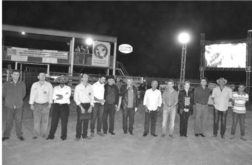
Comissão organizadora, vereadores e prefeito durante 25ª Festa do Peão de Boiadeiro de Pedranópolis