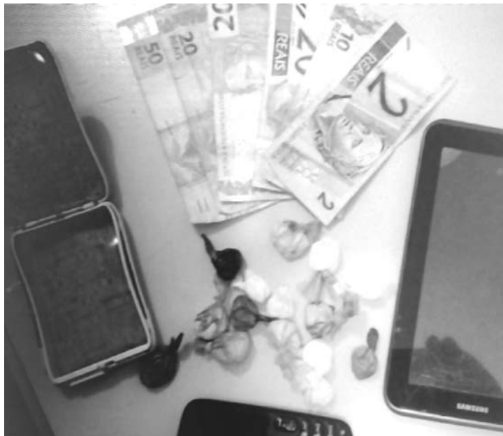
Na Praça de Eventos, foram presos dois jovens e apreendidos com eles cocaína, celulares e dinheiro