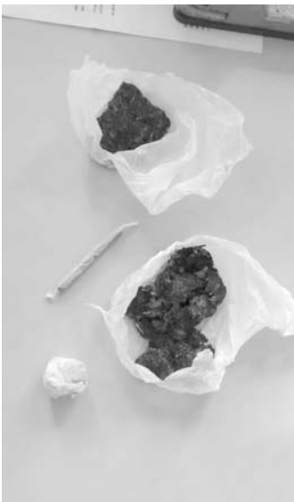
Foram encontrados durante mandado de busca domiciliar em uma das residências, 56,85 gramas de maconha