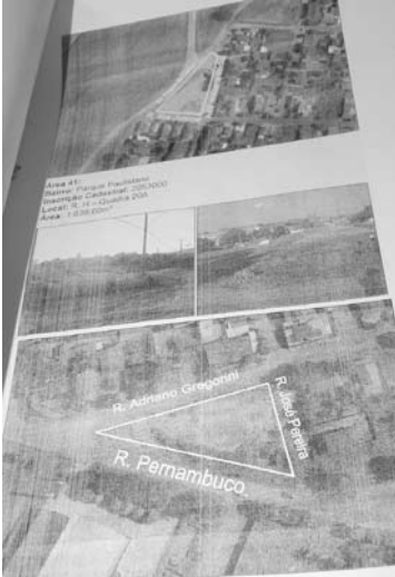
Documentação do estudo sobre as áreas: “Podemos transformar nossa cidade”, assegura Damasceno

lor de cada m² bem abaixo da média do mercado imobiliário local. Esse amplo estudo realizado pela Prefeitura foi protocolado ontem, dia 5, na Câmara Municipal, através de uma resposta a um Requerimento de um vereador.