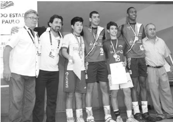
Atletas masculinos que foram os destaques e receberam dos organizadores as Bolsas Talento Esportivo