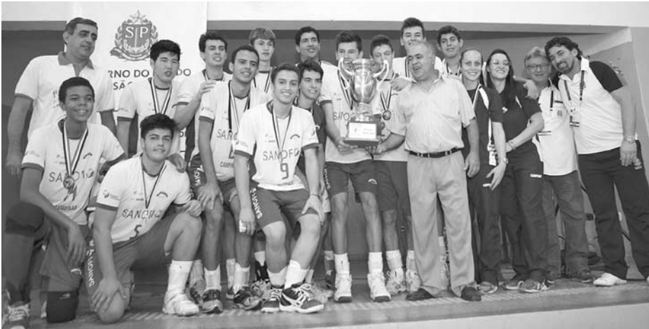
A equipe de Campinas, campeã no masculino e que levantou a taça inédita

→ Da REDAÇÃO contato@oextra.net A 1ª Copa Estadual de Voleibol agitou o município de Ouroeste e toda a região entre os dias 25 e 31 de agosto. O evento esportivo foi organizado pela Secretaria de Esportes, Lazer e Juventude do Estado de São Paulo (SELJ), em parceria com a Prefeitura de Ouroeste, através da Secretaria de Esporte, Lazer e Turismo da cidade. Os destaques da copa foram Araraquara, pelo feminino, e Campinas, no masculino, que levantaram a taça inédita. Para alcançarem o título, as equipes passaram, respectivamente, por São José dos Campos (3 a 1) e Mauá (3 a 0), nas decisões. Campinas ficou com a terceira colocação entre as mulheres e São José do Rio Preto obteve a mesma posição no masculino. Todas as partidas da competição foram disputadas na Quadra Poliesportiva da Escola Sansara e na Quadra Poliesportiva “Mária Aparecida Mota”, em Arará. A competição registrou, ao todo, 44 jogos, entre masculino e feminino. O torneio teve início dia 25 de agosto e terminou no último domingo, dia 31 de agosto. Foram 19 municípios participantes, com 345 atletas inscritos e 389 pessoas envolvidas na com-