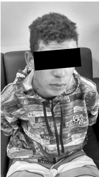
J.M.S., de 17 anos, natural de Ouroeste: adolescente infrator detido durante a ação policial