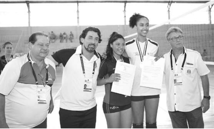
Atletas que foram os destaques no feminino e que receberam dos organizadores as Bolsas Talento Esportivo