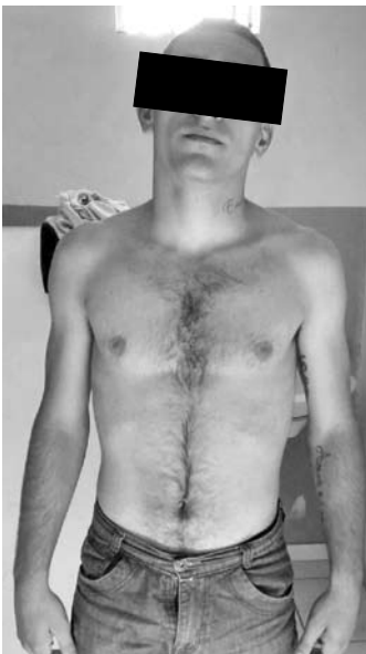
M.J.C.G., de 20 anos, também com antecedentes criminais e natural de Fernandópolis