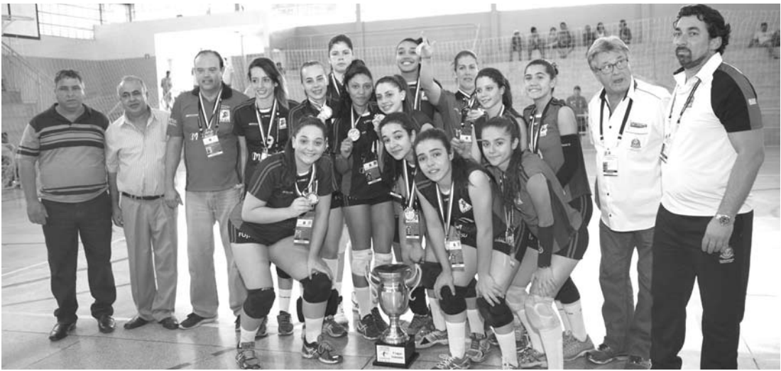
A equipe de Araraquara, pelo feminino, conquistou a 1ª Copa Estadual de Voleibol