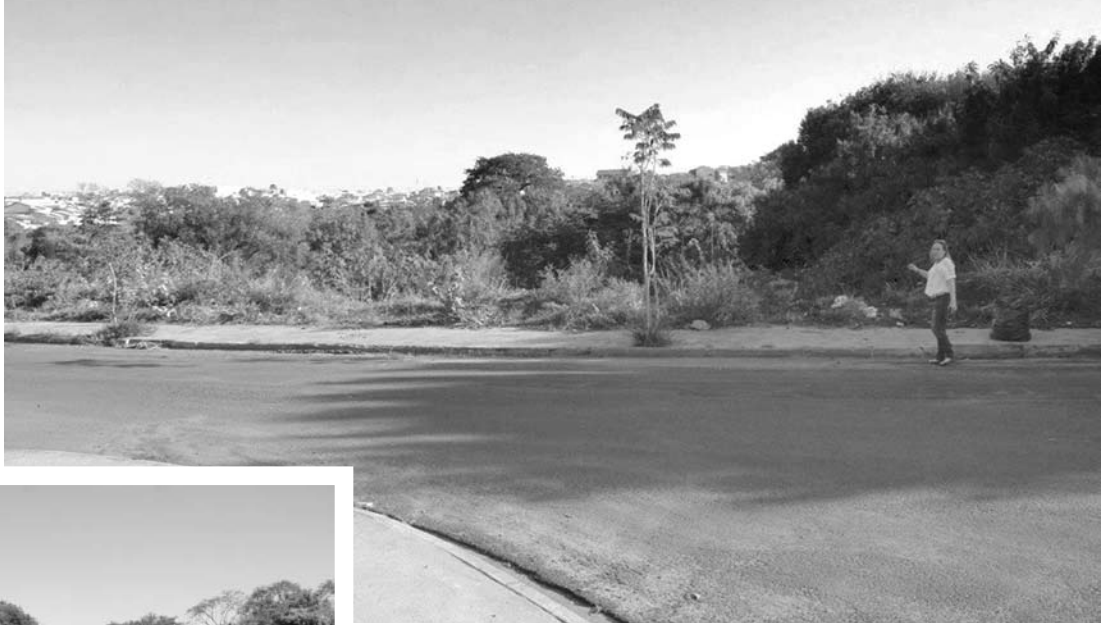
A prefeita Ana Bim visitou os locais onde serão implantados os projetos de infraestrutura e mobilidade urbana: acima, Bairro Pôr do Sol; ao lado, vista da área que receberá a ponte na AV. Teotônio Vilela.