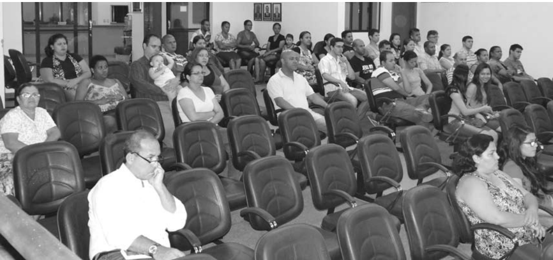
A Sessão Ordinária contou com a presença de evangélicos que acompanharam a aprovação do projeto de Lei

O presidente encerrou seu discurso e os trabalhos da noite deixando seu apoio à Entidade e se colocou à disposição para ajudar e trabalhar junto no que for preciso para o bem do município.