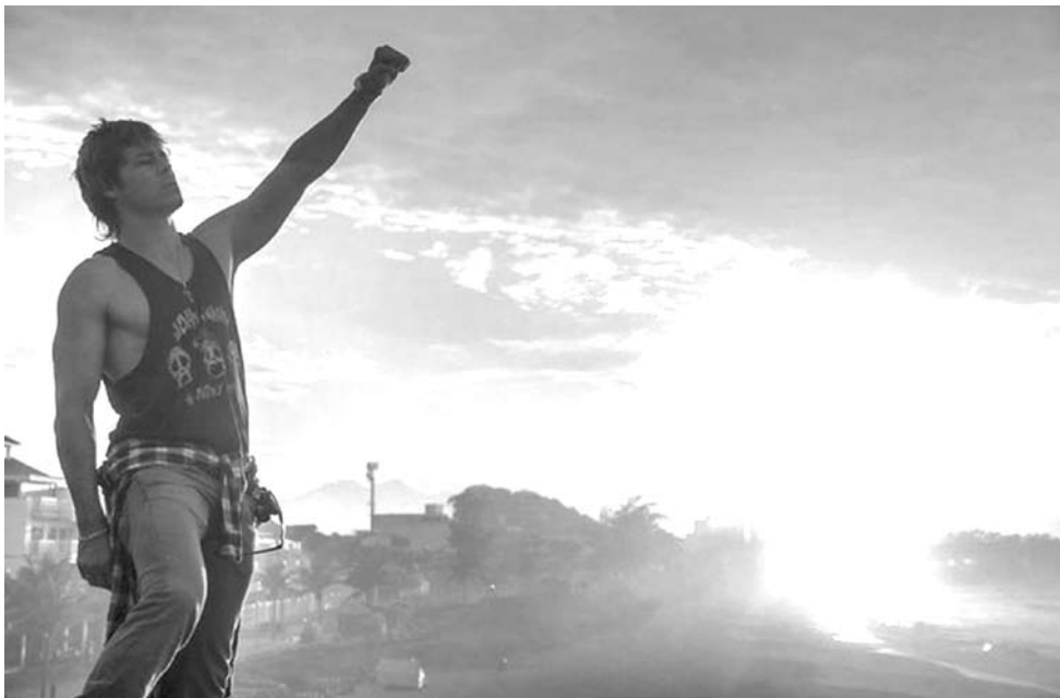
Cantor assume que queria a ex, atual de Gustavo Lima, nas cenas: ‘Ela foi a mulher da minha vida’.