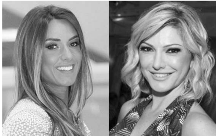
Nicole Bahls X Antonia Fontanelle