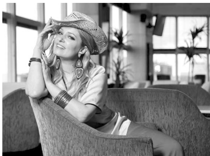
Aos 43 anos, Luciana Vendramini mostra boa forma