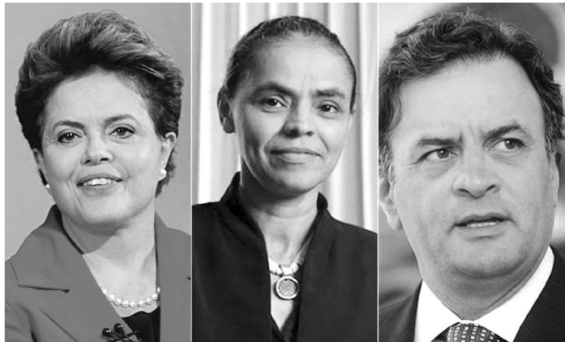
Os candidatos Dilma Rousseff, Marina Silva e Aécio Neves

O Ibope ouviu 2.002 eleitores em 144 municípios entre as últimas sexta (5) e segunda-feira (8). A margem de erro é de dois pontos percentuais para mais ou para menos. O nível de confiança é de 95%, o que quer dizer que, se levarmos em conta a margem de erro de dois pontos para mais ou para menos, a probabilidade de o resultado retratar a realidade é de 95%. A pesquisa foi registrada no Tribunal Regional Eleitoral de São Paulo (TRE-SP) sob o protocolo BR-00593/2014.