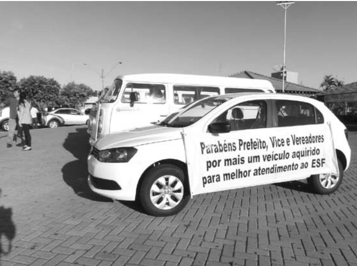
Gol Zero Km que foi adquirido com recursos de uma emenda parlamentar e será destinado à Estratégia da Saúde da Família de Arabá