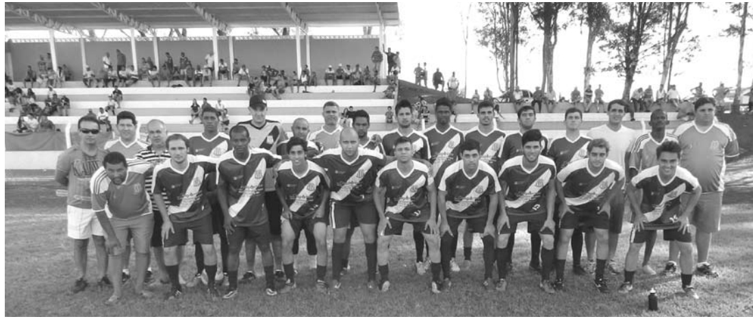
Jogadores e equipe técnica que integram o Clube Esportivo de Ouroeste

O C.E.O. - Clube Esportivo de Ouroeste, estreia amanhã, dia 14, no 3º Campeonato Regional de Futebol Amador, em Arabá. Nesta rodada, vão duelar Mira Estrela e São João do Itacema, a partir das 13h30, e C.E. Ouroeste e São João das Duas Pontes, a partir das 16h. As partidas acontecem no Estádio Municipal "Diego Gomes Melo", em Arabá. O campeonato teve início