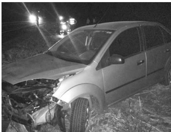
À esquerda, Oswaldinho, vítima fatal do acidente; acima, Uno totalmente destruído e o Fiesta ainda no local da colisão