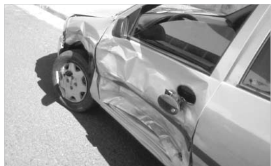
O Uno e o Celta envolvidos no acidente: por sorte, colisão não vitimou nenhum dos ocupantes dos veículos