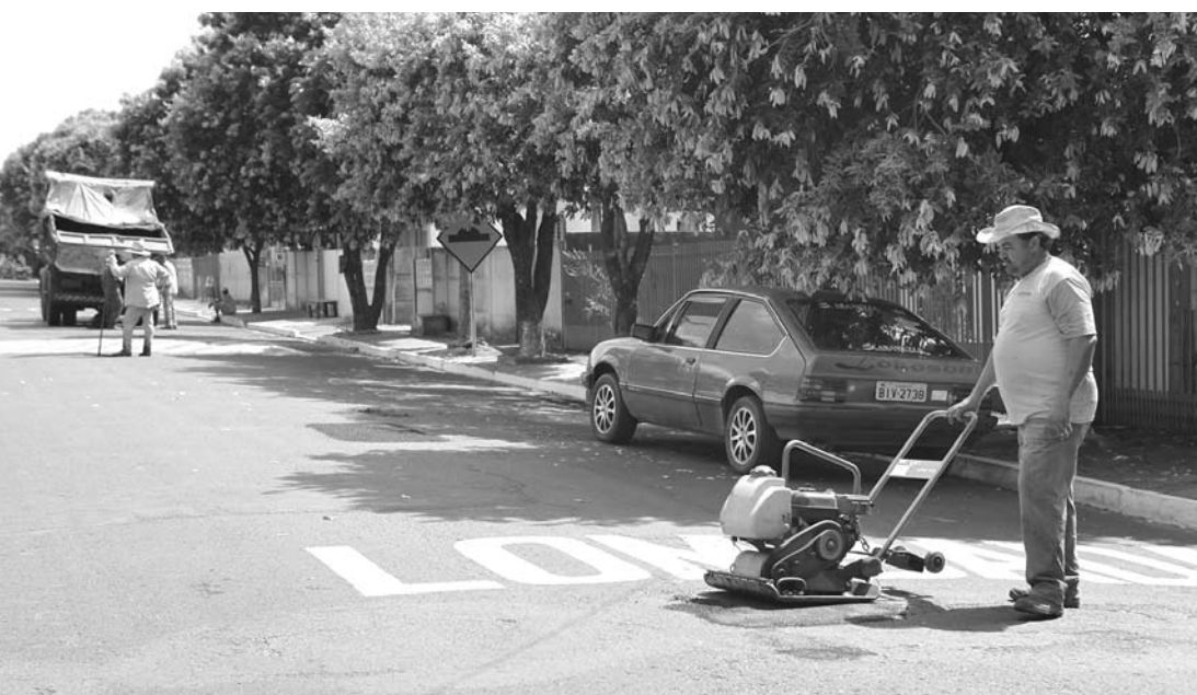
Com a operação "tapa-buracos", os locais irão garantir aos motoristas e pedestres mais segurança

nos serviços públicos que são oferecidos à população do município no setor da Educação e da Saúde.