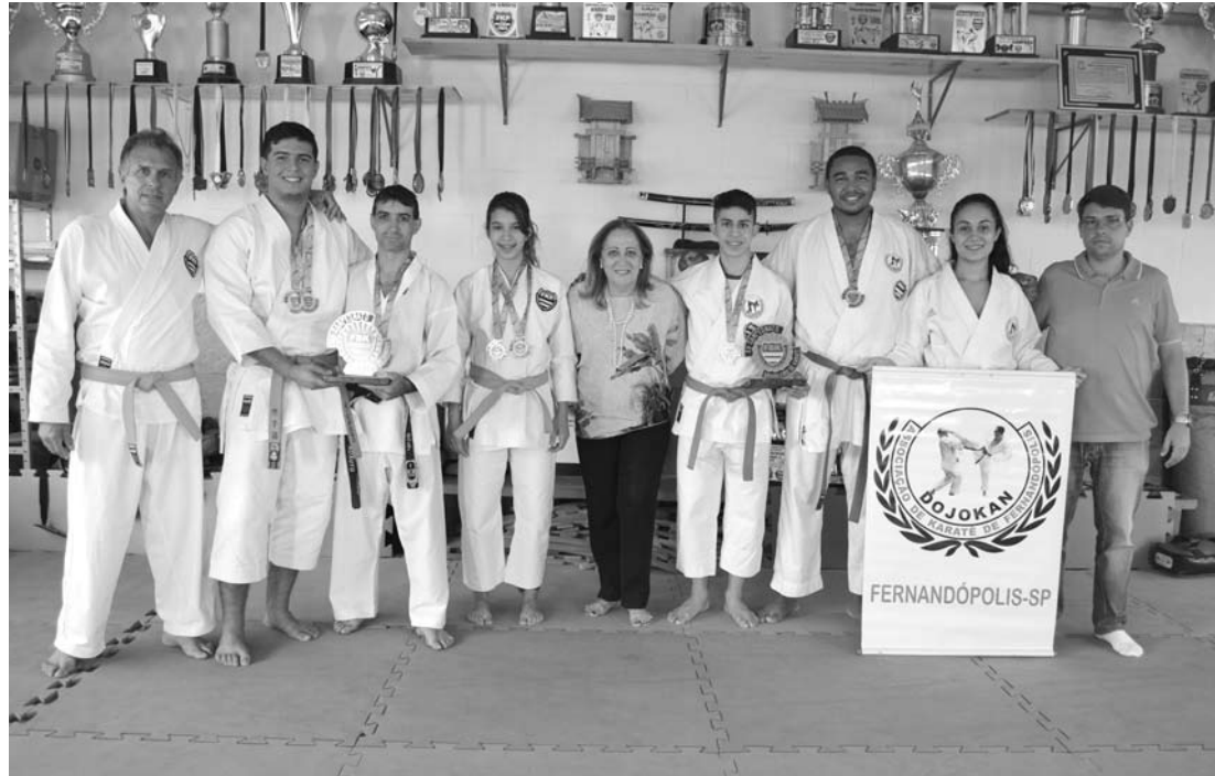
Equipe da Dojokan de Fernandópolis recebendo a prefeita Ana Bim em dia de treinamento