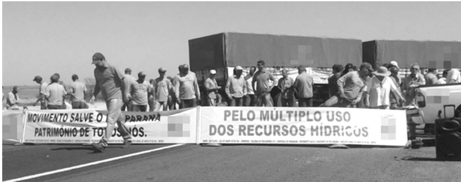
Cerca de 50 piscicultores protestam contra o baixo nível, que prejudica a produção de pescados em tanques redes

A cota oficial de acordo com a legislação é a 323 e hoje a UHE de Ilha Solteira está operando na cota 320, que prejudica a produção de pescados em tanques redes. Este segmento que emprega cerca de três mil trabalhadores já começou a demitir funcionários devido a queda na produção