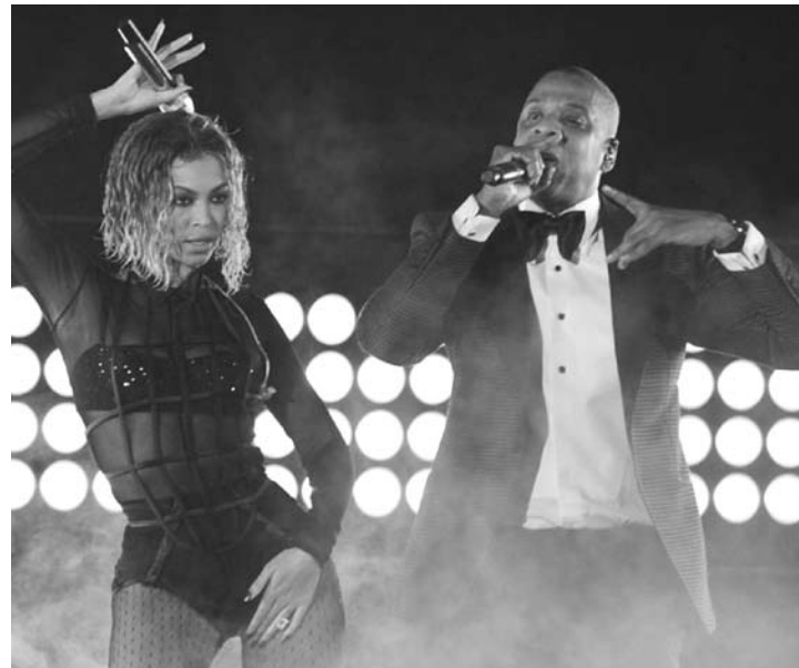
Suposições ainda não foram confirmadas

Se para bom entendedor, meia palavra basta, uma letra de rap, então, é um banquete. Pois foi assim que surgiu o mais novo rumor envolvendo o poderoso casal Beyoncé e Jay-Z.