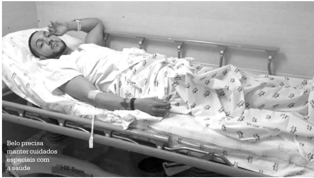
Belo precisa manter cuidados especiais com a saúde

nhou cinco dias de atestado para ficar de repouso em casa, recebendo atenção especial da esposa Gracyanne Barbosa. “Cuidando do meu tudão, logo ele estará bem e de volta aos palcos pra vcs”, escreveu a modelo para seus seguidores no Instagram.