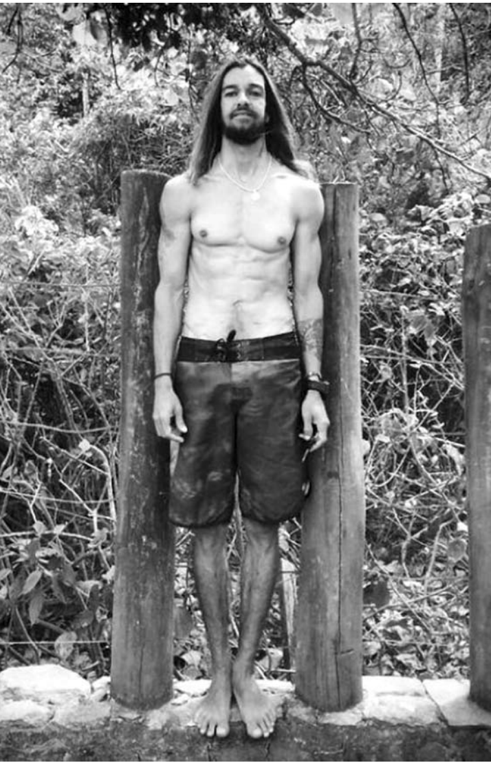
Cantor Armandinho reaparece

Apesar de confuso, o músico continua fazendo alguns shows pelo Brasil. Armandinho também aproveita o que lhe resta da fama para pedir pela preservação dos oceanos