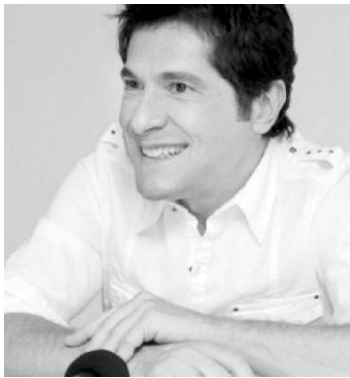
Cantor Daniel assume antigo boato com Tiazinha