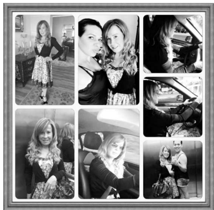
Linda, leve e loira

Amigos do mineiro e os fãs de Anitta já aprovam o relacionamento e fazem campanha nas redes sociais para a oficialização dos pombinhos. O rapaz de 21 anos, que conheceu Anitta no ano passado, já publicou várias fotos agarradinho com a cantora. A última imagem foi feita no sábado em uma boate em Pará de Minas, onde ela se apresentou. Parece que o fã pegou a onda e está seguindo a morena onde quer que ela vá.