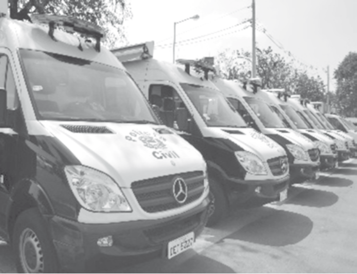
A ampliação dobrará o número de cidades onde acontecem as fiscalizações da Lei Seca

geradores de energia, sinalização e etilômetros (popularmente conhecidos por bafômetros), entre outras ações educativas.