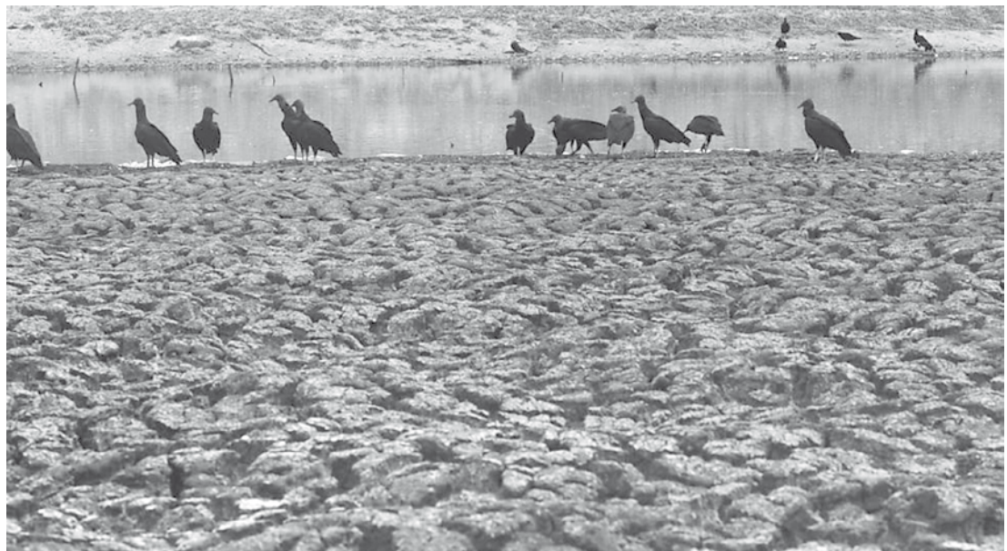
A falta de água no Nordeste: o medo que o Sudeste começou a sentir com a estiagem de 2014

*Com informações do “Jornal Folha de São Paulo”