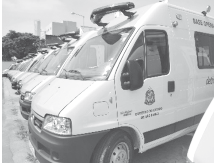
As novas viaturas serão destinadas a sete regiões do Estado, para a prevenção de acidentes