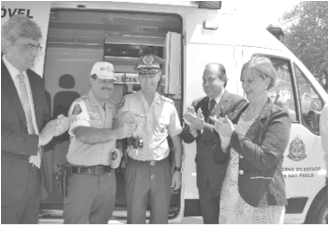
Foram investidos R$ 5 milhões na compra dos novos veículos

As blitz vão acontecer em 18 municípios durante a Semana Nacional do Trânsito, que vai de 18 a 25 de setembro. As ações vão fiscalizar o cumprimento da Lei Seca (12.760/12) por parte dos motoristas, conscientizá-los quanto ao